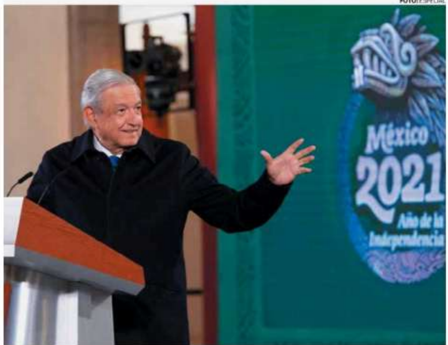
• REFORMA. El Presidente aseguró que hay interés de empresarios de colaborar de manera honesta.