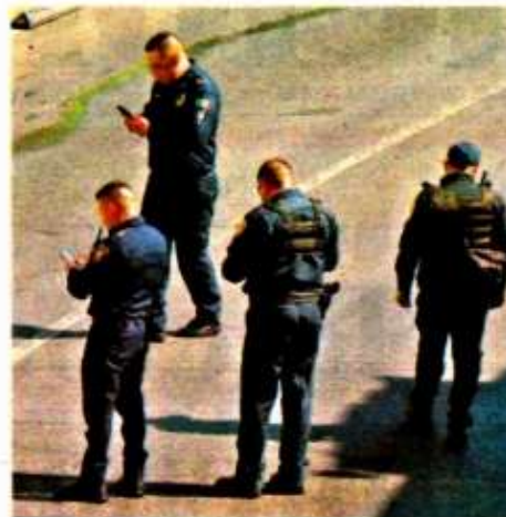
Buscan reformar y adicionar diversos artículos de la Ley de Armas de Fuego y Explosivos

Cada año cerca de 213 mil armas de fuego son transportadas ilegalmente a México, según agencia estadounidense