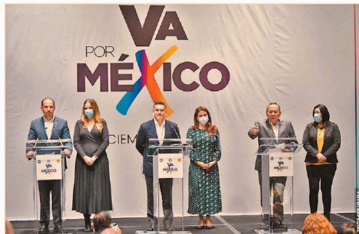
En conferencia de prensa, los líderes de la coalición Va por México aseguraron que buscarán unir fuerzas para ganarle a Morena.

La intención es buscar acuerdos que garanticen la competitividad y rentabilidad electoral de la coalición, así como construir plataformas de