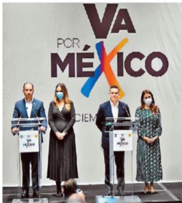
Los dirigentes no descartan pactos con otros partidos. ESPECIAL