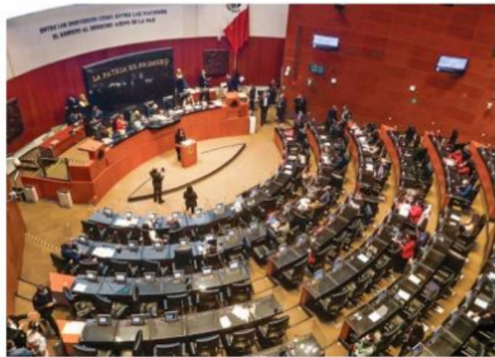
PERIODO. Este martes se llevó a cabo la sesión ordinaria en la Cámara alta.

Por otro lado y pese a que en México se registran en promedio 44 muertes diarias a causa de accidentes viales, el Senado aprobó la nueva Ley General de Movilidad y Seguridad Vial que no contempla la regulación o prohibición de los tráileres doble remolque y tampoco establece la obligatoriedad de que todos los conductores y vehículos cuenten con un seguro de responsabilidad civil.