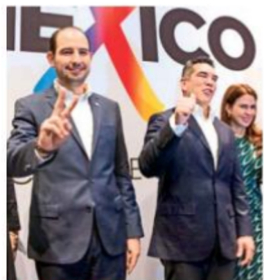
VAPORMÉXICO. Marko Cortés y Alejandro Moreno durante el anuncio; pendiente, coalición en Oaxaca y QR.

Este anuncio ocurre de cara a la fecha límite de presentación y suscripción de las coaliciones totales o parciales ante el Instituto Nacional Electoral (INE), tiene hasta las 23:59 del próximo miércoles 23 de diciembre. / MARCO FRAGOSO