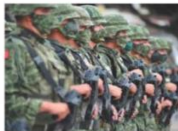
Busca evitar dualidades en las atribuciones de las Fuerzas Armadas.

"La presente iniciativa plantea integrar la fuerza militar terrestre y las direcciones Generales antes mencionadas, bajo la dirección y conducción de la Comandancia del Ejército", refiere. ●