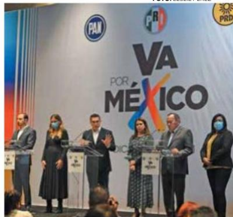
• UNIDOS. Los dirigentes del PAN, PRI y PRD anunciaron su estrategia electoral.