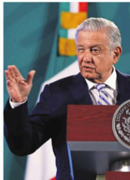
Diego Simón / EL UNIVERSAL

En su mañanera, el presidente López Obrador pidió a la oposición anteponer el interés nacional.