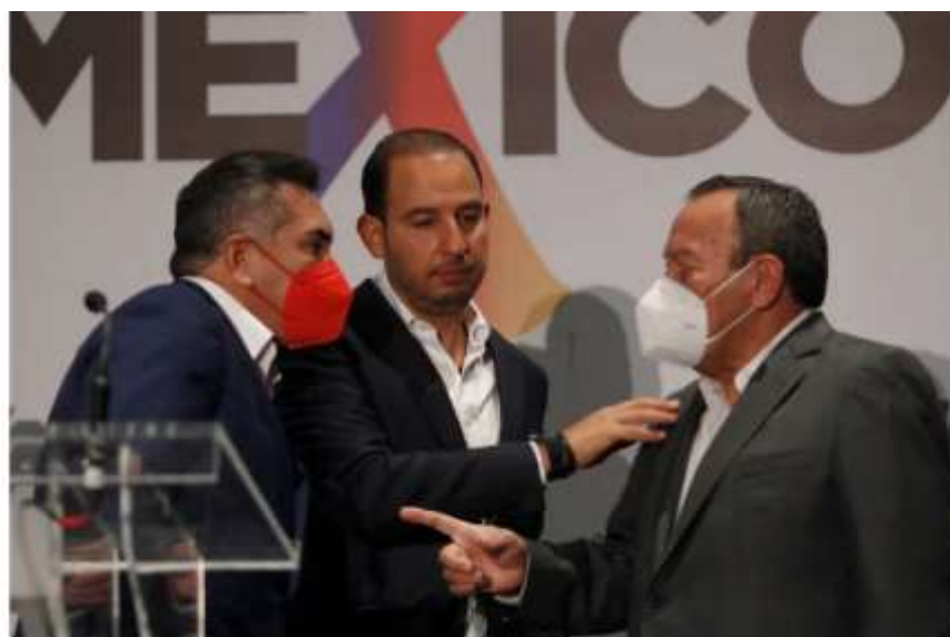
La coalición Va por México ratificó su alianza en cuatro de las seis candidaturas a gubernatura

Este martes 14 de diciembre, los líderes de los tres partidos políticos que conformaron la coalición Va por México , aseguraron que irán juntos en, al menos, cuatro de seis candidaturas por gubernaturas que se disputarán el próximo año.