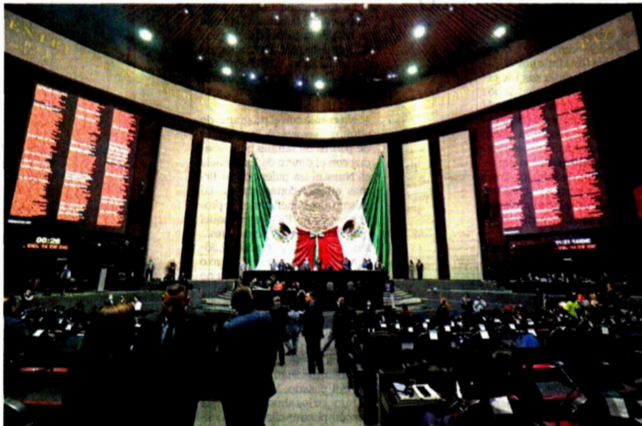
Legisladores aprobaron la Cuenta Pública 2019, en la cual se realizaron mil 358 auditorías al ejercicio del gasto; sin embargo, la oposición subrayó que hay muchos rubros que reflejan subejercicios y eso representa serias anomalías.