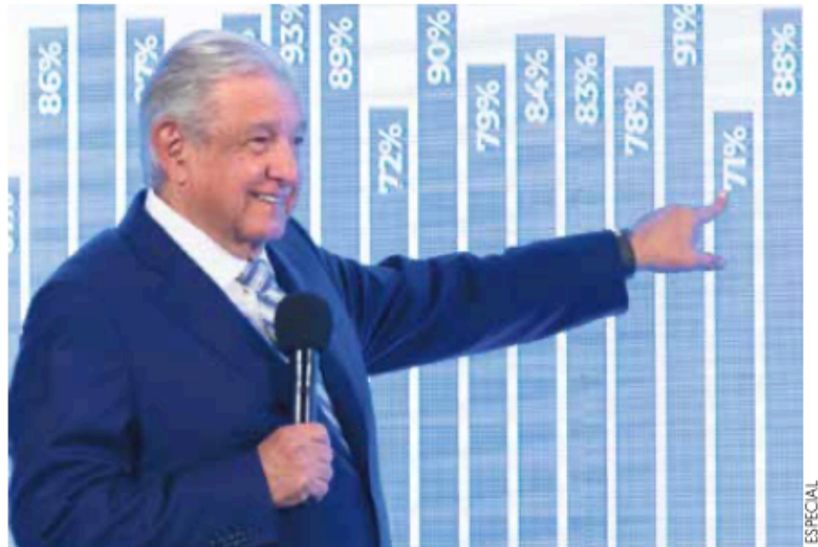
CONFERENCIA. El presidente López Obrador, ayer, en Palacio Nacional.

“Por qué es necesaria la reforma constitucional en materia eléctrica, en qué consiste la reforma eléctrica,