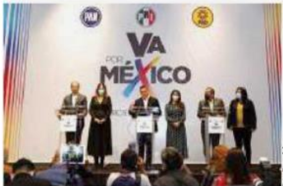
LOS LÍDERES del PAN, PRI y PRD en conferencia de prensa, ayer.

Candidatas lanzará Va por México en 2022