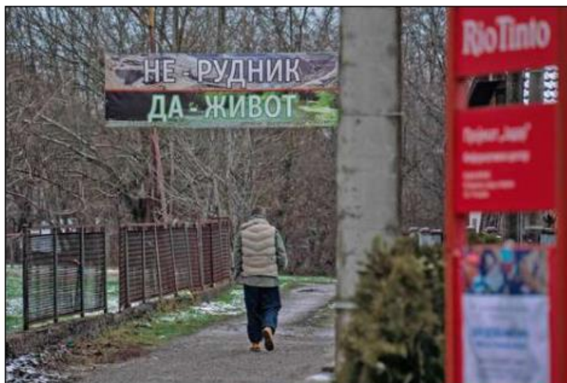
▲ Un activista medioambiental pasa bajo un cartel de protesta junto a la oficina de la empresa minera anglo-australiana Rio Tinto, que planea construir una mina para la explotación de litio en la aldea de Gornje Nedeljice, en Serbia.

En los pasados cuatros meses el precio internacional del litio se ha disparado 152 por ciento como resultado de una mayor demanda y temores de escasez de este mineral, clave en la elaboración de baterías para autos eléctricos, pero que también es importante en la elaboración de teléfonos y computadoras.