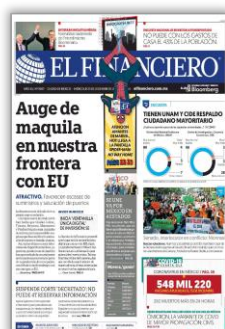
Auge de maquila en nuestra frontera con EU