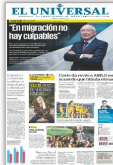
"En migración no hay culpables"