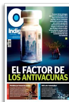
El factor de los antivacunas