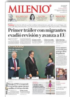
Primer tráiler con migrantes evadió revisión y avanza a EU