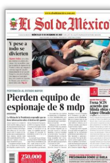
Pierden equipo de espionaje de 8 mdp