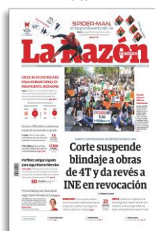
Corte suspende blindaje a obras de 4T y da revés a INE, en revocación