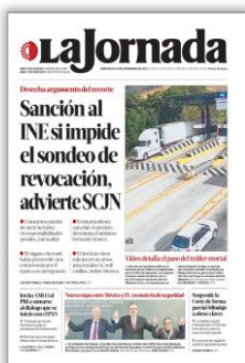
Sanción al INE si impide el sondeo de revocación, advierte SCJN