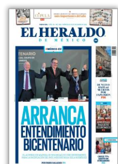
Arranca entendimiento bicentenario