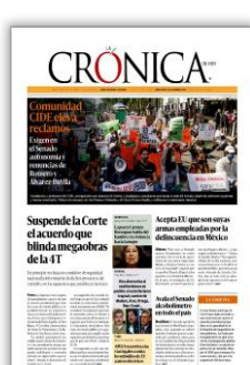
Suspende la Corte el acuerdo que blindó megaobras de la 4T