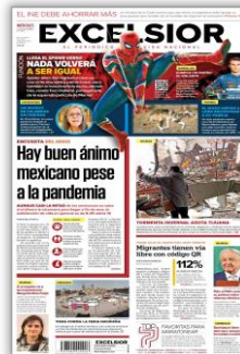
Hay buen ánimo mexicano pese a la pandemia