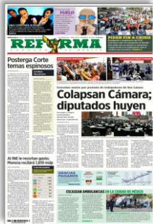
Colapsan Cámara; diputados huyen