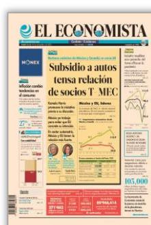
Subsidio a autos tensa relación de socios T-MEC