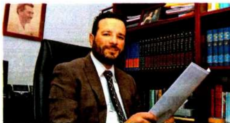
El magistrado señala que el primer sujeto obligado a respetar la ley es el funcionario público