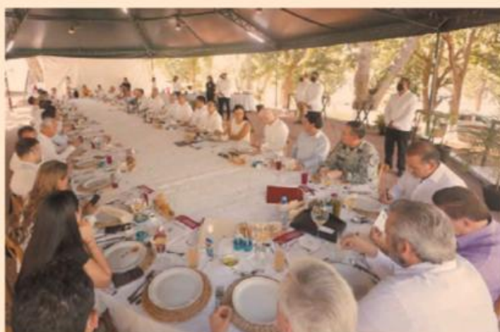
La semana pasada, el presidente López Obrador se reunió con 31 de los 32 gobernadores del país en el marco de la LXI reunión de la Conago.

“Entonces, el sentido de la Conago, que era diferenciarse del presidente, exigirle, negociar, dialogar, como ya cada vez hay más