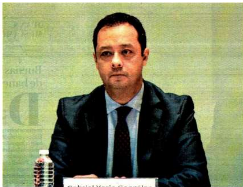
El funcionario publicó en Twitter el proyecto de inversión anual. ARACELI LÓPEZ

Además, este trimestre, se subastan los Bonos F (Bonos de Desarrollo del Gobierno Federal que son títulos de deuda pública) uno, dos y tres años de forma semanal, entre otros datos. ■