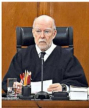
■ González Alcántara negó al Inegi subir sus salarios.

gi gana 149 mil pesos netos mensuales, mientras que los vicepresidentes perciben 143 mil pesos netos, a los que hay que sumar prestaciones que se pagan anual o semestralmente.