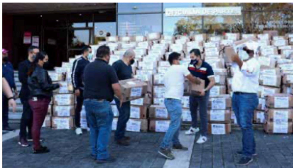
ACTO. La asociación Que Siga la Democracia, al entregar 3 millones de firmas.

y captura de datos, que tenga copia de la credencial de elector y el cotejo con el padrón y la lista nominal.