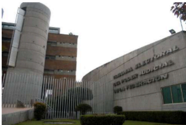
Sede del Tribunal Electoral del Poder Judicial de la Fe- deración.