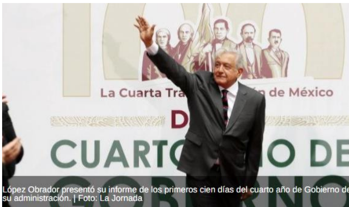
López Obrador presentó su informe de los primeros cien días del cuarto año de Gobierno de su administración.

En el marco de la discusión de la reforma eléctrica en el Congreso mexicano, el presidente Andrés Manuel López Obrador afirmó que buscan garantizar la soberanía energética del país.