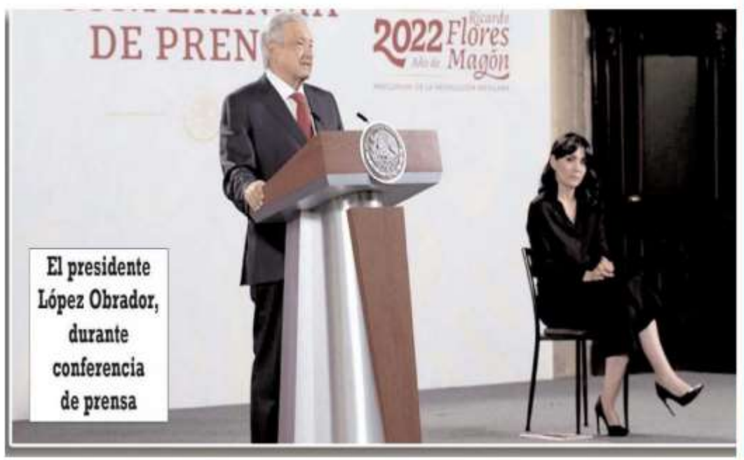
El presidente López Obrador, durante conferencia de prensa