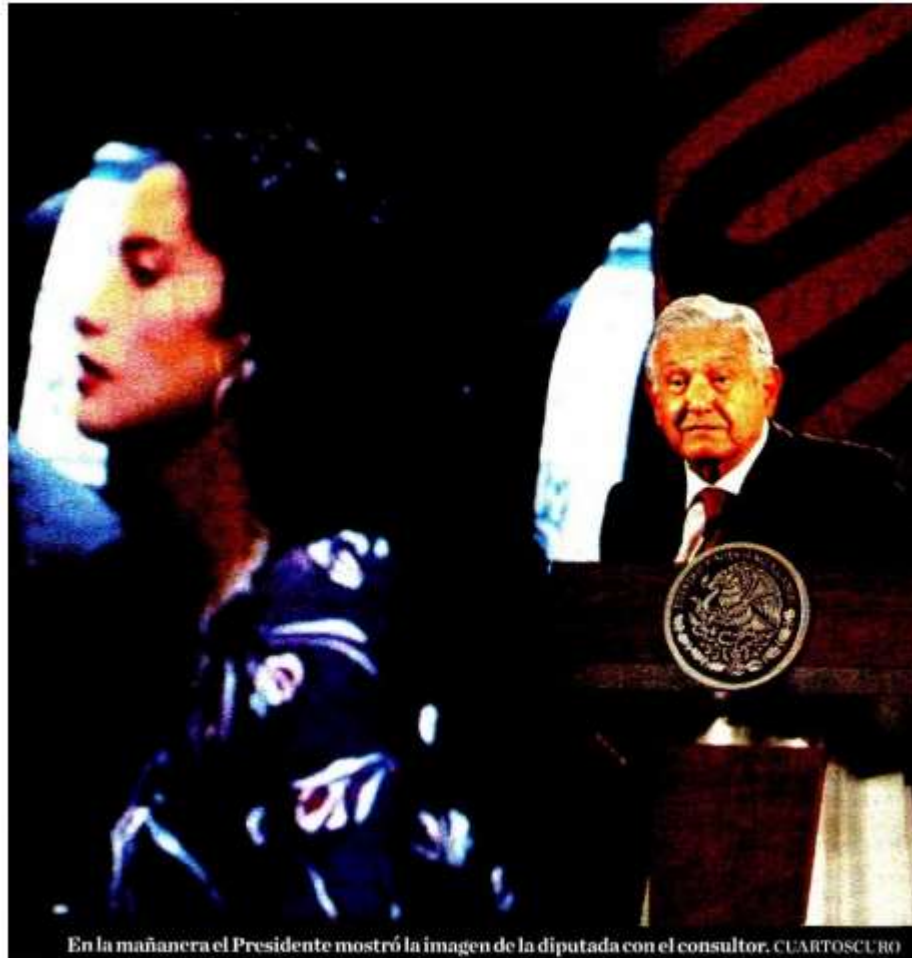
En la mañana el Presidente mostró la imagen de la diputada con el consultor.