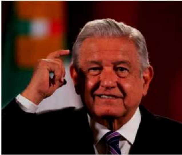
El Presidente acusa que domina el cabildeo de coyotes.

transitorios que el litio sea de uso exclusivo de la nación, pues se trata de un mineral estratégico para el desarrollo de México. Resaltó que la decisión de la Suprema Corte de declarar constitucional la ley eléctrica ya ayuda a fortalecer a la Comisión Federal de Electricidad, pero aun con ello se requiere de la reforma constitucional •