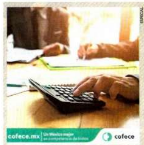
Cofece se encarga de vigilar y garantizar la libre competencia en el mercado medcano.

Derivado de lo anterior y con fundamento en el artículo 99 de la LFTAIP, este Órgano Interno de Control considera que la información requerida debe permanecer con el carácter de reservada, por un periodo de cinco años, el cual es estrictamente necesario para que concluyan las investigaciones y los procedimientos de responsabilidades administrativas.