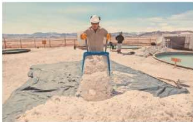
El litio es ocupado para la producción de baterías de celular, computadoras y autos eléctricos.