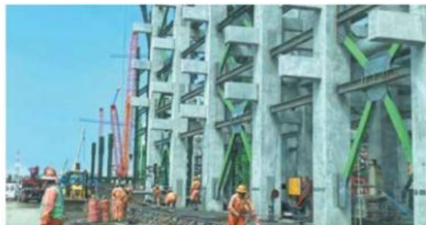
TRABAJO. Rengen Energy ha desarrollado proyectos de hace varios sexenios.

"Lo que está muy volátil es el entorno en cuanto a las inversiones privadas, esto va a depender mucho de lo que suceda o aprueben los diputados en la Cámara ahora con el