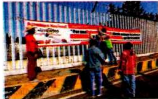
Afuera de la Cámara de Diputados organizaciones y simpatizantes del Presidente

en el acceso principal de San Lázaro, sede de la Cámara de Diputados, en apoyo a la Reforma Eléctrica.