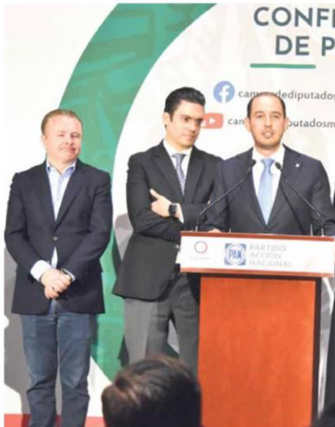
POSTURA. Marko Cortés, líder nacional del PAN, ayer, en conferencia.

El señalamiento. "Es muy lamentable que esas prácticas del pasado, que se suponían ya superadas, hoy las veamos en este gobierno morenista que decían que eran distintos", remarcó.