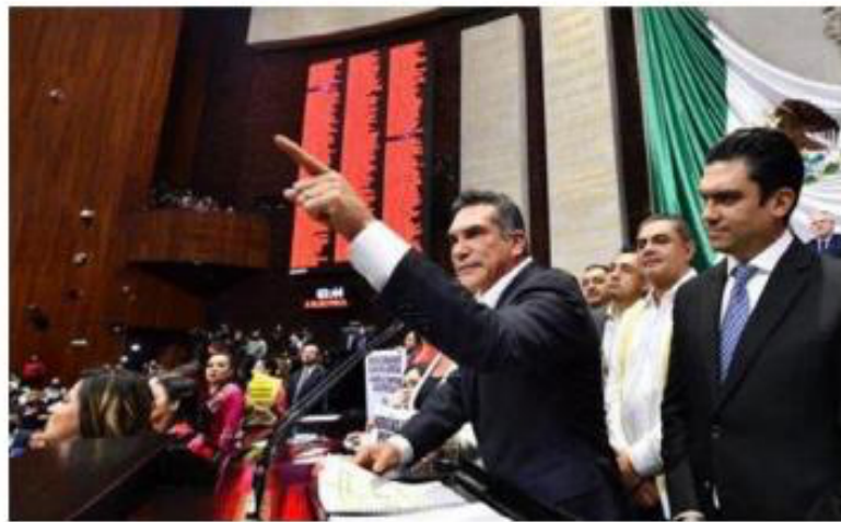
Alejandro Moreno, durante la presentación del posicionamiento del PRI en la Cámara de Diputados.

Justo cuando se lleva a cabo la sesión en la Cámara de Diputados donde se discute la reforma eléctrica de López Obrador, el líder de los panistas advirtió que