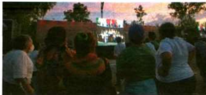
Simpatizantes de AMLO siguieron la sesión a las afueras de San Lázaro.