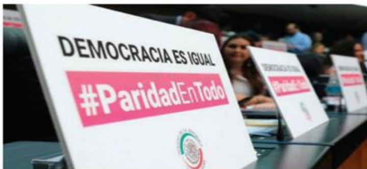
La paridad de género, una quimera.

Solo el 40% de dependencias del gobierno federal están encabezadas por mujeres, es decir 8 de 20, mientras que en todo el país solo 46 de 524 instituciones de la administración pública están dirigidas por una mujer, es decir, tan solo el 8.8 por ciento.