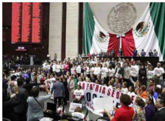
El debate de la Reforma Eléctrica, tras posponerse por seis meses desde su propuesta, ocurrió en medio de una confrontación anticipada.

Como lo adelantaron los líderes de la oposición y tras un acalorado debate que se extendió durante horas, la Reforma Eléctrica de Andrés Manuel López Obrador se quedó en el tintero: no alcanzó los votos para su aprobación