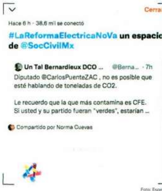
Anoche así observaba la tendencia en Twitter del space de discusión el cual tuvo una participación de más de 38 mil usuarios.

A pesar de ser domingo esta es la primera ocasión en que el activismo virtual de diversos grupos sociales fue parte innegable de la dinámica de trabajo de los diputados federales, al grado que los propios legisladores fueron informando durante el día los pormenores de la sesión del pleno.