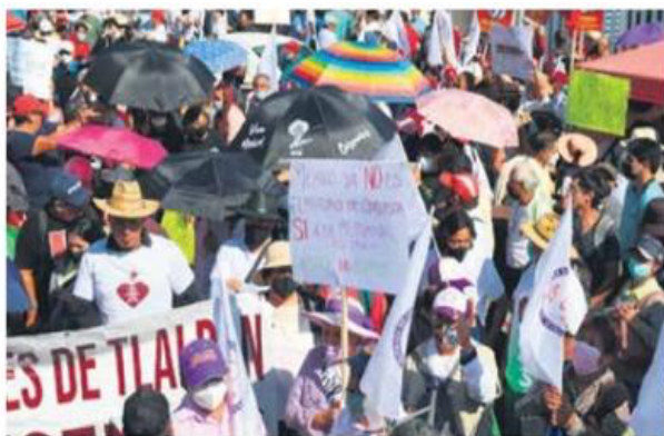
RESPALDO. Personas afines a Morena, al pronunciarse a favor de la ley eléctrica.

DAVID SAÚL VELA dsvela@elfinanciero.com.mx