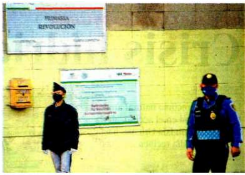
Panistas en el Congreso local exigen que todas las escuelas de educación básica sean de tiempo completo