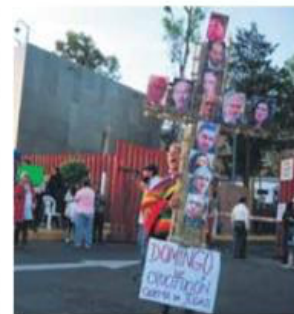
CRITICA. Una mujer sostiene una cruz con los rostros de expresidentes.

Muchos de los asistentes, integrantes de sindicatos como el SME,