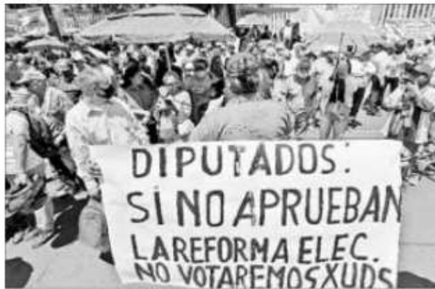
▲ Simpatizantes de Morena se apostaron frente a San Lázaro para exigir el aval al proyecto eléctrico.

Remarca que nuestro país tiene importantes reservas de litio que “deben ser preservadas en beneficio del interés general y no de intereses mercantiles nacionales o extranjeros”.