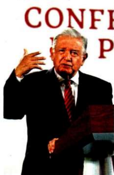
El Presidente pidió a los diputados de oposición no temer agresiones del pueblo.

"Basta de hipocresía, de acuerdos en lo oscuro, las élites en los restaurantes de lujo y que la gente no sepa cuando se trata del bienestar del pueblo"