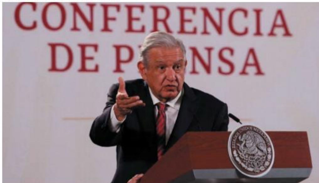
El presidente citó a Lázaro Cárdenas y Adolfo López Mateos.

EL EJECUTIVO descartó que en México exista una polarización como tal, a menos que sea entre la élite y el pueblo, tras haber perdido privilegios por sentirse dueños del país