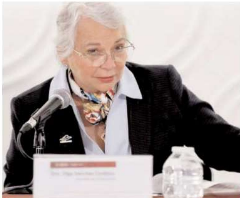
Olga Sánchez, presidenta Mesa Directiva del Senado