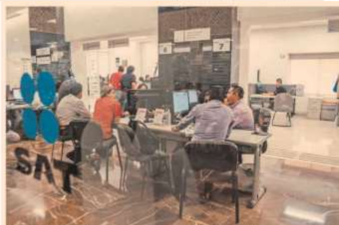
La facilidad en el pago de impuestos le gustó a los contribuyentes que optaron por el Resico.