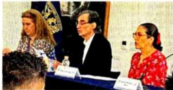
■ José Woldenberg, ex presidente del IFE, señaló que los órganos autónomos no son oficinas del Gobierno.

“(Debemos) Crear los mecanismos que permitan sancionar con rigor la intromisión indebida y la entrega de dinero de funcionarios en procesos electorales”.