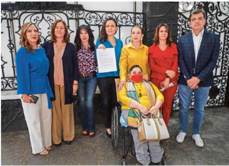
ACCIÓN. Integrantes de las bancadas del PAN, PRD y PRI en la Cámara de Diputados entregaron a la Alta Comisionada de las Naciones Unidas para los Derechos Humanos, una carta.

Cuestionado sobre la campaña de su partido contra los diputados que se rechazaron su reforma energética, López Obrador dijo que no haya confrontación, "y tampoco tenerle miedo a lo que llaman polarización, e sono existe