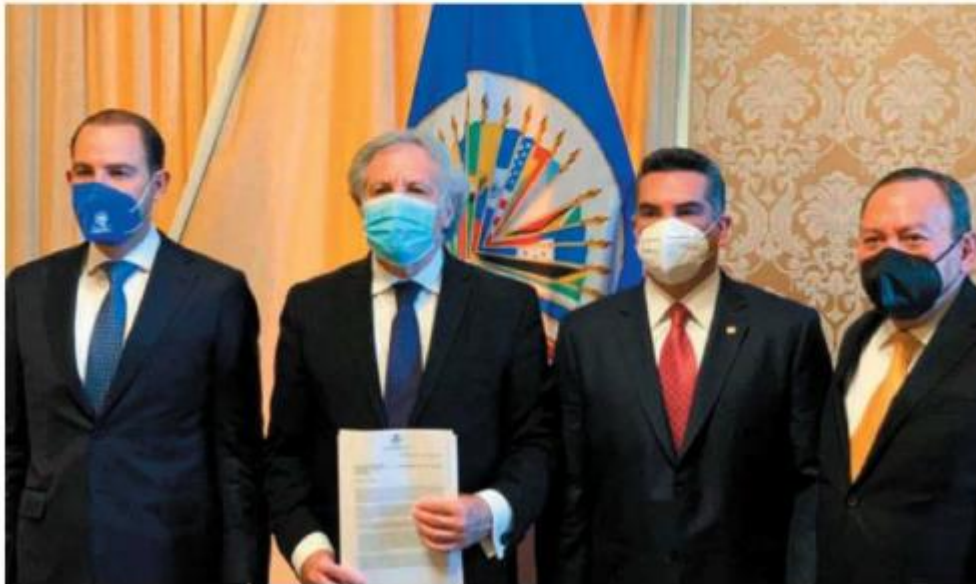
Los diputados alegan violaciones a tratados internacionales de DH.

Por otra parte, Gómez del Campo adelantó que recurrirán a otras instancias internacionales como la Organización de Estados Americanos (OEA), la Comisión Interamericana de Derechos Humanos (CIDH) y el Parlamento Europeo. ■