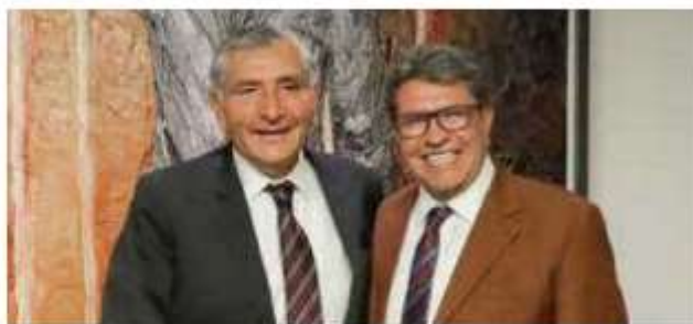
Adán Augusto López, titular de la Segob, y Ricardo Morreal Ávila, coordinador de Morena en el Senado.

les, el senador refirió que frecuentemente conversa con el titular de la Segob, “en un auténtico diálogo entre Poderes y en una franca colaboración”.