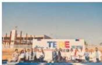
En alianza con el personal de salud, la candidata promoverá acciones encaminadas a ampliar la cobertura de los servicios médicos.

A través del programa "Seguro Aguascalientes", se atenderá a quienes no cuentan con afiliación a los sistemas de salud, que actualmente representa a 2 de cada 10 personas en el estado, ade-