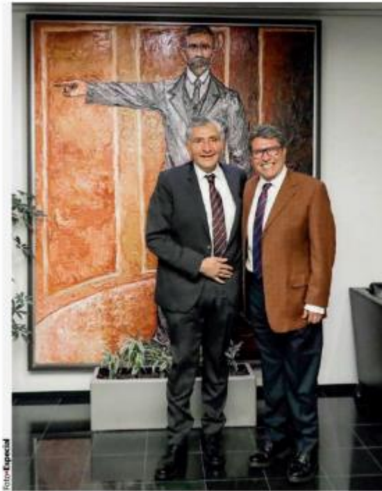
EL TITULAR de Gobernación, Adán Augusto Ló- pez, con el líder de los senadores de Morena, Ricardo Monreal, ayer.