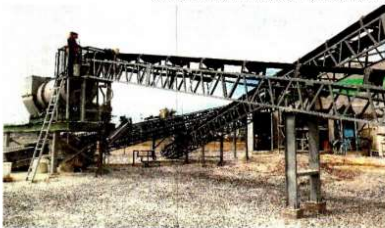
Los mineros canadienses se preguntan que ocurrirá con las concesiones actuales.

No se incluyó en el texto del Tratado entre México, Estados Unidos y Canadá (T-MEC) el uso exclusivo del litio para el gobierno, de manera que la reforma va en contra de dicho acuerdo. ●