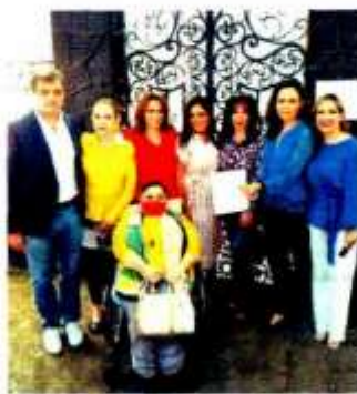
ENTREGA. Legisladores de partidos de oposición, ayer, al dar la misiva.

En una carta entregada ayer en las oficinas de la representación de la ONU en el país, solicitaron “que haga un llamado urgente a cesar la promoción de la violencia, al restablecimiento de la prudencia, a la garantía de la protección de la diferencia de ideas y al mantenimiento de la libertad de ideas, de creencias y de expresión en el mantenimiento de la democracia y paz social que siem-