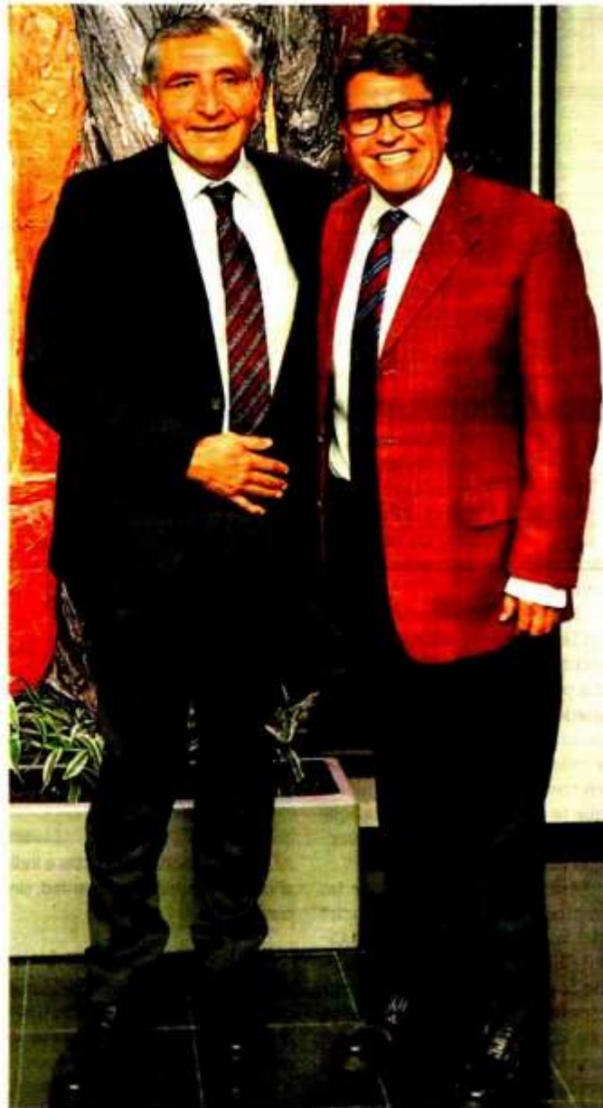
DIÁLOGO. Adán Augusto López y Ricardo Monreal, ayer.