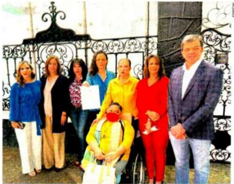
En la misiva entregada a Naciones Unidas en México, los legisladores argumentan que los ataques de odio violan el Pacto Internacional de Derechos Civiles y Políticos.