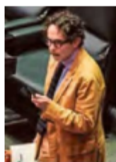
LEGISLADOR. El diputado federal del PAN, Gabriel Quadri de la Torre.

La inscripción del legislador panista al registro de agresores servirá como un insumo para que la ciudadanía conozca el caso por el que se le sancionó, y se podrá consultar en la plataforma del INE sobre violencia política en razón de género.