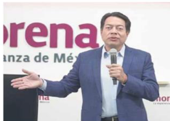
ADVERTENCIA. Mario Delgado, líder de Morena, ayer, en conferencia.

Mario Delgado afirma: "Esto no es de colores, no es de partidos, esto es de defensa del país y una cuestión de soberanía".