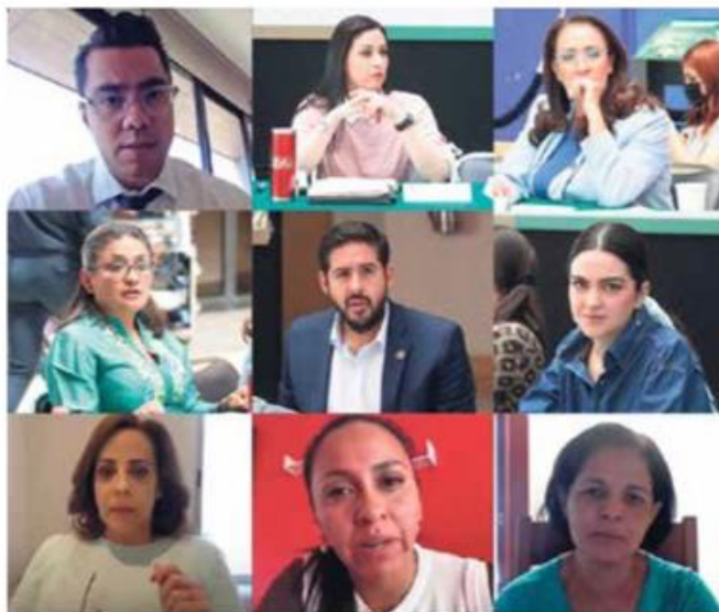
DEBATE. Ayer se realizó una reunión extraordinaria de la Comisión de Justicia.

También se indica que serán imprescriptibles las sanciones señaladas en el artículo 209 Quáter.