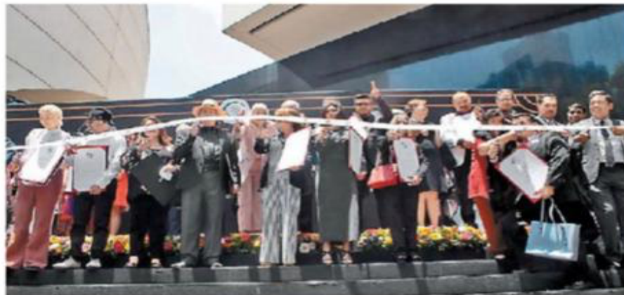
Políticos y autores cortaron el listón de la exposición El rostro del autor .