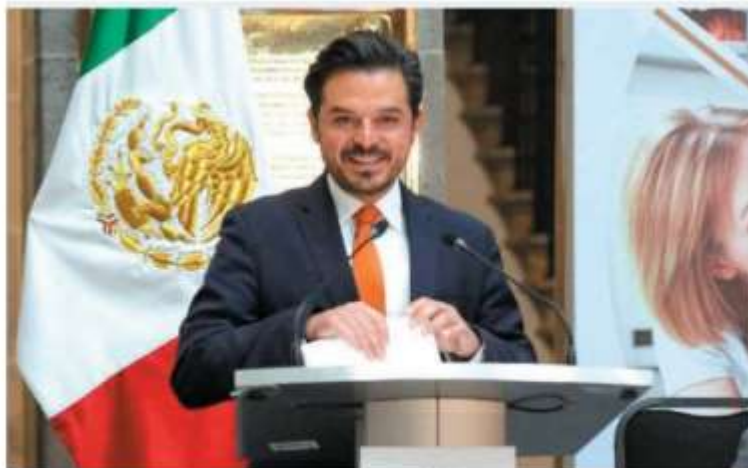
Se presentó la respectiva iniciativa en el Senado de la República.

También en la Cámara de Diputados, donde se realiza también la Semana Nacional de la Seguridad Social, el funcionario encabezó la conferencia magistral "Seguridad Social y Estado de Bienestar" donde indicó que los 14 gobiernos estatales que firmaron los acuerdos iniciales son: Ciudad de México, Tlaxcala, Colima, Campeche, Baja California Sur, Durango, Michoacán, Morelos, Oaxaca, Sonora, Sinaloa, Tlaxcala, Veracruz y Zacatecas. ●