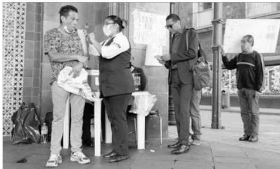
^ El director del IMSS consideró que el país "está muy cerca de dejar atrás" la pandemia. La imagen fue captada ayer en el Centro Histórico de la Ciudad de México.