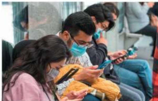
El padrón reuniría los datos de 129 millones de usuarios.