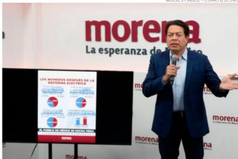
Mario Delgado, presidente de Morena, anuncia cambio de estrategia.

Por ejercer su derecho a no votar la reforma eléctrica, Delgado va contra 223 legisladores