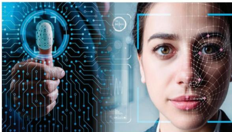
El Panaut no mantenía un equilibrio entre la necesidad de los datos y el derecho a la privacidad de los usuarios.

A finales de octubre, la Suprema Corte otorgó una suspensión contra el Panaut, la cual permitía salvaguardar el mandato constitucional del Ins-