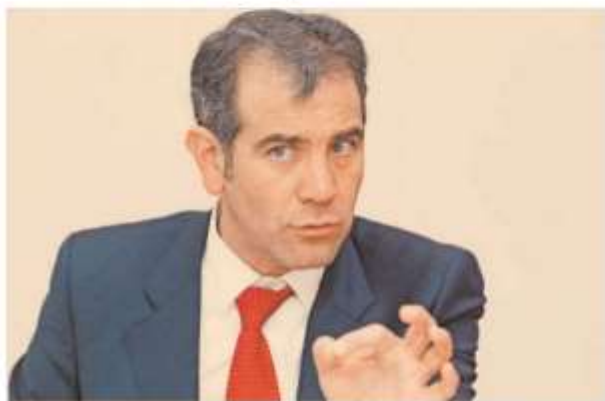
El funcionario concluye su periodo en el órgano electoral nacional en abril del 2023.

informó que sigue la investigación sobre el financiamiento para la contratación de anuncios espectaculares que impulsaban a participar en el ejercicio de democracia directa.