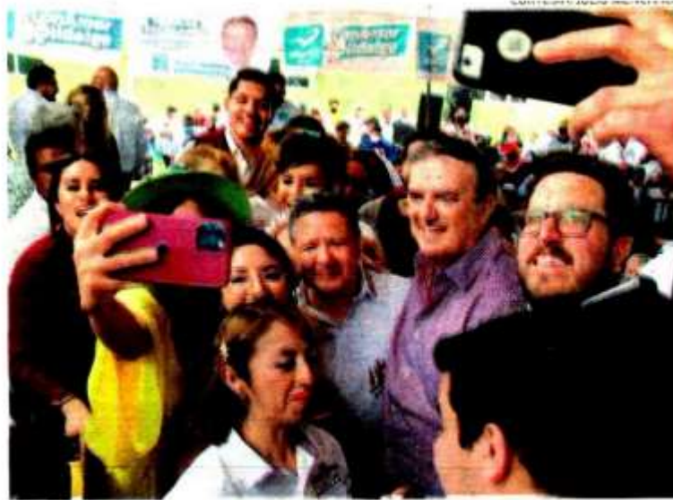
Al grito de ¡Marcelo presidente! fue aclamado por simpatizantes morenistas