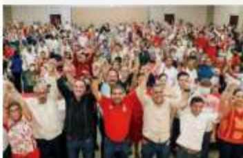
EL CANDIDATO del PRI-PRD (centro), en reunión con habitantes de Tuxtepec, ayer.

A un mes de que concluyan los actos proselitistas, la disputa por la gubernatura tiene una carrera parejera y, tanto Morena como la alianza opositora, anunciaron refuerzos. Con Julio Menchaca, ayer llegó una estructura de más de 20 legisladores para apoyar su campaña, con el acompañamiento especial del canciller Marcelo Ebrard, quien convocó a los asistentes al mitin en Acatlán para que, después de 92 años de gobiernos posrevolucionarios (léase, priistas), llegue la transformación a Hidalgo. La candidata de la alianza Va por Hidalgo, Carolina Viggiano, también tuvo el apoyo especial de Alejandro Moreno, dirigente del PRI, quien anunció que en el último mes de campaña los sectores priistas reforzarán las actividades proselitistas de la abanderada.