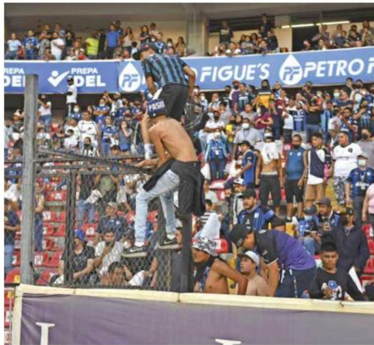
• SANCIÓN. El Estadio de La Corregidora recibió veto de un año por violencia.

• Además, la Liga MX trabaja en implementar el Fan ID.