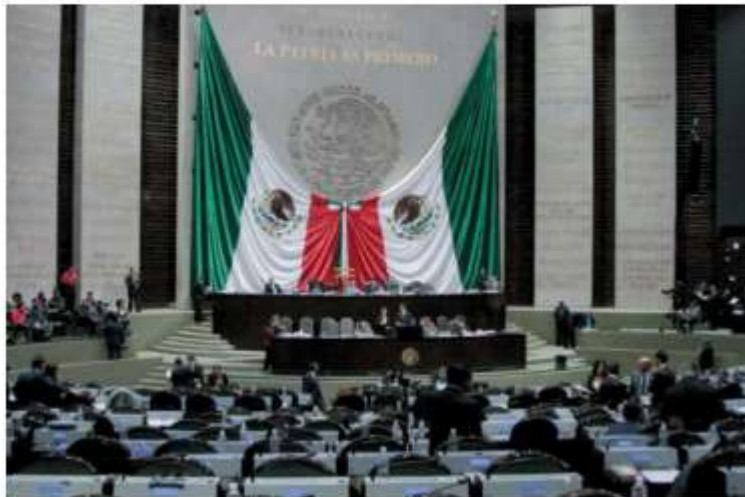
La CDMX y el Estado de México tendrán el mayor número de diputados.

Y en el punto 10 se especifica la limitación de los recursos a los partidos políticos solamente para gastos de campaña electoral, y suprimir el llamado financiamiento ordinario que se les entrega mensualmente cada año. ■