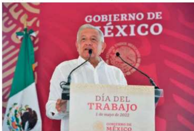
López Obrador comentó que el presupuesto será destinado a la sociedad. Especial

- Que los recursos que un partido obtenga para el sostenimiento de sus actividades ordinarias no podrán ser aplicados a las actividades tendientes a la obtención del voto para cargos de elección popular, ni al pago de deudas contraídas para cubrir gastos de campaña.●