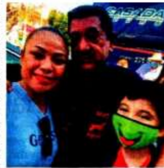
ACTO. Félix Salgado Macedonio, ayer, durante la caravana morenista.