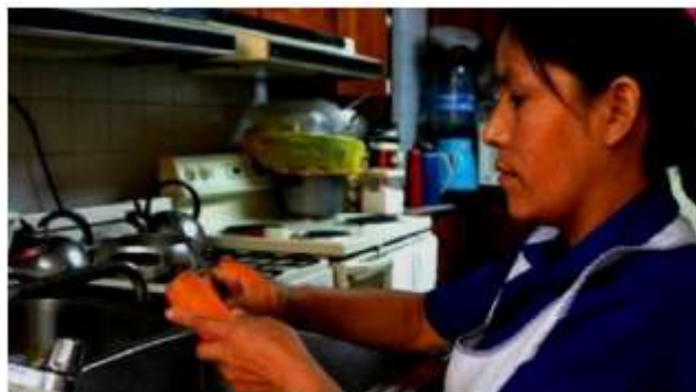
Casi nula incorporación al Seguro Social.

De hecho, algunas personas defensoras de este sector laboral consideran que la difusión de la segunda fase es incompleta y con vacíos de información.