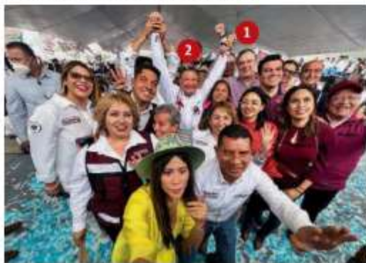
MARCELO EBRARD (1) en un acto proselitista del candidato Julio Menchaca (2) en el municipio de Acatlán, Hidalgo, ayer.