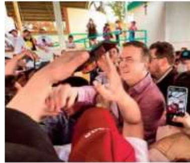
PRESENCIA. Ebrard acudió a un evento del aspirante a la gubernatura de Hidalgo.

Este domingo, López Obrador aseguró que no se reelegirá en la Presidencia, pues hay relevo generacional.