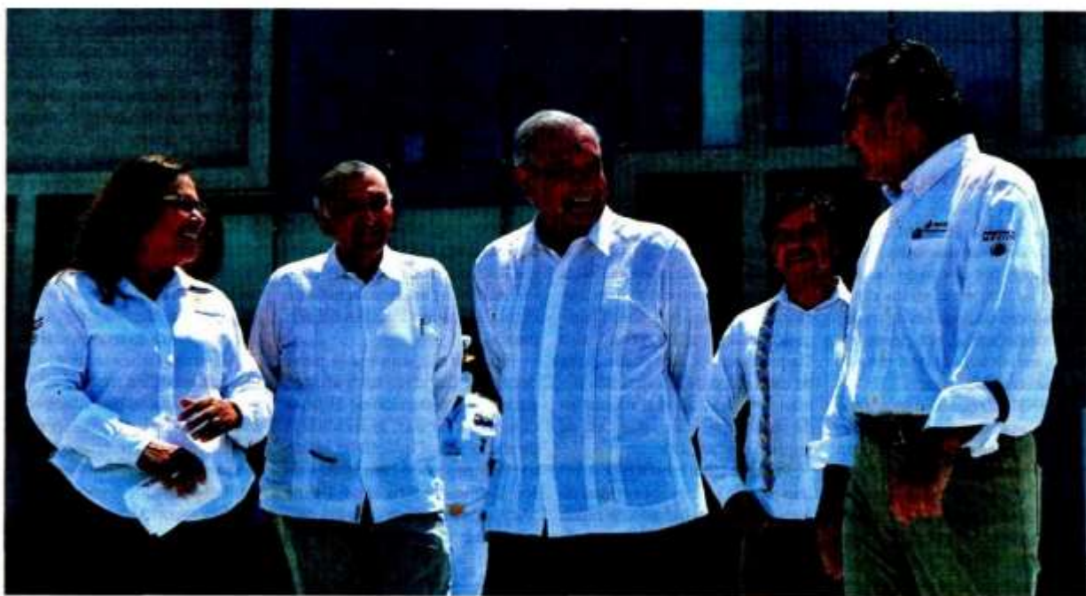
VISITA. Rocío Nahle [Sener], Adán Augusto López [Segob], el presidente López Obrador, Jesús Ramírez Cuevas y Octavio Romero [Pemex], ayer en Tabasco.