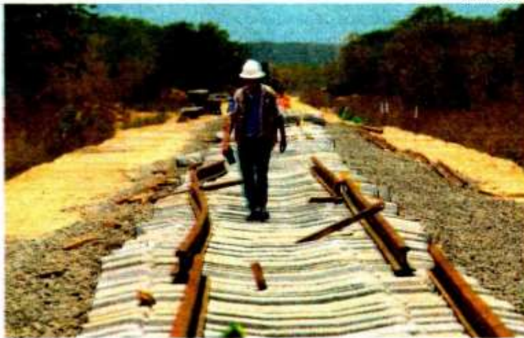
La obra abarca a cinco estados del sur-sureste de México