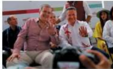
El candidato de Morena a gobernador agradeció la visita del canciller Especial

"Gracias amigo Marcelo Ebrard por sumarte al cambio que está ocurriendo en Hidalgo. Agradezco tu apoyo, tus palabras y el entusiasmo por acabar con la corrupción que tanto ha afectado esta tierra. Las y los hidalguenses sabemos que tenemos un aliado en ti". ●