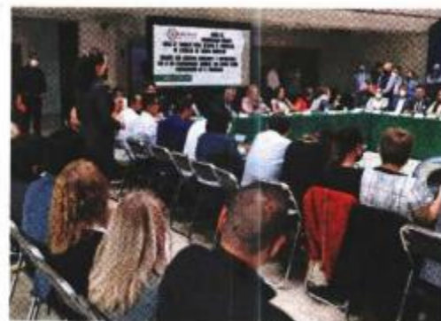
La mesa de trabajo en la Comisión de Educación, donde maestros pidieron restablecer el PETC.

"Que manejen el recurso los padres de familia para infraestructura y para alimentos, pero que los sueldos nos lleguen directamente de la Federación"