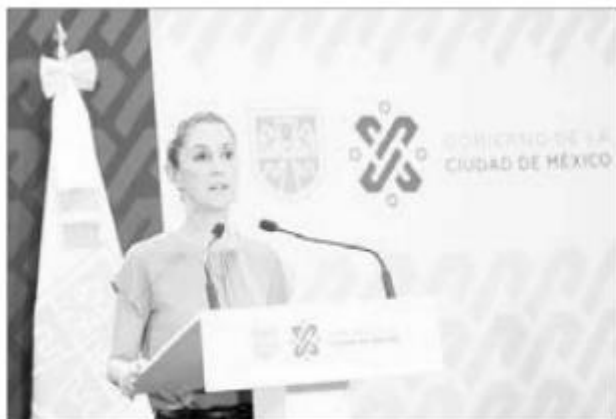
▲ La jefa de Gobierno, Claudia Sheinbaum, se comprometió a poner en operación la línea 12 del Metro con completa seguridad. En la imagen inferior, trabajos de reforzamiento de columnas.