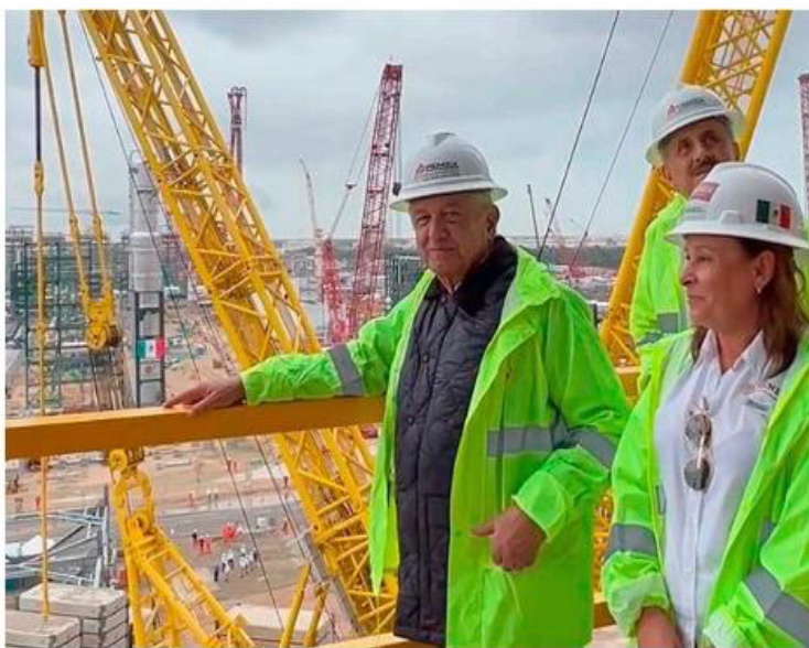
La Secretaria de Energía, a cargo de Rocio Nahle, gastó 271,304 millones de pesos más.

El presidente López Obrador anunció en días pasados que la Refinería de Dos