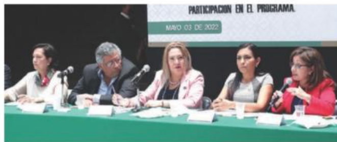
DIPUTADOS de diversos partidos durante el foro sobre ETC realizado ayer.

DOCENTES Y DIRECTORES argumentan que benefician a grupos vulnerables, principalmente; tras la pandemia, la importancia de este programa educativo aumenta, aseguran