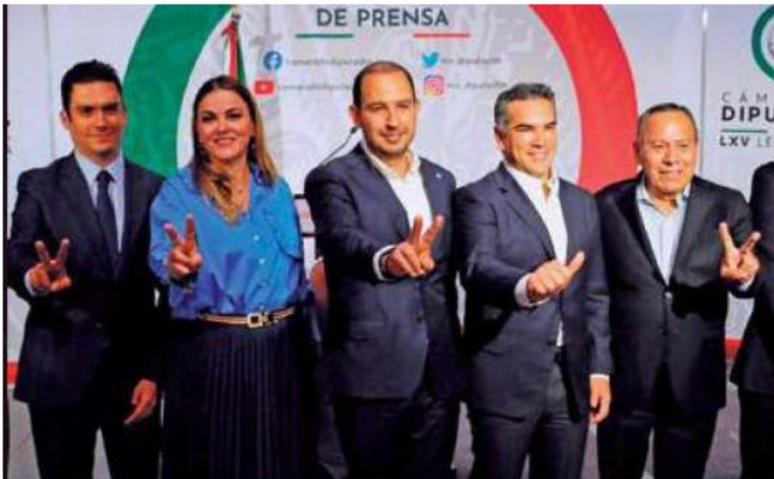
Los integrantes de la coalición Va por México aseguran que defenderán al INE y no permitirán retrocesos democráticos.

La oposición, como lo vimos en la reforma eléctrica, va ganando una base firme del electorado que la apoya al ver su estrategia de detenerle todas las propuestas que sean posibles al Presidente