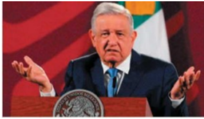
Dijo que el objetivo es garantizar la democracia en México.

En este sentido se refirió a los legisladores de la alianza Va por México, de quién es dijo “son muy chuecos” y “muy mentirosos”. •