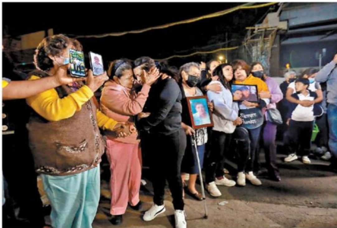
Misa con las familias afectadas en la zona del derrumbe ocurrido en mayo de 2021. ARIE LOJEDA

“Si las empresas hubieran querido irse a un tema jurídico de amparos, etcétera, no estaría-