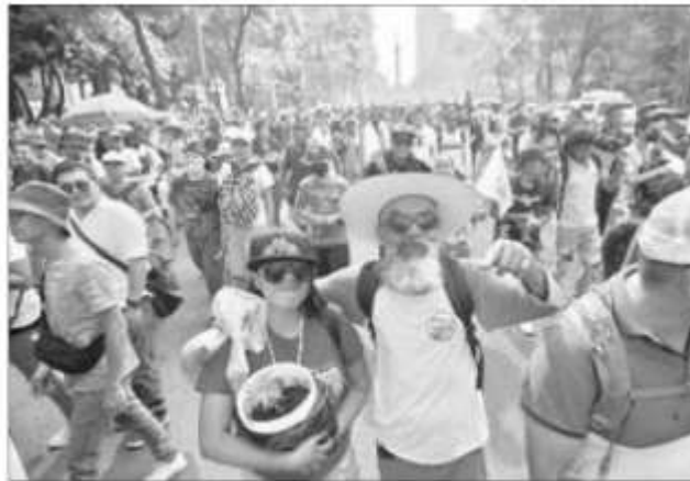
△ El pasado 7 de mayo cientos marcharon en la CDMX con el fin de exigir ya una legislación.