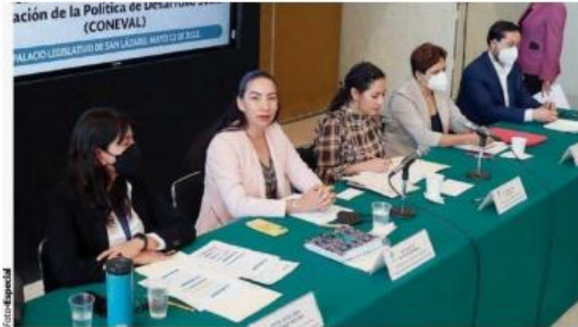
INTEGRANTES del Coneval, durante la mesa de trabajo con diputados, ayer.