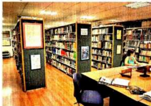
Los editores no están obligados a entregar ejemplares como Depósito Legal antes de que sean distribuidos, dijo la Corte.

En 2021, sólo 4 de los 17 jueces federales en materia administrativa en la CDMX concedieron suspensiones para no entregar materiales al Depósito Legal, mismas que irán quedando sin efectos, conforme se dicten las sentencias de fondo negando el amparo contra la ley.