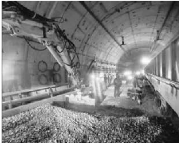
▲ Trabajos de mejoramiento de las curvas en el tramo subterráneo de la línea 12 del Metro. Aquí, en la estación Zapata.

Alejandro Cruz Flores, Víctor Ballinas y Andrea Becerril