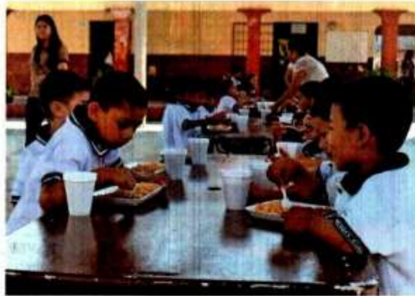
El PETC priorizó a primarias y telesecundarias en situaciones de vulnerabilidad o de deserción escolar.