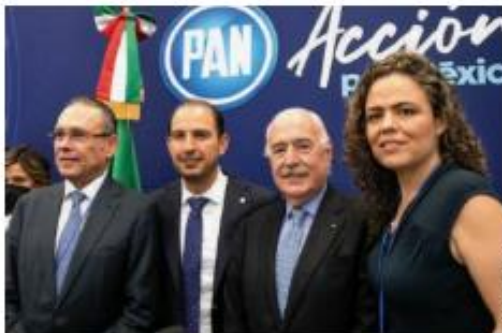
EL EXPRESIDENTE colombiano (segundo de der. a izq.), flanqueado por Marko Cortés y Mariana Gómez del Campo, ayer.

Andrés Pastrana Expresidente de Colombia