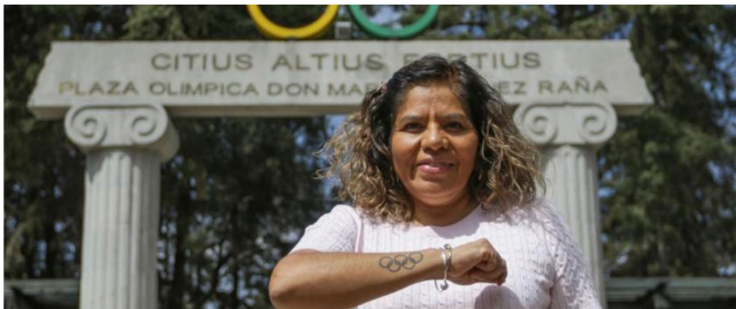
Ayudar a que los atletas mexicanos cumplan con su sueño olímpico.