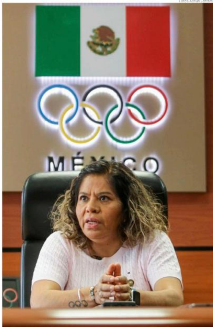
Es muy importante que los atletas sepan cómo, cuándo y dónde van a hacer sus clasificatorios.

Todos los contratos anteriores de patrocinio se terminaron con Tokio 2020, otros se cancelaron por la pandemia; nosotros estamos trabajando para tener más de cinco o seis patrocinadores fuertes, nuestra meta es llegar a diez de ser posible. Y también es importante tener apoyo para nosotros a