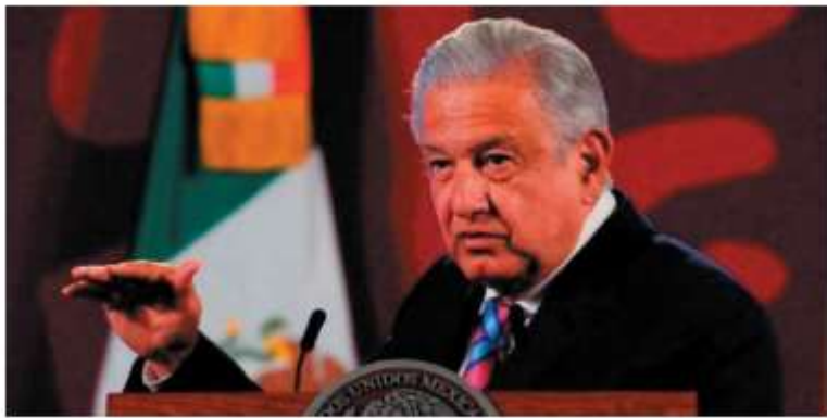
La consultora reprueba la elección de magistrados y consejeros.