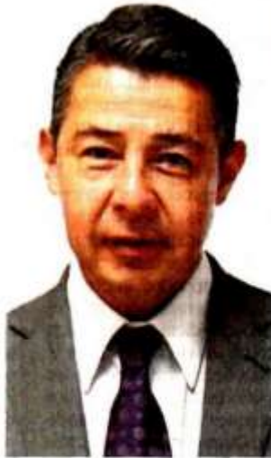
FOTOGRAFÍA ESPECIAL DE