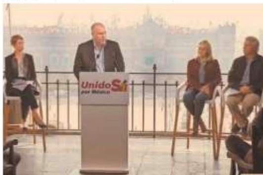
La organización civil presentó sus objetivos con miras en la elección presidencial del 2024, entre los que se incluye tener presencia en los 32 estados.

“Es muy pequeño, además tiene problemas internos y su llegada a la presidencia del partido no está muy clara”.