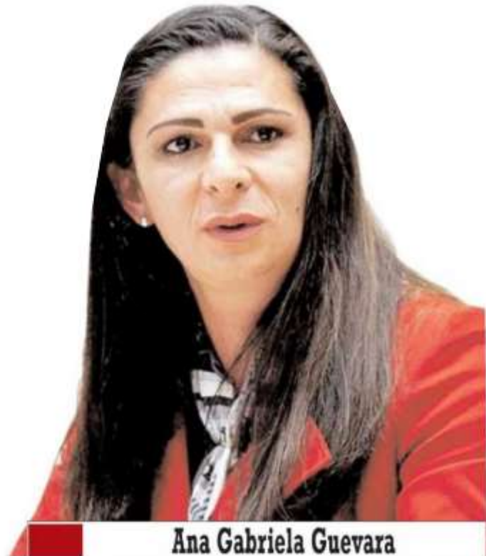
Ana Gabriela Guevara

hay denuncias por malos manejos y hasta por intento de homicidio, adjudicaciones directas en la contratación de bienes y servicios sin justificar la excepción al procedimiento de licitación pública.