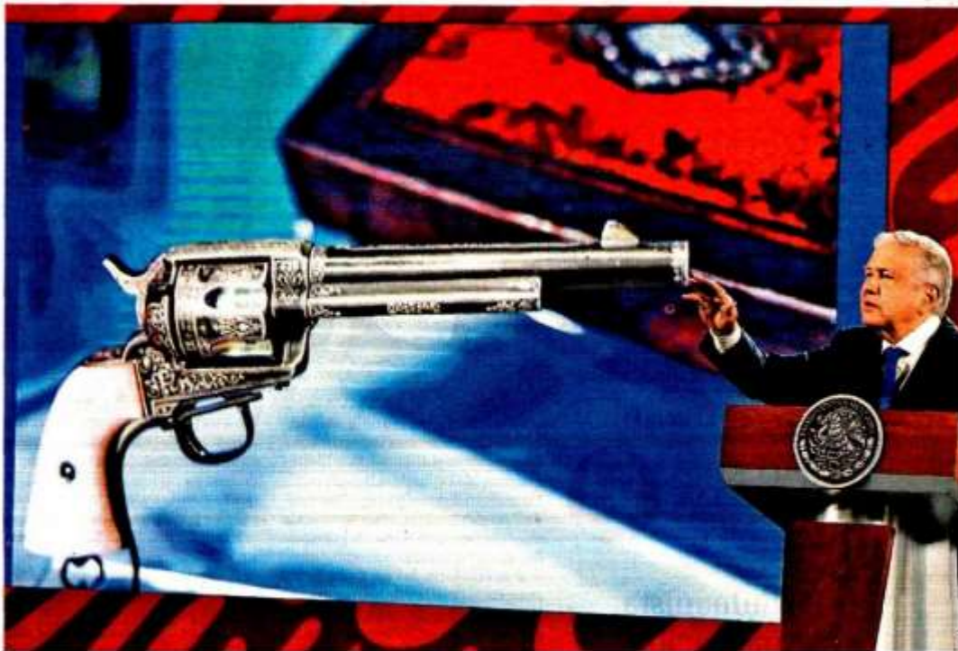
El jefe del Ejecutivo detalló que su administración “trabaja como nunca” para dar con los desaparecidos.

Monreal entre los aspirantes a la Presidencia, el senador de Morena dijo que es el más preparado, pues cuenta con 25 años de experiencia, por lo que nadie tiene derecho a excluirlo. PÁGS. 6 Y 7