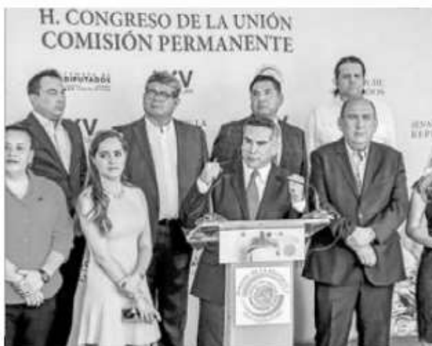
▲ Acompañado por diputados y senadores de su partido, el dirigente nacional del PRI, Alejandro Moreno, anunció que interpondrá queja contra funcionarios por injerencia electoral. Nada dijo de las nuevas grabaciones que lo involucran.