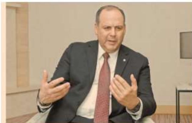
En entrevista el líder empresarial afirmó que buscarán sumar a Va por México a Movimiento Ciudadano hacia 2024.

Me atrevo a garantizar, y vaya que conozco a ese sector, que no hay ningún empresario en sus cinco cabales, que no tenga un conflicto de interés, que considere exitosa y mucho menos que respalde la gestión de AMLO".