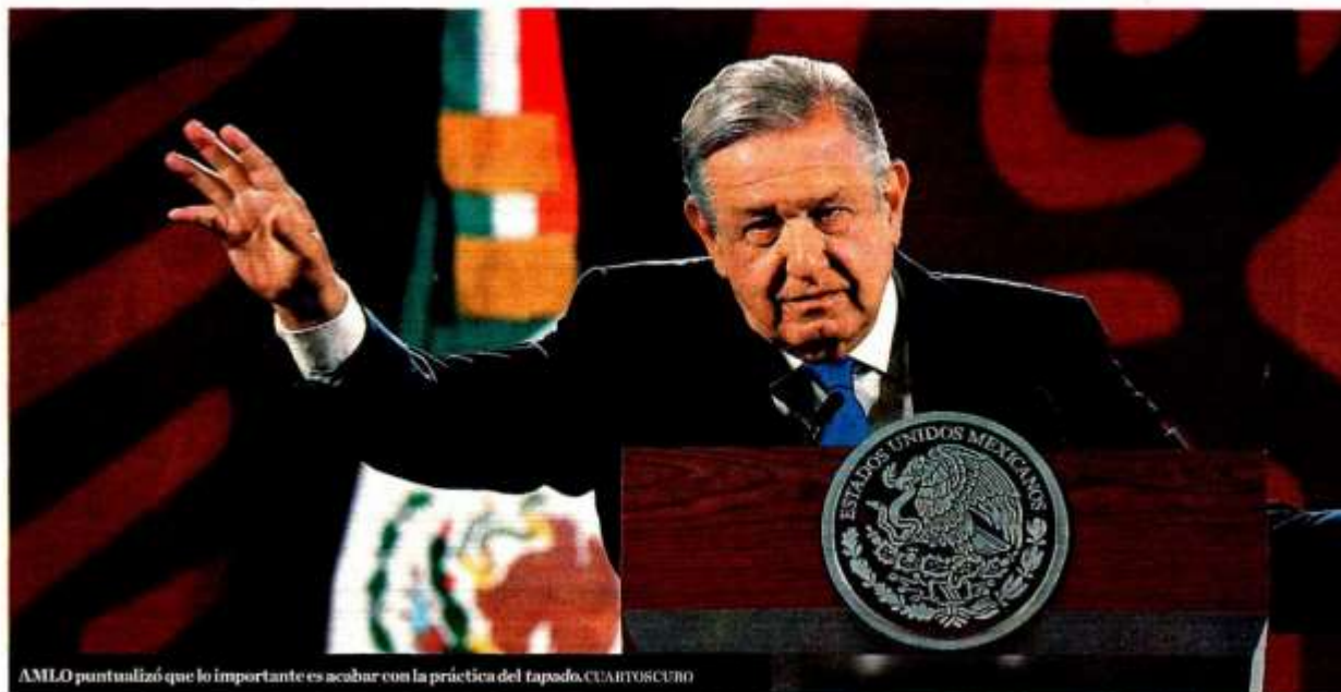
AMLO puntualizó que lo importante es acabar con la práctica del tapado.