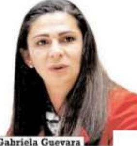
Ana Gabriela Guevara

ASF alerta que Conade paga sueldos de 10 a 30 mil pesos a más de 100 atletas que no existen