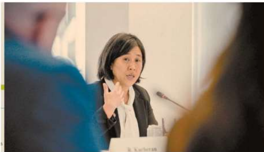
Katherine Tai, titular de la Representación Comercial de la Casa Blanca.

licitud de EU y llevará a cabo las consultas respectivas con la Secretaría de Trabajo y Previsión Social.