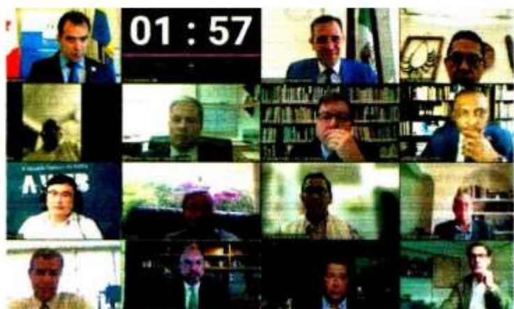
REUNIÓN VIRTUAL del INE, en la que anunció la Cumbre de la Democracia, ayer.

EL COORDINADOR de Morena en el Senado, Ricardo Monreal, rechazó el pasado 10 de mayo, que la iniciativa presidencial de Reforma Electoral plantee la desaparición del INE.