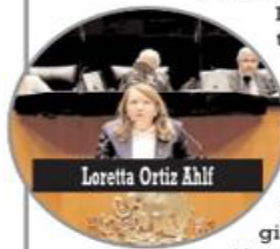
Loretta Ortiz Ahlf

Con un total de 6 votos a favor de la validez y 5 en contra del total de 11 ministros se validó la figura de superdelegados, siendo el voto de la ministra Loretta Ortiz que definió el desempate.