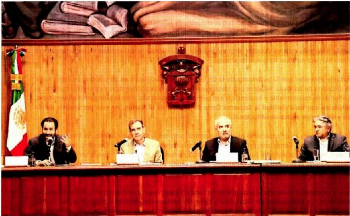
El consejero presidente del INE, Lorenzo Córdova (segundo de izq. a der.), entre otros, durante un panel sobre elecciones libres, en Guadalajara.

"Cuando se divide al país entre buenos y malos, esta lógica de polarización, hablar de una reforma [electoral] es la peor idea"