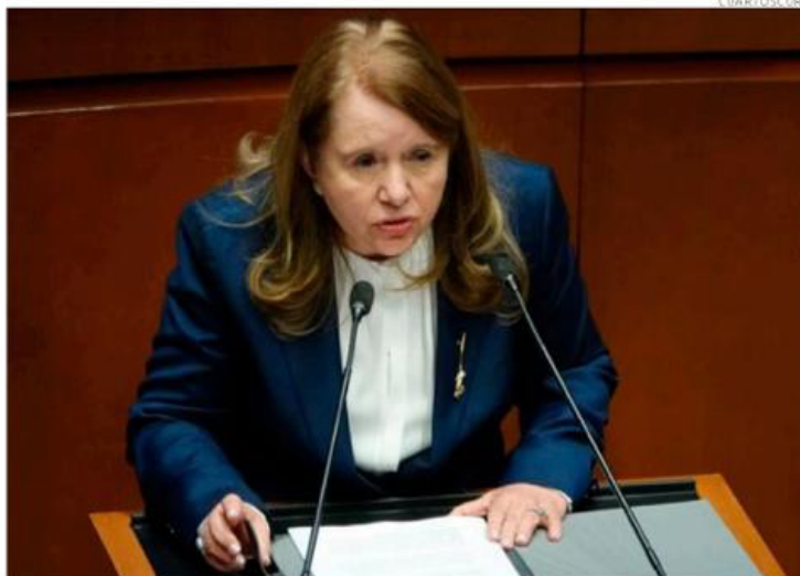
Luego del empate de hace una semana, la ministra Loretta Ortiz le puso ayer punto final.

Por 6 votos a favor y 5 en contra, los ministros de la SCJN desecharon la acción de inconstitucionalidad 115/2018 presentada por senadores y diputados de oposición en contra de las reformas a la Ley Orgánica de la Administración Pública Federal cuyo decreto se publicó el 30 de noviembre