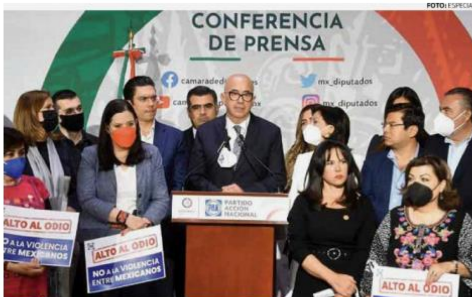
• TRANSPARENCIA. Los legisladores del PAN exigen informes sobre la vigencia de los contratos.