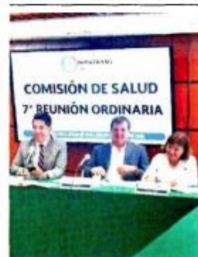
Reforma de dignidad póstuma se avaló con 22 votos a favor.

"Esta reforma señala que los cadáveres de las personas no son objetos o cosas de las cuales se puede disponer sin la menor consideración"