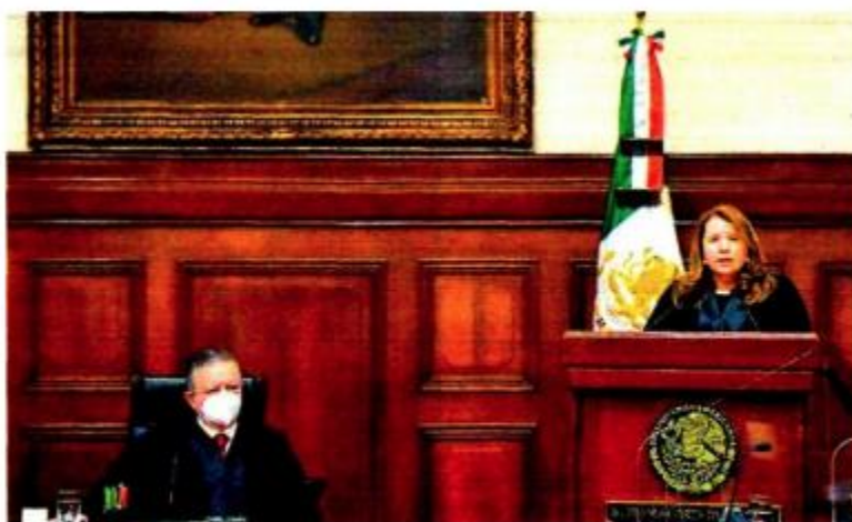
Se logró el desempate de la pasada sesión