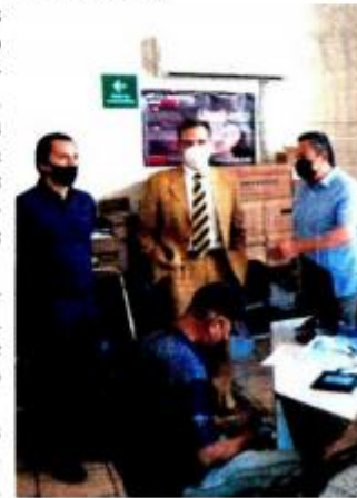
VISITA. Lorenzo Córdova, ayer, en la Junta Distrital 07 del INE, en Coahuila.