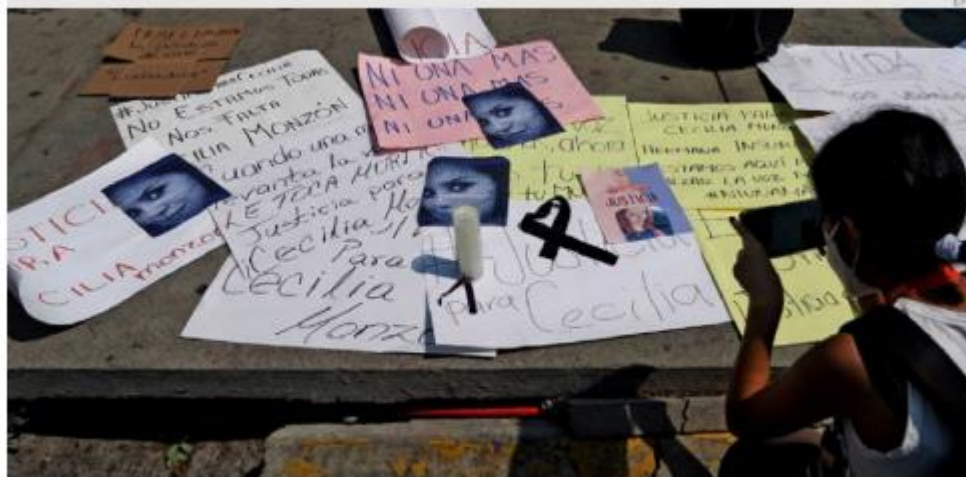
Las mujeres en Puebla y el país se sienten lastimadas por el asesinato de Cecilia Monzón.