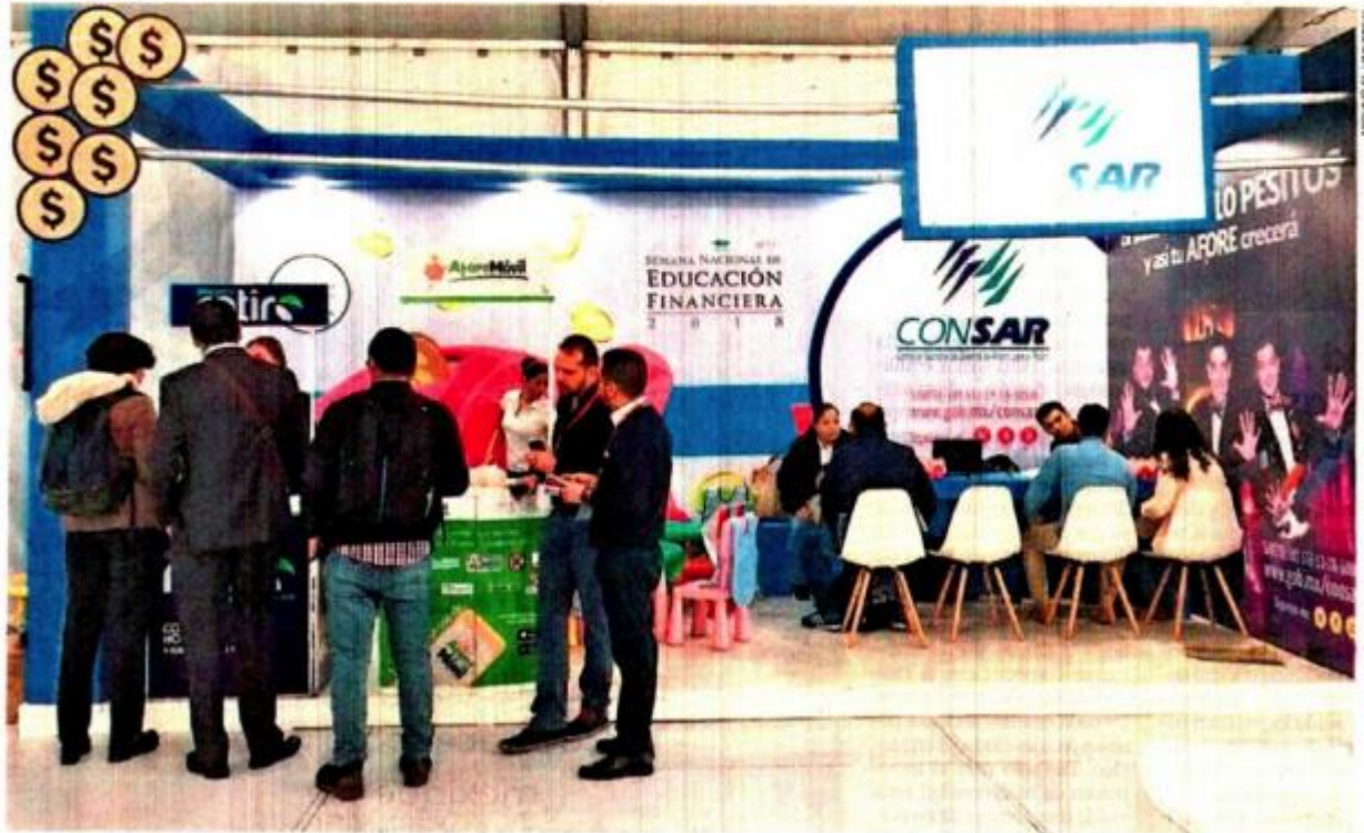
La Consar informa que en el país hay 70.8 millones de cuentas, de las cuales 52.5 millones son registradas, 9.5 millones son asignadas y 8.8 millones corresponden a recursos depositados en el Banco de México.