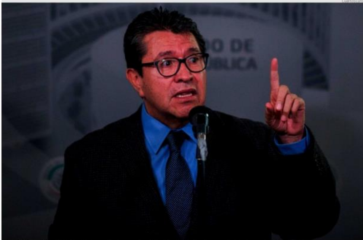
Ricardo Monreal le advirtió a la directora de Conacyt que el Poder Legislativo "no permitirá un desacato de su parte".

recibimos de Conacyt la notificación de que no asistiría por 'asuntos impostergables' en su agenda"