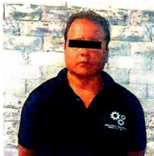
Le hallaron mota dentro de auto que usó en asalto contra la diputada panista, dijeron

Ahora, el delincuente se encuentra a disposición del Ministerio Público de la Agencia Central de Investigación de la Ciudad de México, donde se definirá su situación legal.