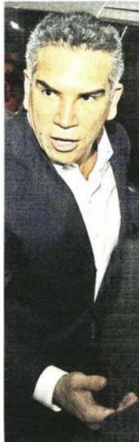
Moreno acusó al Gobierno de querer dividir a la Oposición.