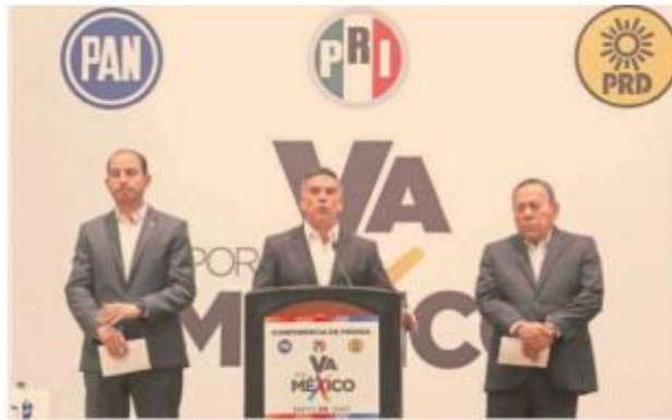
Especialistas concordaron en que la reputación de la alianza es primordial ante la ciudadanía.