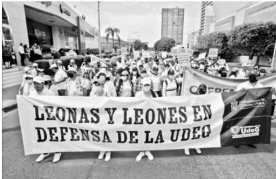
▲ Estudiantes, docentes y ciudadanos protestaron ayer en demanda de respeto a la Universidad de Guadalajara, luego de las confrontaciones con el gobernador Enrique Alfaro, de Movimiento Ciudadano.