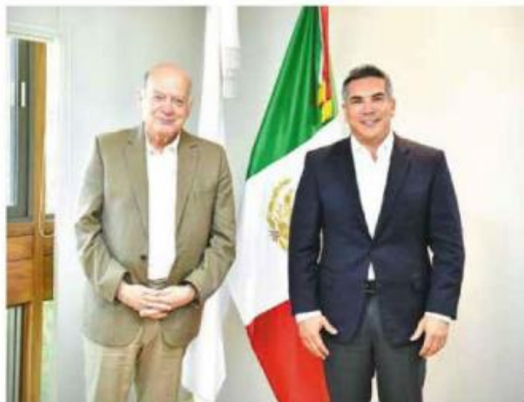
REUNIÓN. Alejandro Moreno y José Miguel Insulza, extitular de la OEA, ayer.

Por ello, reiteró que se mantendrá como presidente del tricolor, "con el apoyo de miles de militantes" y que, junto con el resto de los partidos de oposición, buscará impedir que el gobierno de Morena convierta a México "en una dictadura".