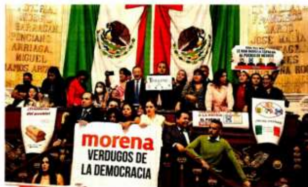
Legisladores de Morena y de la oposición intermediosarios acataciones en tribuna por el dictamen para reformar el IECM.

Una reforma no diezma al IECM, pues no se trastocan sus actividades para organizar elecciones, dijo Gustavo López.