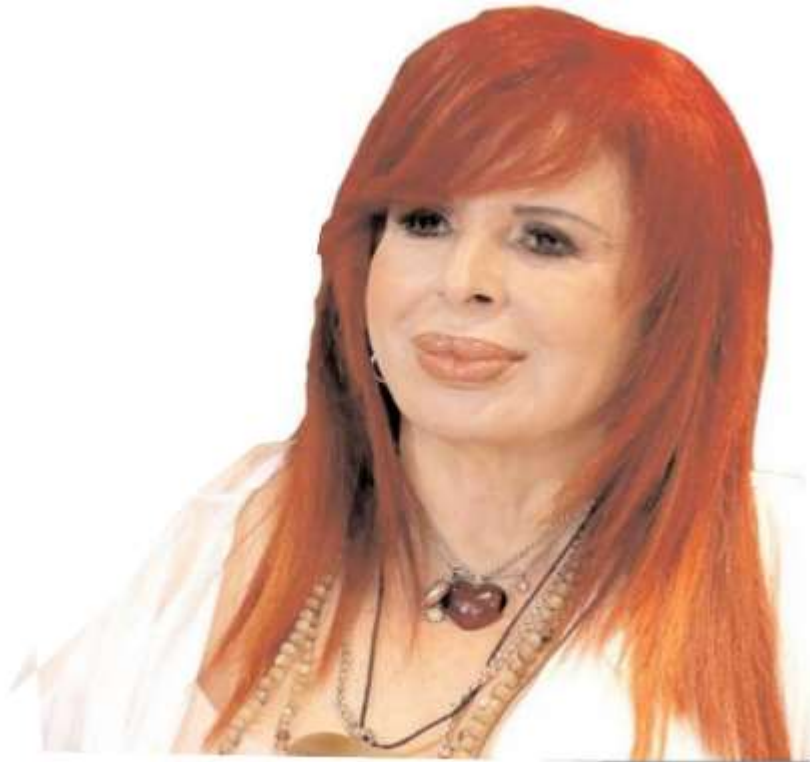
Layda Sansores, gobernadora de Campeche