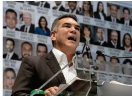
EL LÍDER nacional del PRI, Alejandro Moreno, en imagen de archivo.

EN AUDIOS FILTRADOS , se escucha que supuestamente el líder nacional del PRI aceptó 25 mdp; "la misma vara, sea quien sea" para quienes infrinjan normas electorales: Ciro Murayama