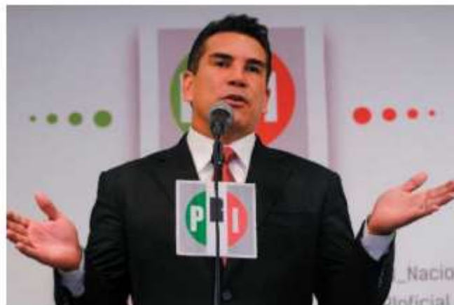
ARTICLE 19 dijo que el funcionario ya había agredido antes a la prensa.

Finalmente, el polémico audio también cimbró ya la alianza 'Va por México', pues durante su conferencia de prensa, el coordinador de los senadores del PAN, Julián Rementería del Puerto, declaró que no podía compartir expresiones contra los periodistas sin importar de quién vengan. Aunque expresó que no quería entrar en el debate de si son verdaderas o falsas como afirma el presidente nacional del PRI, dijo que esas palabras son totalmente reprobables y no pueden ser validadas. ●