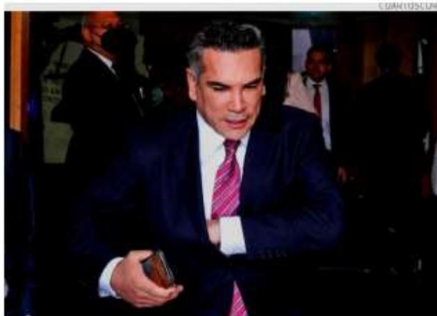
Los polémicos audios de Alejandro Moreno serán investigados.