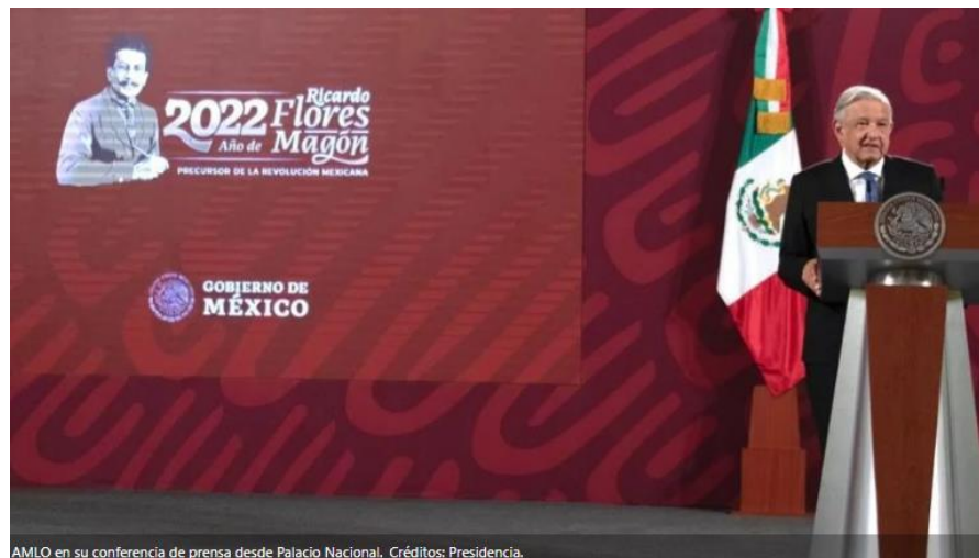
AMLO en su conferencia de prensa desde Palacio Nacional.

Tras la 'bomba' que lanzó Alejandro 'Alito' Moreno, dirigente del PRI, en torno a haber recibido una supuesta amenaza de la Cuarta Transformación (4T), el presidente Andrés Manuel López Obrador (AMLO) respondió que no se involucra en esos temas y evadió hablar al respecto.