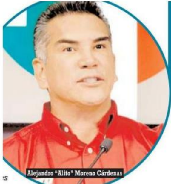
Alejandro "Alito" Moreno Cárdenas