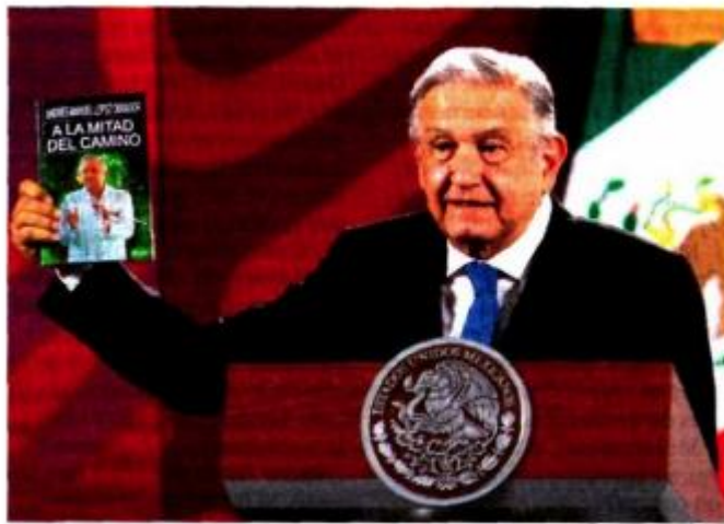
POSTURA. El presidente López Obrador, ayer, en su conferencia matutina.