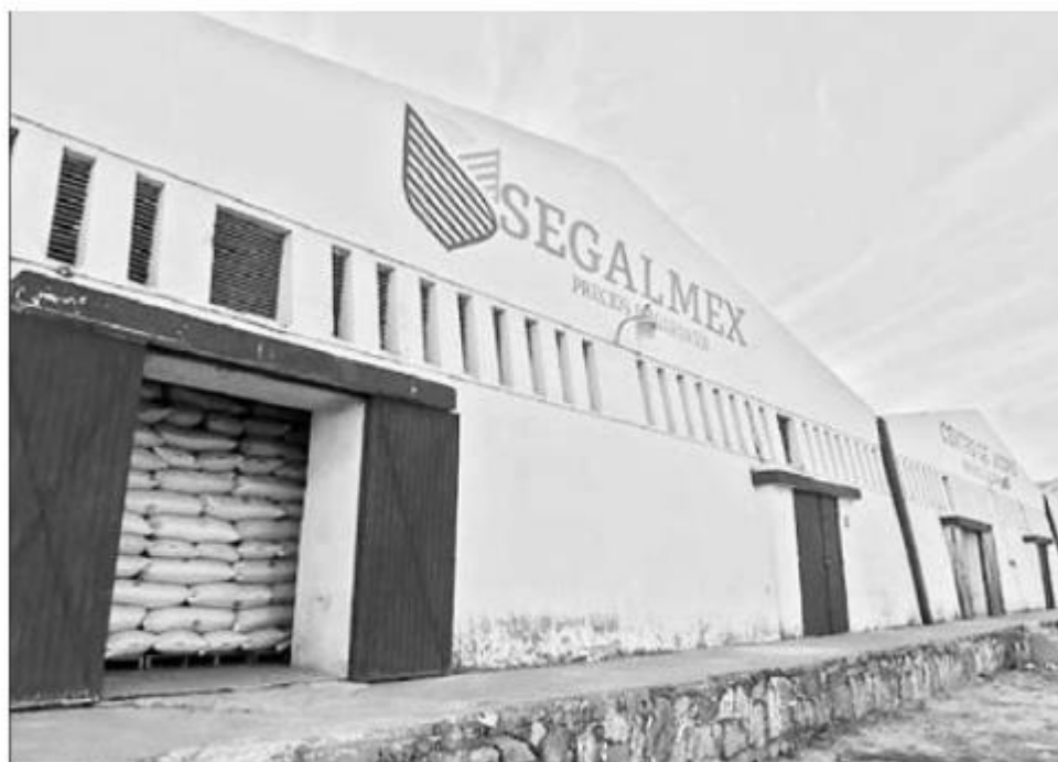
▲ El desfalco en Segalmex, dependiente de la Sader, podría ser hasta de 10 mil millones de pesos.