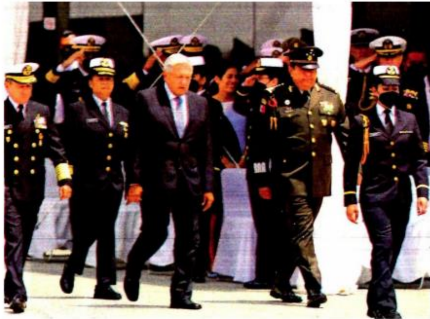
El mal clima impidió la celebración en Veracruz

Estamos en vísperas de las elecciones, pero yo no me meto en eso, se limitó a señalar el presidente