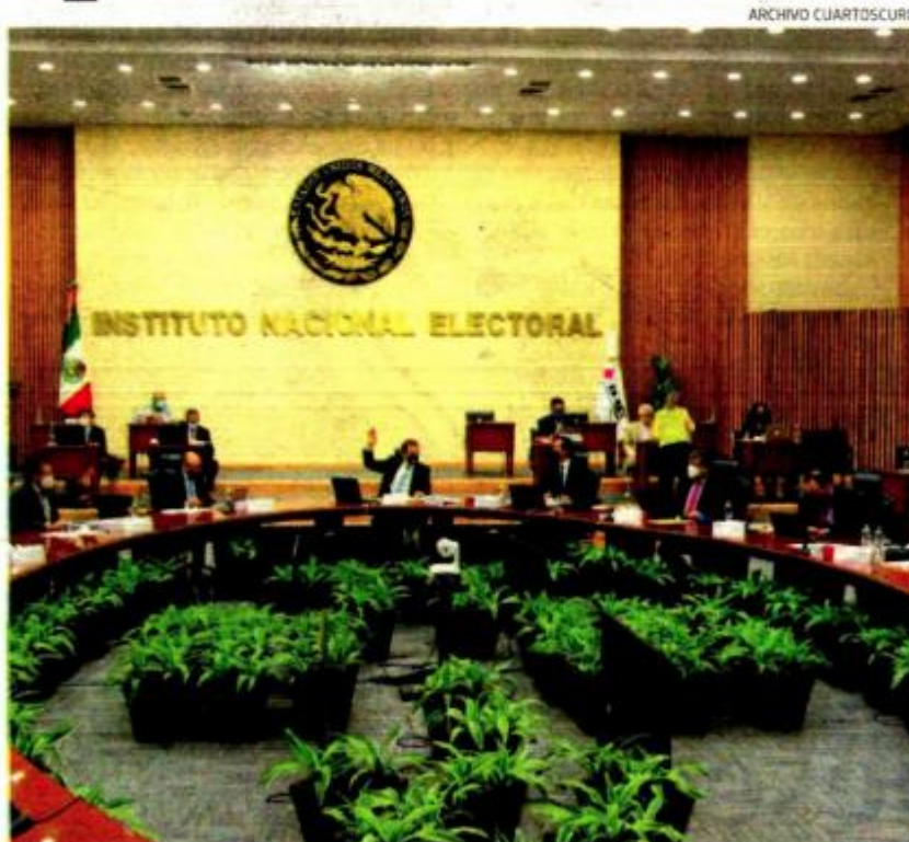
Sesión del pasado martes del Consejo General del INE, encabezado por Lorenzo Córdova

Este asunto emana de la controversia constitucional 209/2021 que fue promovida por el INE en contra de los diputados