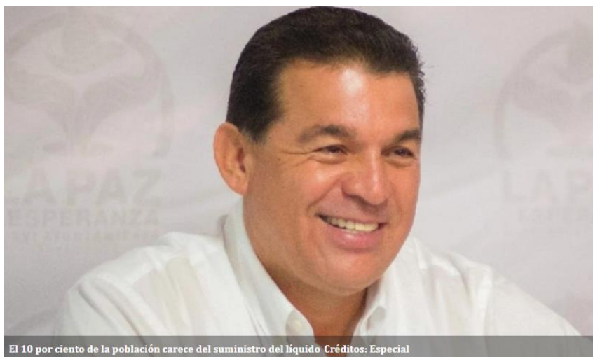
El 10 por ciento de la población carece del suministro del líquido