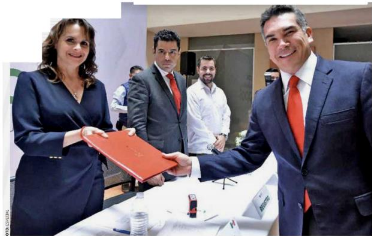
ALISTA PLAN B | • El dirigente nacional del PRI se postuló para presidir la Conferencia Permanente de Partidos Políticos de América Latina.