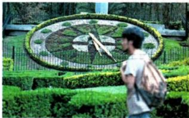
Daños a la salud y mínimo ahorro de energía son algunos de los argumentos con los que se ha buscado eliminar el horario de verano.

Asimismo, hay cuando menos cuatro exhortos en los últimos cinco años de congresos locales, como el de Chihuahua v Guerrero, donde se pide al Senado de la República abrogar el horario de verano en el país. ●