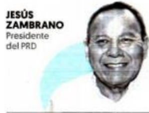
JESÚS ZAMBRANO Presidente del PRD

"...no dividirán a la oposición y llegaremos juntos al 2024 en Va por México..."