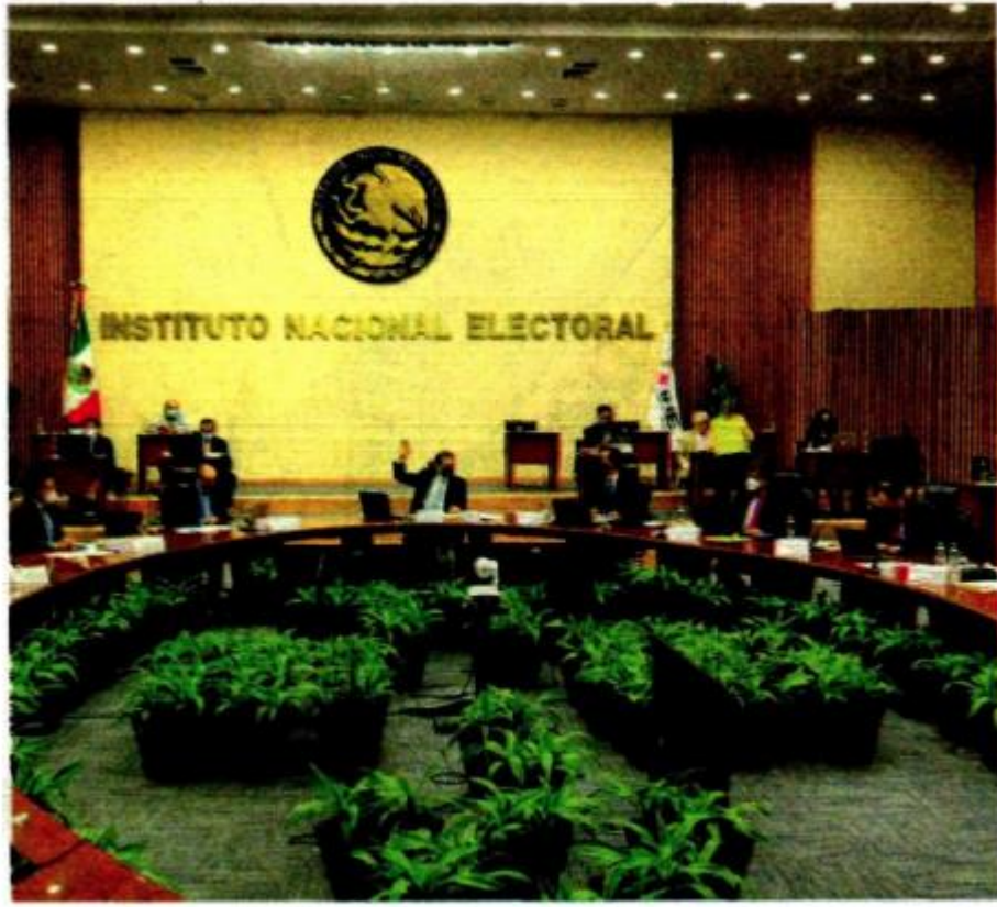
Sesión del pasado martes del Consejo General del INE, encabezado por Lorenzo Córdova