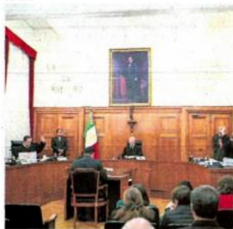
La decisión por unanimidad de la Primera Sala de la SCJN sienta un precedente en el país, señalan.

dió la SCJN a la Cámara Baja para analizar lo que corresponda.