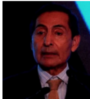
Ramírez de la O, titular de SHCP.

Sin embargo asegura que en lo que resta de este año y a lo largo de 2023 la inflación descenderá, ubicándose en niveles cercanos al objetivo de inflación de 3 por ciento del Banco de México en el primer trimestre de 2024. (Alejandro Páez Morales) •