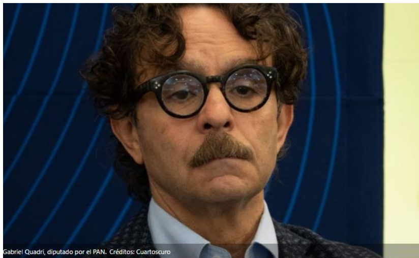
Gabriel Quadri, diputado por el PAN.

MÉXICO (ANGÉLICA MELÍN).- El diputado federal del Partido Acción Nacional (PAN) Gabriel Quadri salió en defensa de sus derechos a la libertad de expresión y a la inmunidad parlamentaria.