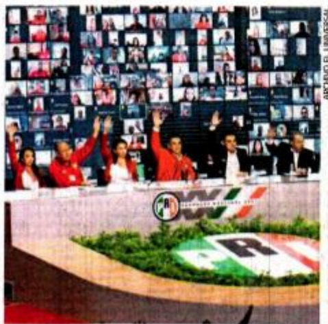
Grupo de priistas pide convocar a una asamblea nacional extraordinaria para realizar un análisis.

Sugieren revisar la integración de los Consejos Político Nacional y Estatales para elegir de forma incluyente los órganos de gobierno del PRI, y que se convoque a una asamblea nacional extraordinaria para actualizar estructuras, renovar estrategias y elaborar un proyecto alternativo de nación que sea referente para todos los puestos de representación nacional del tricolor y que constituya la alianza electoral Va por México en una auténtica propuesta de gobierno de coalición. ●