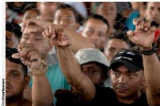
TRAS UNA ASAMBLEA, integrantes de la caravana decidieron mantener su avance, ayer en Huixtla, Chiapas.

52.1 Por ciento incrementó la repatriación de mexicanos durante los primeros 4 meses de 2022