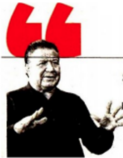
JULIO MENCHACA VIRTUAL GOBERNADOR DE HIDALGO

presupuestadores que tiene una muy buena relación con Ricardo Monreal, con Claudia Sheinbaum, con Marcelo Ebrard, con Adán Augusto López. Vinieron a mi campaña los cuatro”.