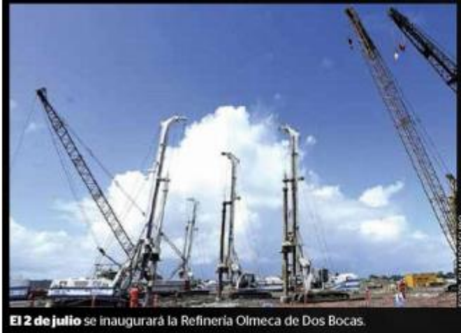
El 2 de julio se inaugurará la Refinería Olmeca de Dos Bocas.