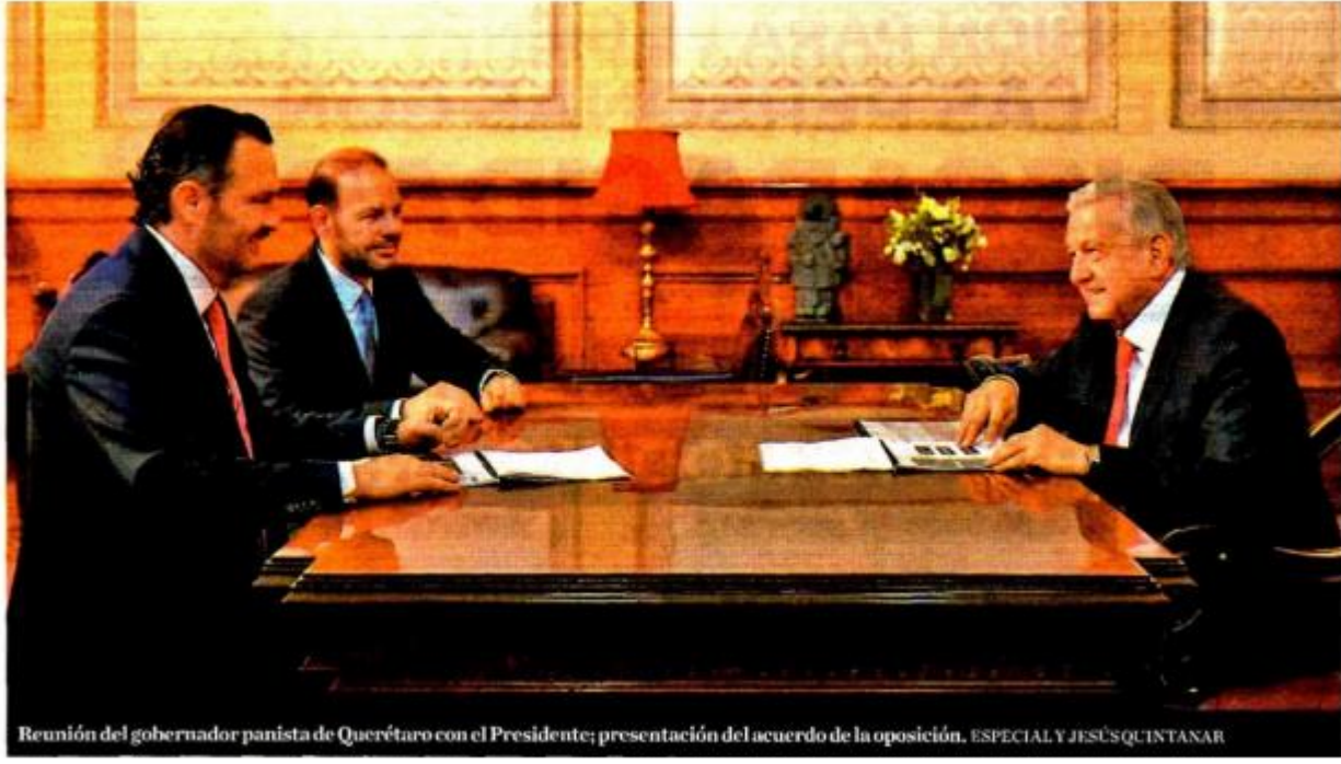
Reunión del gobernador panista de Querétaro con el Presidente; presentación del acuerdo de la oposición.

Con información de: L. Padilla y S. Arellano