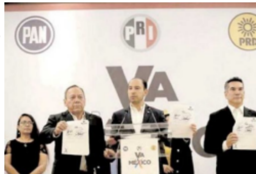
Jesús Zambrano, Marko Cortés y Alejandro Moreno

De esa forma, planteó una moratoria legislativa, esto es, que los legisladores de la oposición no aprobarán en lo que resta de esta legislatura ninguna reforma a la Carta Magna, incluidas la electoral y la de la Guardia Nacional.