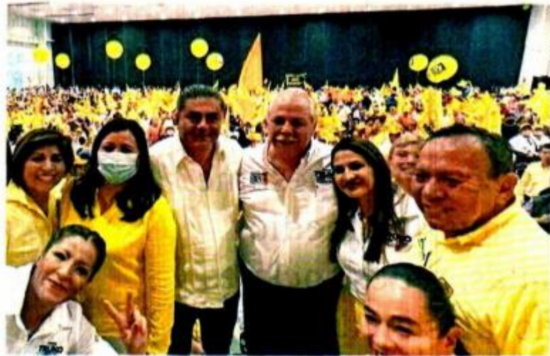
En algunos estados donde se contendió, el PRD ya no tiene la representación para mantener el registro, como en Tamaulipas donde logró sólo 1.4% de la votación.