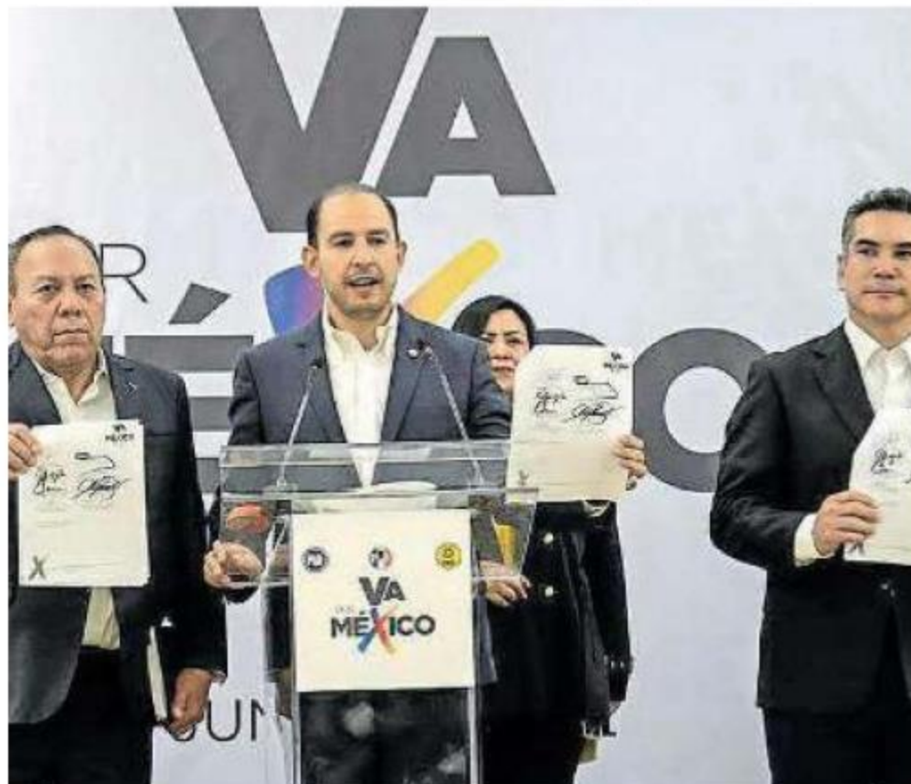
Perfilan continuar alianza en 2023

Aseguran que en 2023 ganarán el Estado de México, Coahuila y en 2024 la presidencia, pues la coalición es firme y van con todo