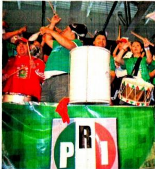
El derrumbe del PRI inició en 2018, cuando perdió la Presidencia, Yucatán y Jalisco, pero la peor participación fue en 2021.