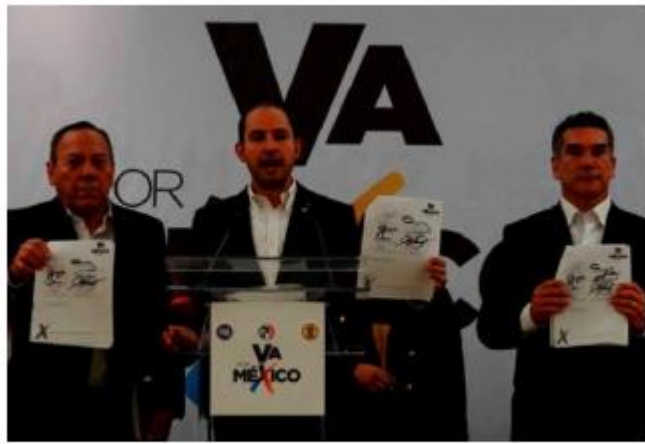
Jesús Zambrano, Marko Cortés y Alejandro Moreno, dirigentes del PRD, PAN y PRI, encabezaron la conferencia de la coalición Va Por México.