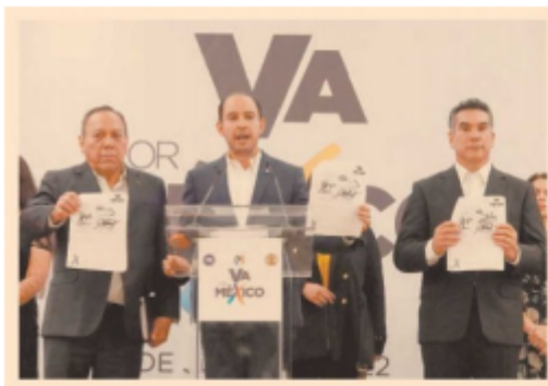
La oposición integrada por PAN, PRI y PRD presentó una "moratoria constitucional".