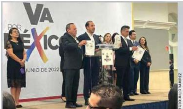
Los dirigentes de los partidos que integran Va Por México muestran el documento que avala la 'congeladora' de reformas constitucionales.