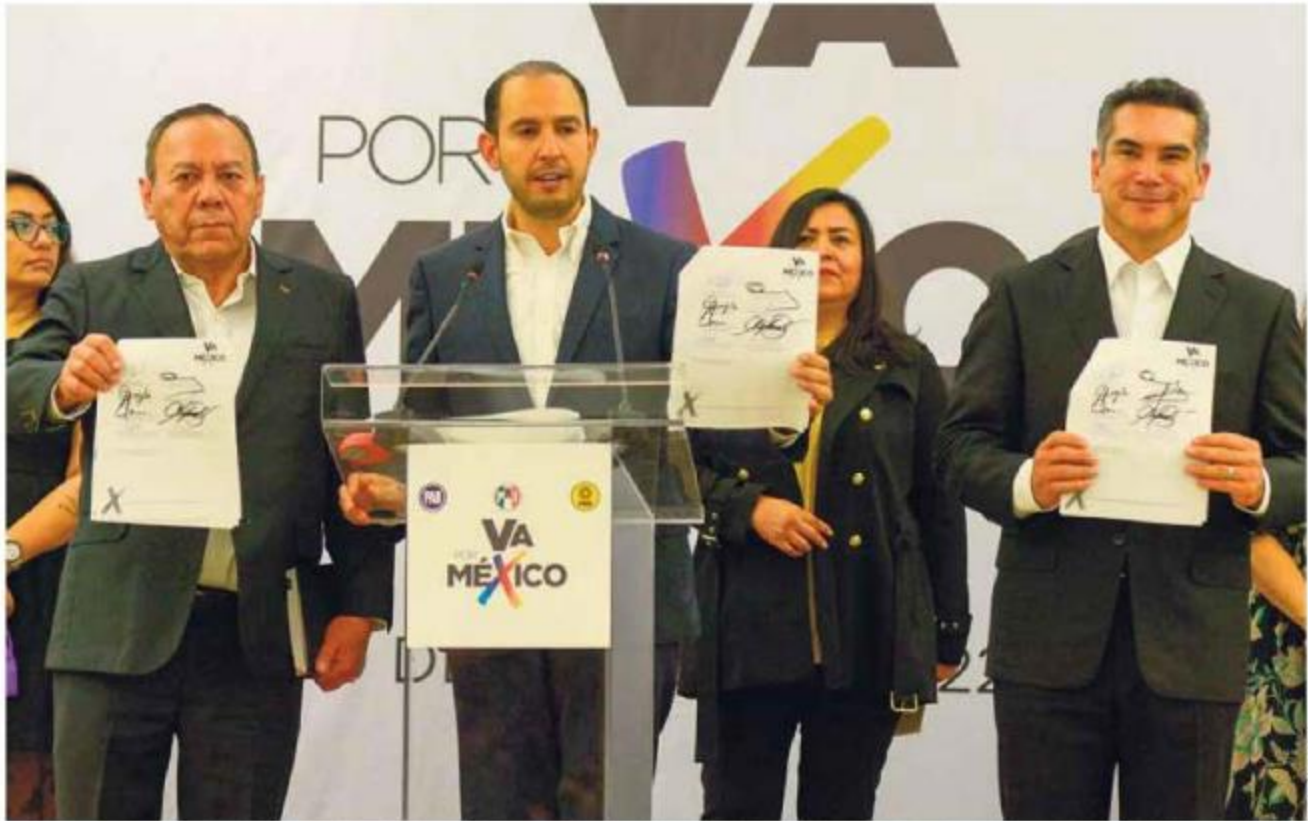
JUNTOS. Jesús Zambrano, Marko Cortés y Alejandro Moreno, líderes de PRD, PAN y PRI, ayer, al definir el rumbo de su alianza de cara a las elecciones de 2023 y 2024.