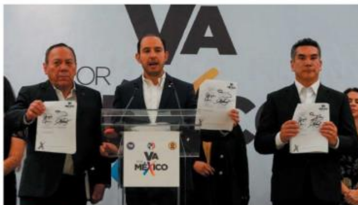
En conferencia, los líderes indicaron que la alianza permanecerá unida.

Cada uno de los partidos analizará su papel dentro de la alianza y con miras a las próximas elecciones en Coahuila y Estado de México. ●