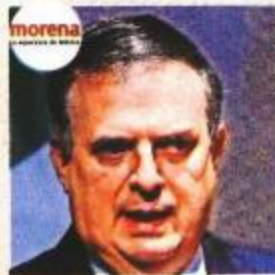
Marcelo Ebrard Casaubon.