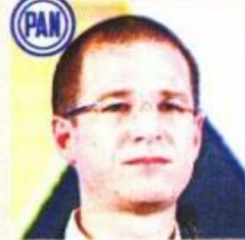
Ricardo Anaya Cortés.