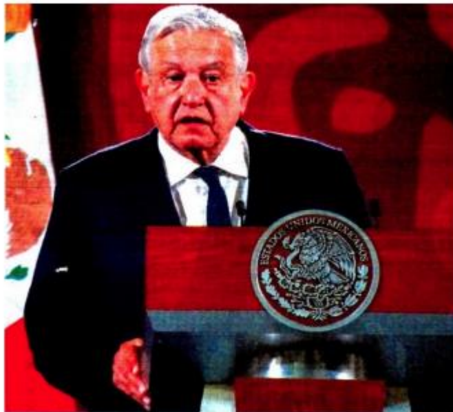
MENSAJE. El presidente Andrés Manuel López Obrador, ayer, en conferencia.