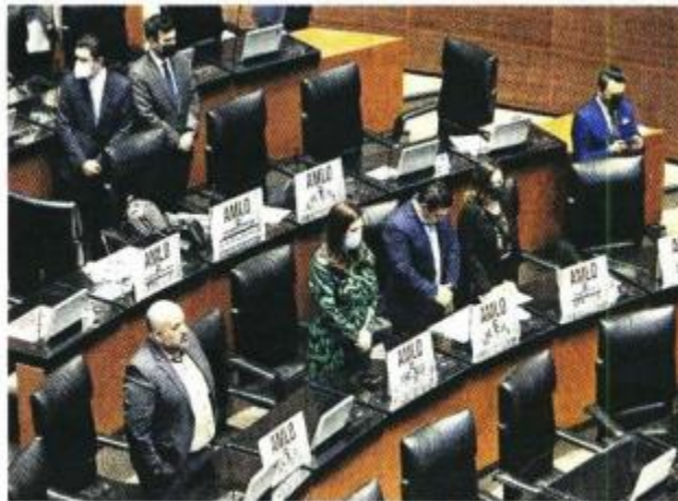
■ Legisladores panistas llevaron a la sesión de la Permanente carteles con cifras sobre diversos delitos en la actual gestión