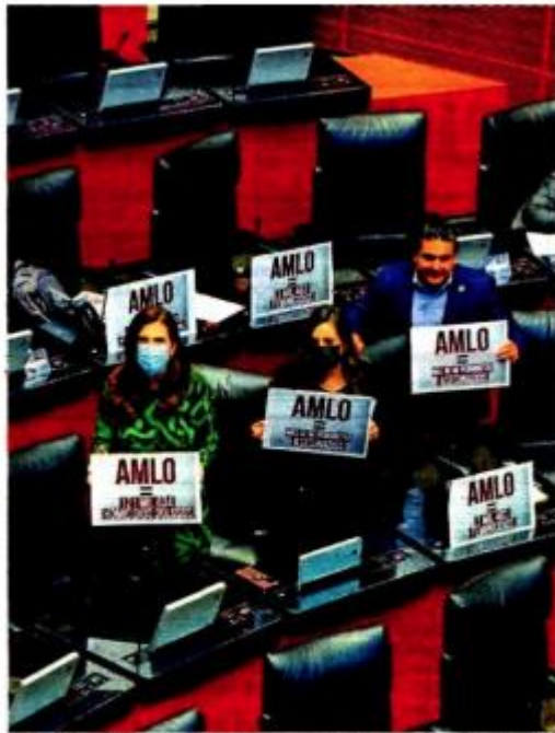
Redefinir la estrategia / FOTO: LAURA LOVERA / OEM-INFORMEX