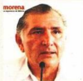
Adán Augusto López Hernández.