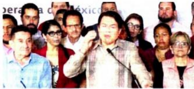
ANUNCIO. Mario Delgado, líder nacional de Morena, ayer.

"Vamos a pedir a los secretarios, gobernadores, diputados, senadores, sindicatos, regidores y militantes que lleven el mensaje por todo el país", informó.