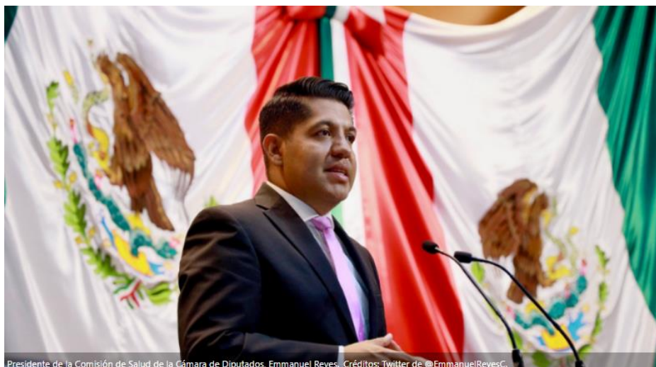
Presidente de la Comisión de Salud de la Cámara de Diputados, Emmanuel Reyes.

MÉXICO (ANGÉLICA MELÍN).- La regulación de la eutanasia en México, en caso de que se apruebe en el Legislativo, podría significar en términos de inversión en salud, un “ahorro” para el Estado, manifestó el presidente de la Comisión de Salud de la Cámara de Diputados, Emmanuel Reyes.