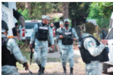
Buscará que la GN se integre a la Secretaría de la Defensa Nacional.