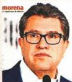
Ricardo Monreal Ávila.