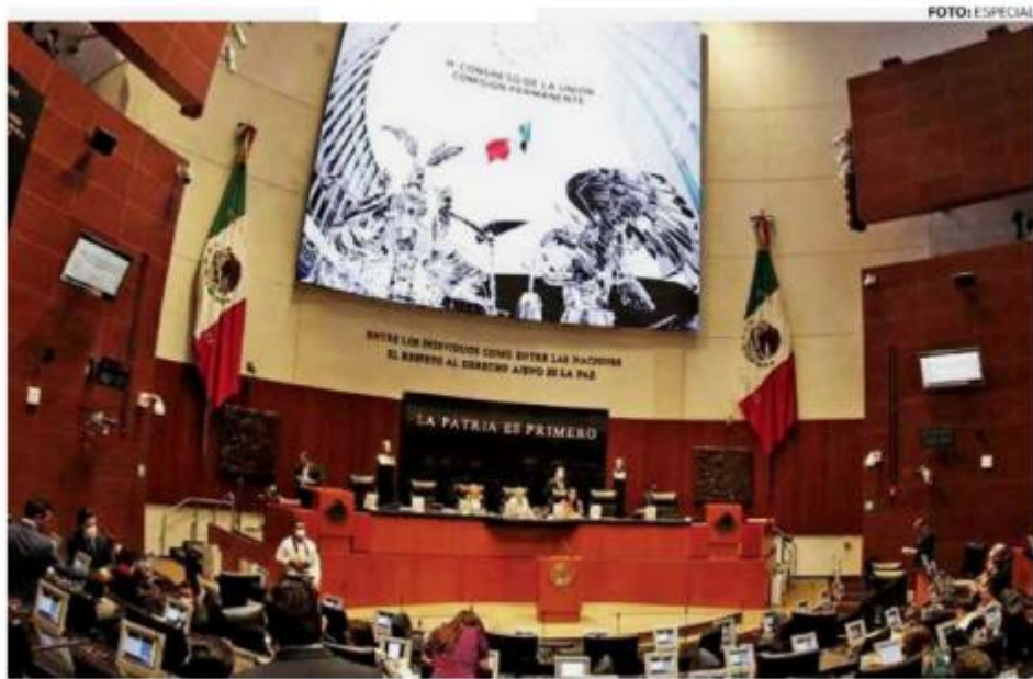
• ASUNTO. En la Comisión Permanente hubo posturas en favor y en contra de la estrategia.