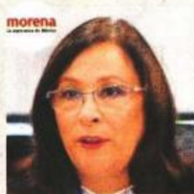
Rocío Nahle García.