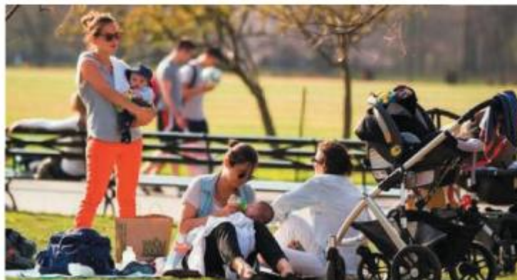
La asociación señaló que se requiere otra legislación en violencia familiar Especial