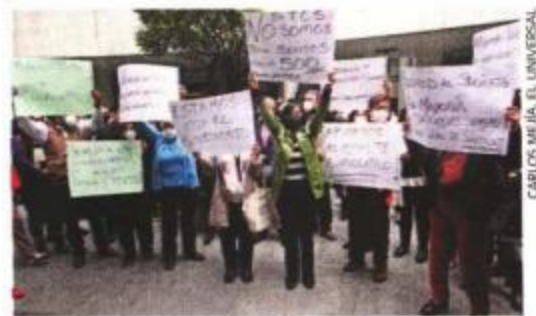
Empleados sindicalizados amagaron con ingresar a la sesión de la Comisión Permanente.