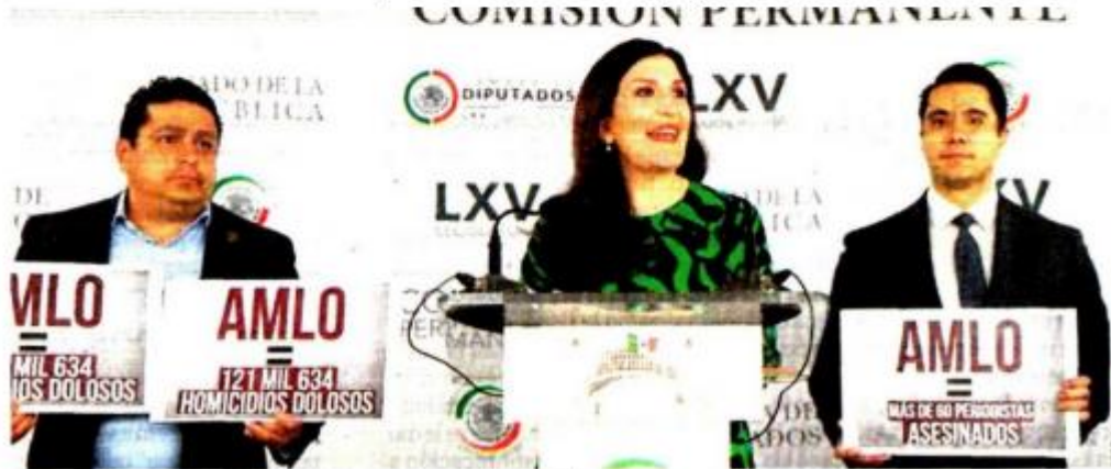
MENSAJE. La vicecoordinadora del PAN en la Cámara alta, Kenia López, ayer.

KENIA LÓPEZ RABADÁN Vicecoordinadora del PAN en el Senado