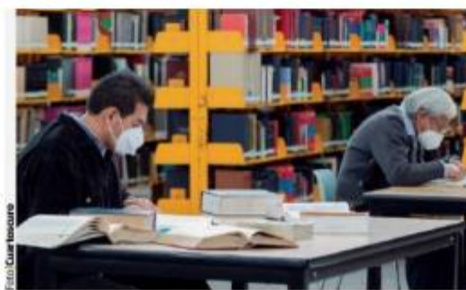
USUARIOS en la Biblioteca México.