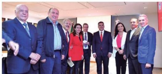
EXDIRIGENTES y legisladores del partido se reunieron el pasado 14 de junio con Alejandro Moreno (4° de der. a izq.).

MORENA presentó el miércoles en la Comisión Permanente una iniciativa para reformar la ley con el fin de impedir que partidos, instituciones o personas puedan utilizar los colores de la bandera.