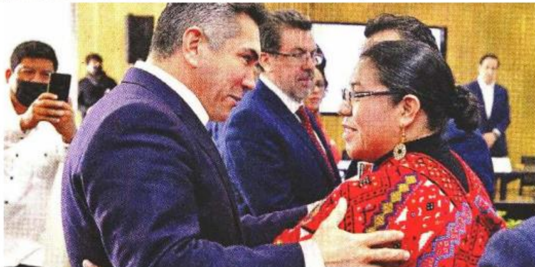
Alejandro Moreno se reunió ayer en la Ciudad de México con diputados locales del tricolor.

"Que no nos doblen los de enfrente. Al contrario, saquemos el carácter y el talento para hacerles frente", indicó, según el boletín.