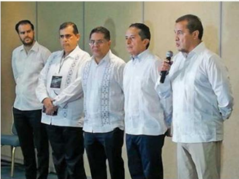
• INAUGURACIÓN. El gobernador de Quintana Roo, Carlos Joaquín, acompañó a los empresarios.