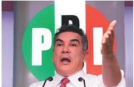
El PRI presentó una iniciativa para modificar la Ley de Armas de Fuego.

Por su parte, durante una entrevista, el senador Miguel Ángel Osorio Chong declaró: "¿Cómo que armar a la población?, es una barbaridad... hay que pedir otras cosas pero no armar a la sociedad".