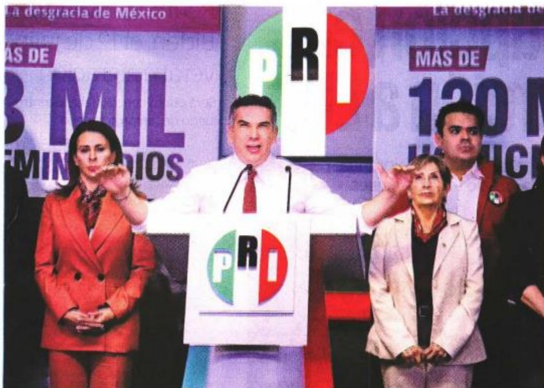
El dirigente nacional del PRI, Alejandro Moreno, anunció en conferencia que presentará dos iniciativas para modificar la Ley de Armas de Fuego, y otra para permitir a elementos del Ejército llevar armas a casa cuando estén francos.