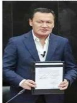
• ADVERTENCIA. Miguel Ángel Osorio Chong.