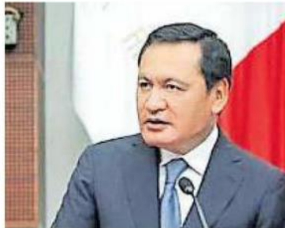
Nos vemos en tribunales / FOTO: @OSORIO-CHONG

Alito acusa a Osorio de adoptar la misma postura que tiene el gobierno de dividir y atacar