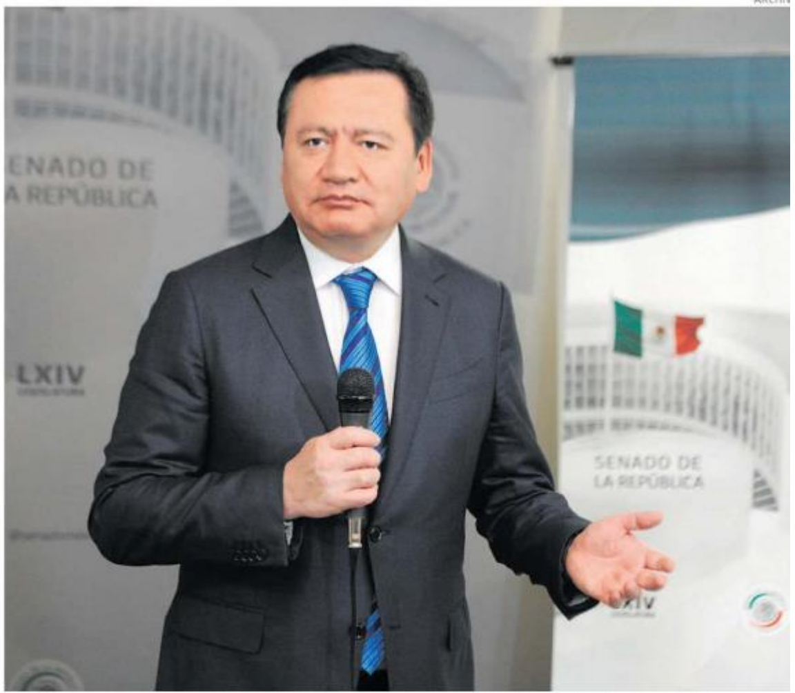
El senador priista confía en que lograrán ganar la elección presidencial