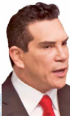
ALEJANDRO MORENO CÁRDENAS Presidente de Partido Revolucionario Institucional

“En redes, han venido haciendo señalamientos, de que si trabajo para el gobierno. Quiero decirles que yo no me he sentado con nadie del gobierno, y él sí. Quiero decirles que no he tenido ningún acuerdo con el gobierno,