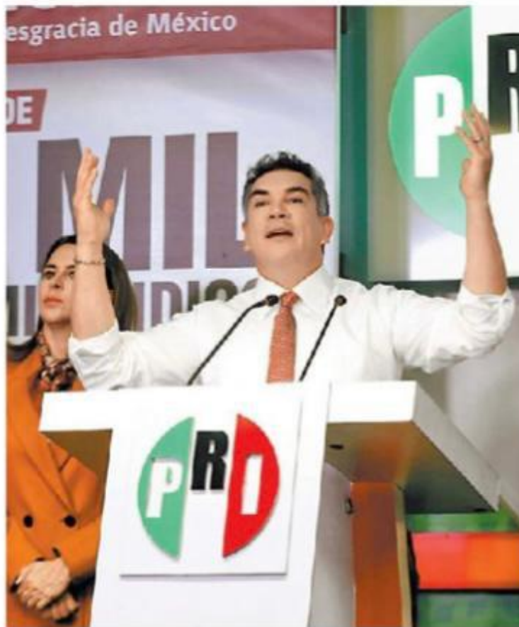
El dirigente criticó el modelo contra la violencia. A. LÓPEZ

el Revolucionario Institucional impulsará una ley para que los integrantes de las fuerzas armadas y la Guardia Nacional puedan llevar sus armas de cargo a sus casas para hacer frente a la delincuencia organizada.