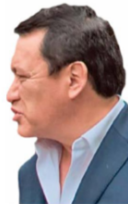
MIGUEL ÁNGEL OSORIO CHONG Senador del Congreso de la Unión de México

Yo no me he sentado con nadie del gobierno, y él sí. Quiero decirles que no he tenido ningún acuerdo con el gobierno, y él sí. A mí nadie me puede señalar de alguna reunión, y a él sí”