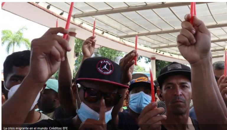
La crisis migrante en el mundo

MÉXICO (ÓSCAR PALACIOS).- Ante la tragedia registrada en San Antonio, Texas, donde se encontró a un grupo de migrantes muertos en el remolque de un camión, legisladores de oposición exigieron un cambio en la política migratoria y económica de nuestro país.