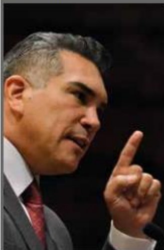
Alejandro Moreno Cárdenas.

Los propios priistas fueron los primeros sorprendido de la propuesta del presidente nacional del PRI, Alejandro Moreno Cárdenas , para transformar a este instituto político en una sucursal mexicana de la Asociación Nacional del Rifle de Estados Unidos que pugna por la libertad ciudadana para portar armas y defenderse de los delincuentes. Esta iniciativa podría estar rompiendo la alianza programática que están tardando en construir los tres partidos de la coalición opositora, porque no fue consensuada con el PAN ni con el PRD.