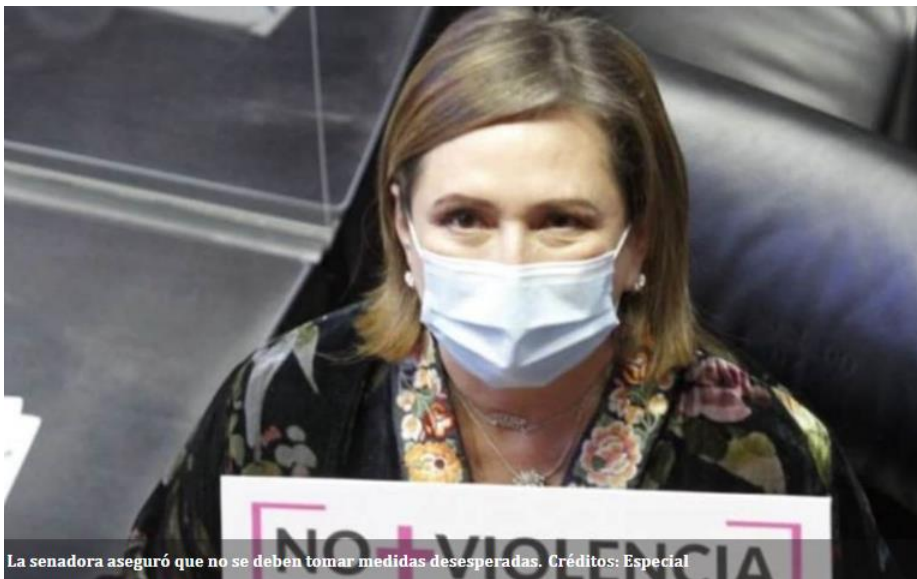
La senadora aseguró que no se deben tomar medidas desesperadas. Créditos: Especial

MÉXICO (ELIA CASTILLO).- La senadora del PAN, Xóchitl Gálvez, rechazó la propuesta del dirigente nacional del PRI, Alejandro Moreno, que busca flexibilizar y legalizar el uso y portación de armas a la ciudadanía con el fin de que hagan frente a la inseguridad que vive el país, adelantó que votaría en contra