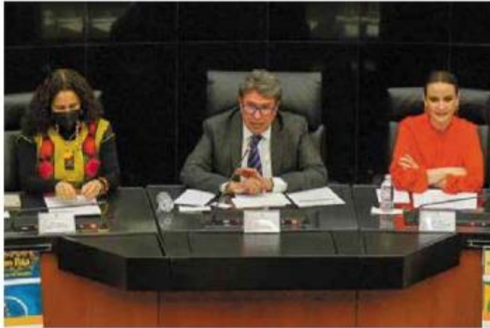
POSTURA. Ricardo Monreal, líder de la bancada de Morena en el Senado, ayer.