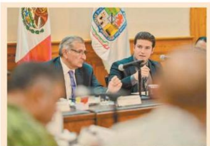
Funcionarios se reúnen durante el acuerdo Juntos por el Agua de Nuevo León. FORO ESPECIAL

4 MILLONES de litros de agua, con una flotilla de 300 pipas, se distri- buyen diario en los municipios metropolitanos.