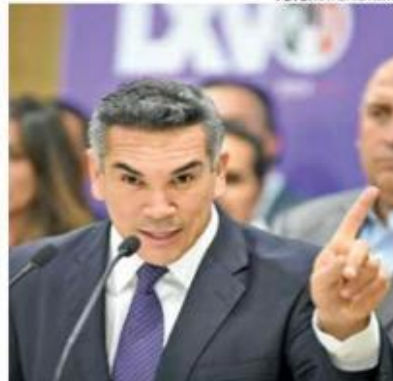
■ APOYO. El dirigente nacional del PRI, Alejandro Moreno, en conferencia.