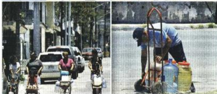
En algunas localidades tienen hasta ocho días sin abasto, por lo que los afectados llevan sus botes en "diablitos" o carreolas para llenarlos donde haya una toma.