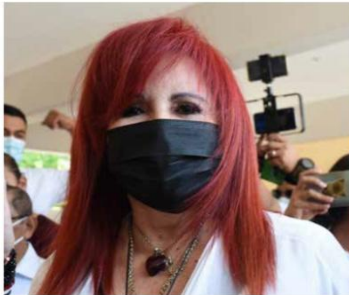
Layda Sansores , gobernadora de Campeche, acusó que las diputadas del PRI enviaron fotografías de carácter sexual al líder de su partido.

Diputadas priistas interpusieron una denuncia penal contra la gobernadora de Campeche por asegurar que Alejandro Moreno tiene imágenes íntimas de ellas