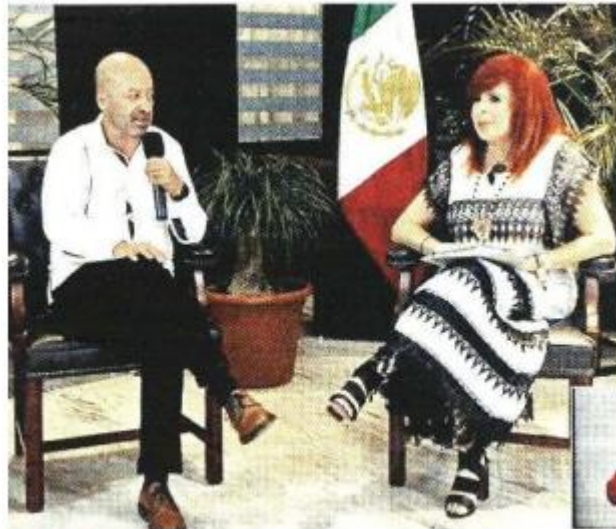
El Fiscal Renato Sales y Layda Sansores, Gobernadora de Campeche, durante el programa "Martes del Jaguar"