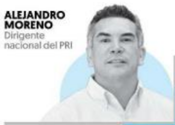
ALEJANDRO MORENO Dirigente nacional del PRI

“Después de actuar de manera valiente, nos han amenazado, nos han calumniado”