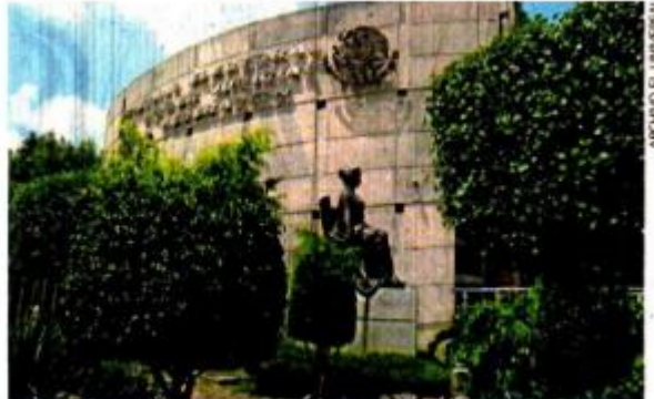
El TEPJF ha recibido denuncias contra Morena por eventos de promoción de precandidatos para las elecciones de 2023 y 2024.