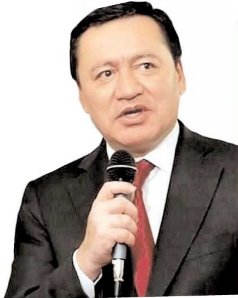
Miguel Ángel Osorio Chong, coordinador de la bancada del PRI en el Senado