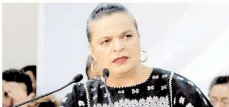
Beatriz Paredes Rangel