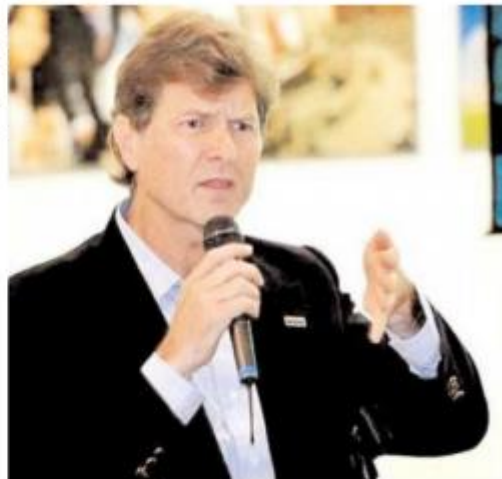
Enrique de la Madrid

de 2023, cuando termina su periodo, para que la nueva dirigencia pueda hacer los acuerdos necesarios no solo para las elecciones a gobernador en Coahuila y el Estado de México, sino para los comicios presidenciales de 2024.