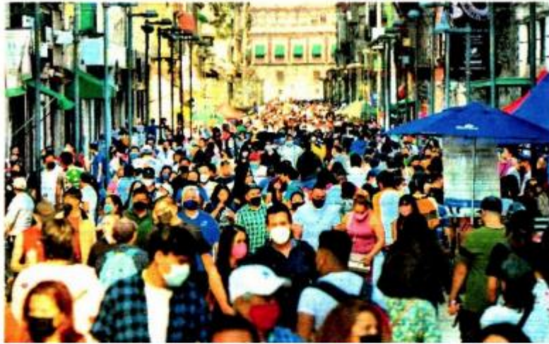
Se requieren propuestas de sociedad y gobierno para atender la problemática ciudadina