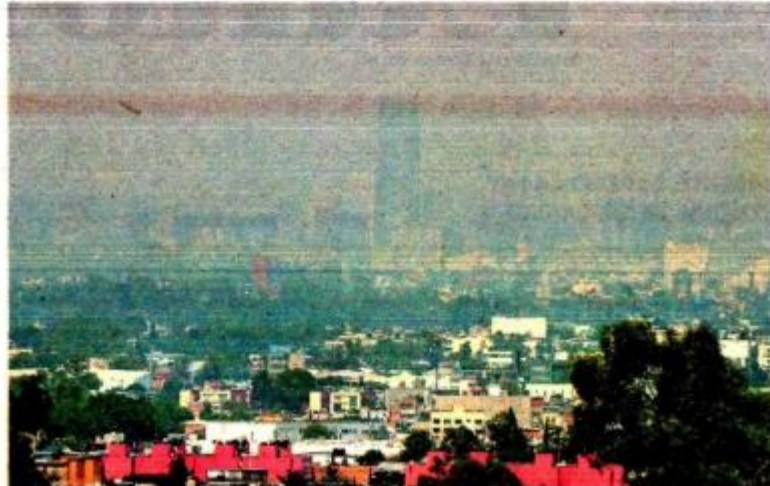
El problema de la contaminación ambiental debe ser de las prioridades que deben atenderse /IGNACIO HUITZIL