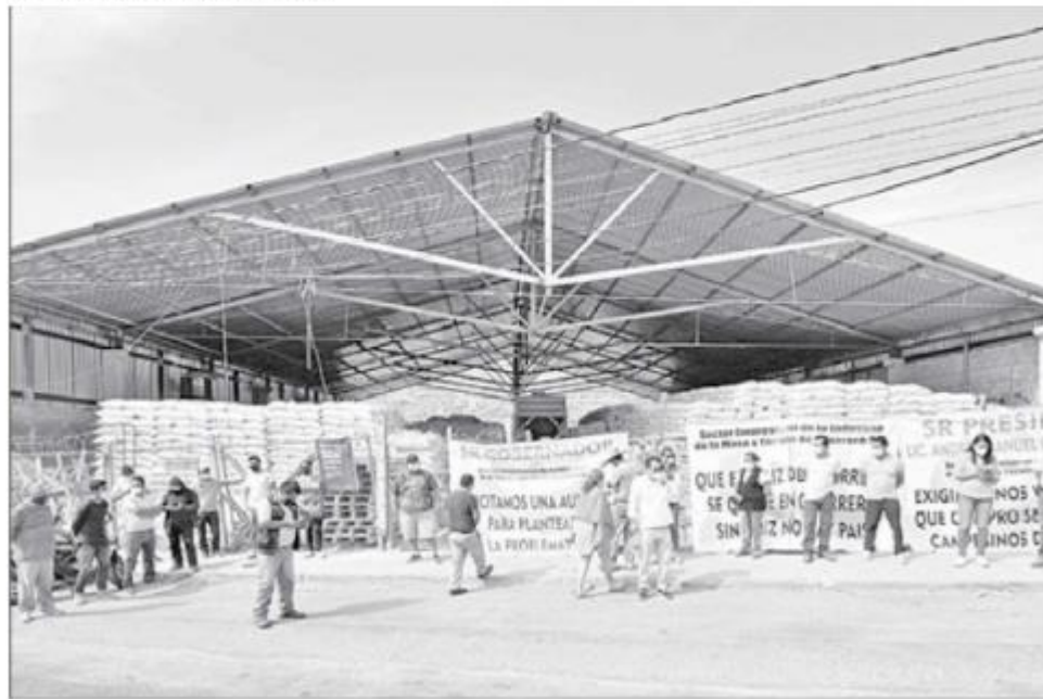
En 2021, tortilleros protestaron en bodegas de Segalmex en Chilpancingo por la salida de maíz comprado en Guerrero.