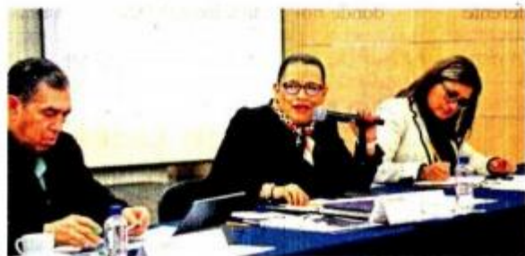
■ La titular de Seguridad y Protección Ciudadana, Rosa Icela Rodríguez, se reunió con legisladores morenistas.

“La Secretaría reunida con legisladores, pero sólo con el bloque en el poder”, dijo.