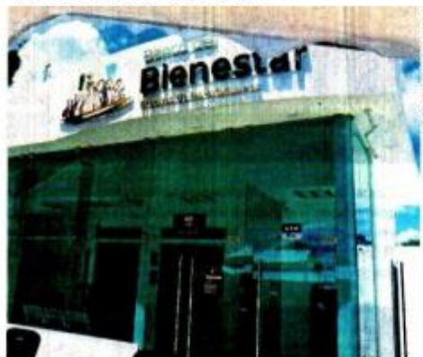
El Banco del Bienestar deberá dar los informes que la Sedena entregó del gasto en obras, indicó el Inai.

la probable irregularidad que detectó la ASF en la edificación de 115 sucursales del Banco del Bienestar.