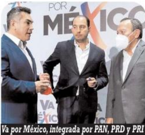
Va por México, integrada por PAN, PRD y PRI

Y a pesar de la moratoria que ellos mismos se impusieron, reiteran de manera tajante que "con firmeza, con claridad y con plena convicción, nuestro voto será en contra de cualquier reforma electoral que ponga en riesgo a nuestra democracia" , concluyen en el citado comunicado.