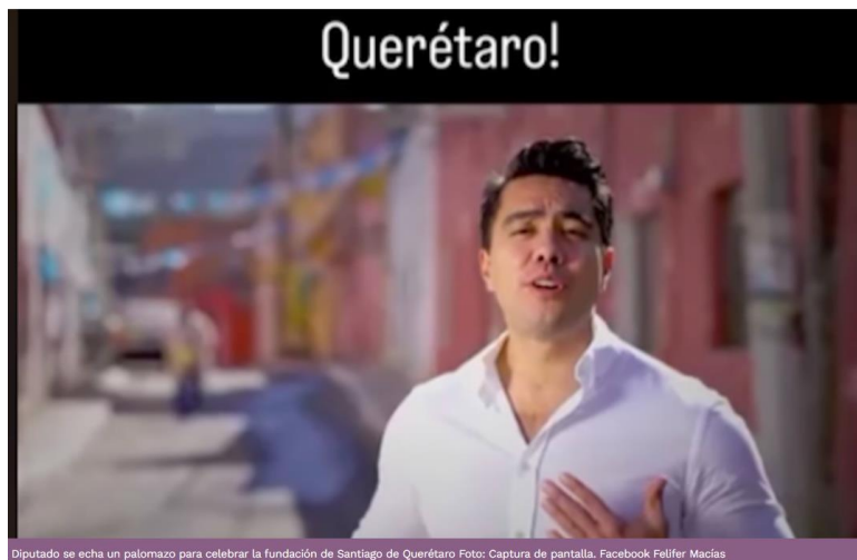
Diputado se echa un palomazo para celebrar la fundación de Santiago de Querétaro

En redes sociales, internautas aplauden los dotes artísticos del diputado federal, aunque también hay quienes lo critican por "sacar provecho" de los festejos tradicionales.