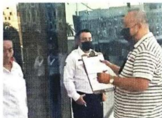
El pasado 19 de julio, un actuario se presentó en el Palacio de Gobierno de Campeche para notificarle a la Gobernadora Sansores la suspensión de un amparo a favor de Alito.

Lo he dicho siempre, a este gobierno autoritario se le combate con la Constitución. México es un país muy fuerte, no permitiremos que pisoteen nuestros derechos y libertades, mucho menos que sigan violando las leyes impunemente.