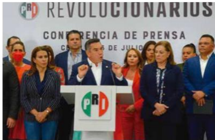
DIALOGO. Alejandro Moreno, líder nacional del PRI, ayer, en conferencia.

Desde la sede nacional de su partido, acompañado de los integrantes del Comité Ejecutivo Nacional y de legisladores federales, Moreno recaló que “los resultados ponen al