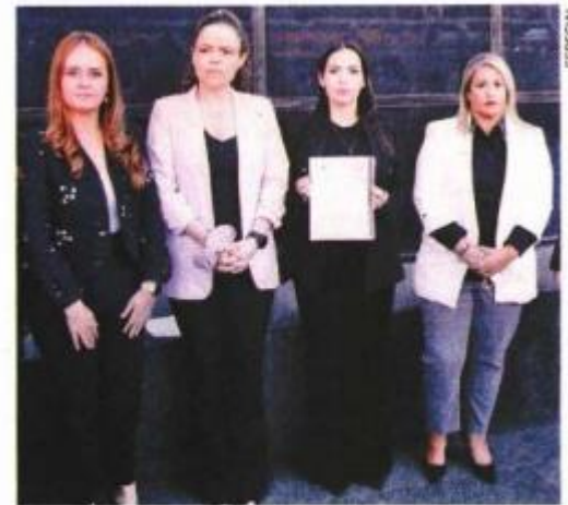
Mujeres panistas denunciaron a funcionarios que resulten responsables por omisión en el caso Luz.

La denuncia expone que se solicita que se inicie la averiguación correspondiente y, en su caso, ejercite la acción penal en contra de quien resulte responsable. ●