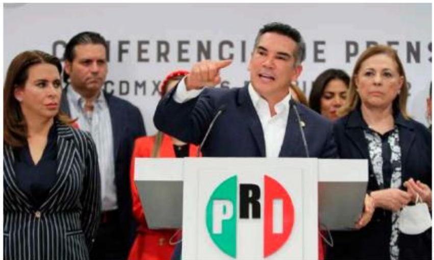
ALEJANDRO Moreno exigió a la FGR acciones legales contra Sansores, ayer.

LA GOBERNADORA de Campeche se vio impedida a difundir nuevos audios contra Alejandro Moreno; ahora resulta que él es el indefenso, asegura; dice que no violó ninguna ley