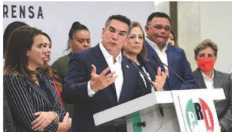
EL PRESIDENTE nacional del PRI, en conferencia de prensa, el pasado 26 de julio.

LOS MAGISTRADOS señalan que el fallo del juez no era competente para emitir este veredicto en favor de Alejandro Moreno; líder tricolor cuenta con una segunda resolución