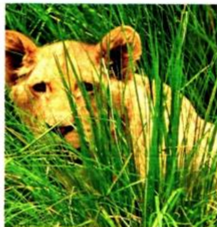
Maltratados y sin cuidados.

NO CONTABA Black Jaguar- White Tiger (BJWT) con los requisitos mínimos para atender a los felinos.