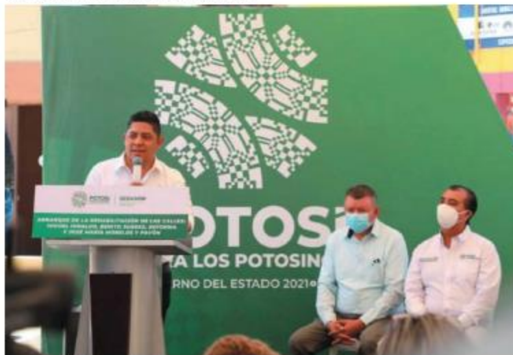
Se han recuperado 60 millones de pesos de exfuncionarios. Especial

Recordó que ante la Auditoría Superior de la Federación (ASF) tiene el registro de desfalcos por mil millones de pesos, por lo que tocará a este nivel de gobierno recuperar el adeudo. ●