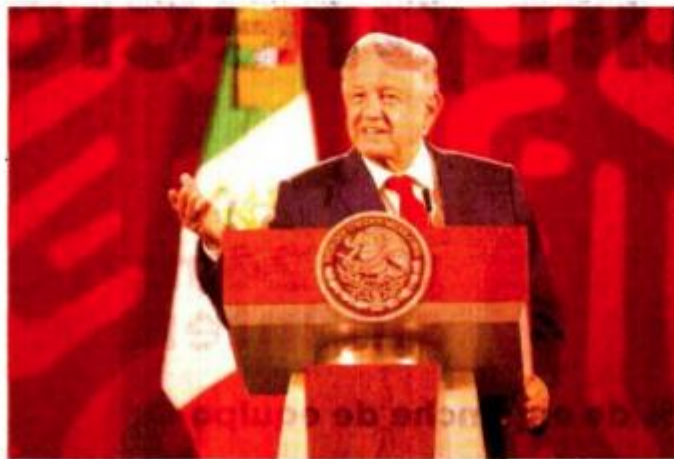
GERMÁN ESPINOSA. EL UNIVERSAL

“[La Guardia Nacional] va a seguir siendo una institución de carácter civil dependiendo de la Secretaría de la Defensa”