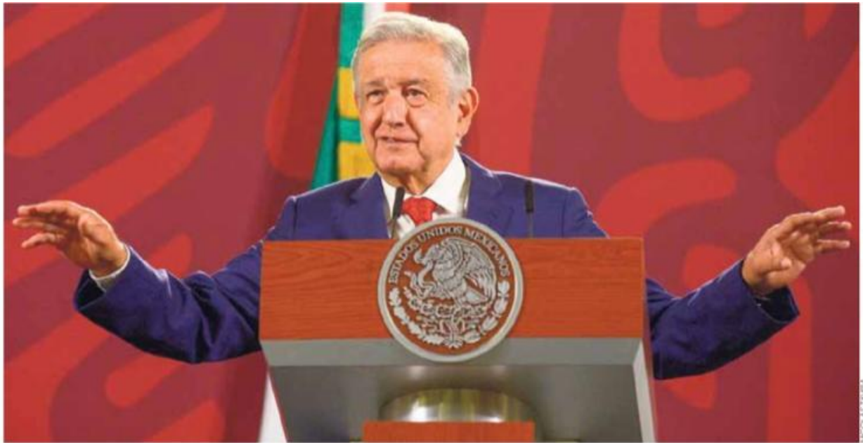
MODIFICACIONES. El presidente Andrés Manuel López Obrador, en su conferencia matutina de ayer, en Palacio Nacional.

Afirmó que lo debe hacer por obligación. "Soy Presidente de México y creo que conviene que la Guardia Nacional quede como una rama de la Secretaría de la Defensa para que se le dé estabilidad en el tiempo y no se corrompa, y siga cumpliendo