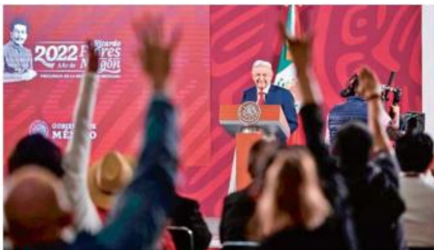
MAÑANERA. El Presidente señaló que si no es con una reforma constitucional el cambio recurrirá a una reforma de ley.