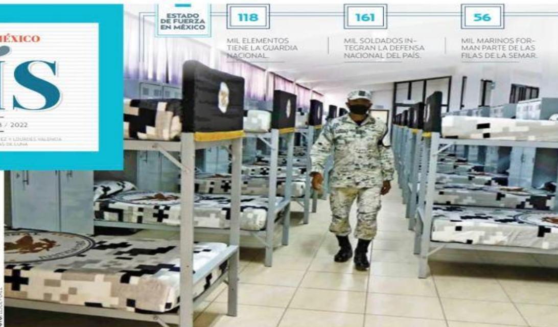
• EQUIPO. Los integrantes de la Guardia Nacional, con todo y sus equipos e infraestructura, se planea que formen parte del Ejército.