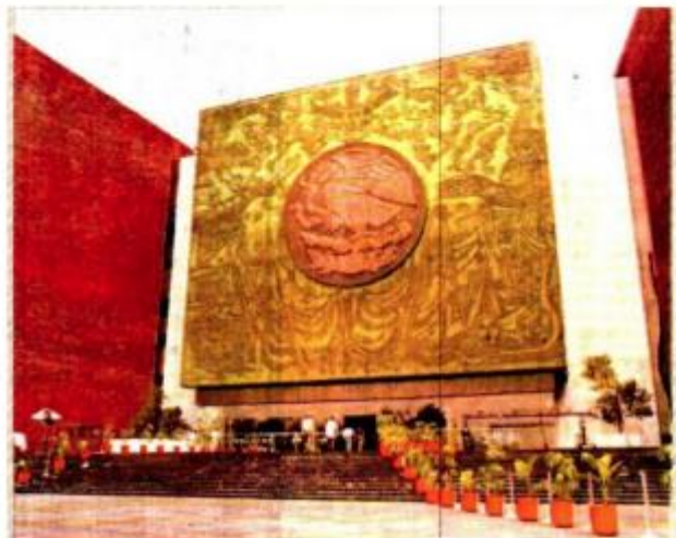
La creación de la Guardia Nacional fue avalada por la 64 Legislatura del Congreso de la Unión.

"No me siento engañada, me siento violentada porque la creación de la GN tenía la condición de que fuera civil"