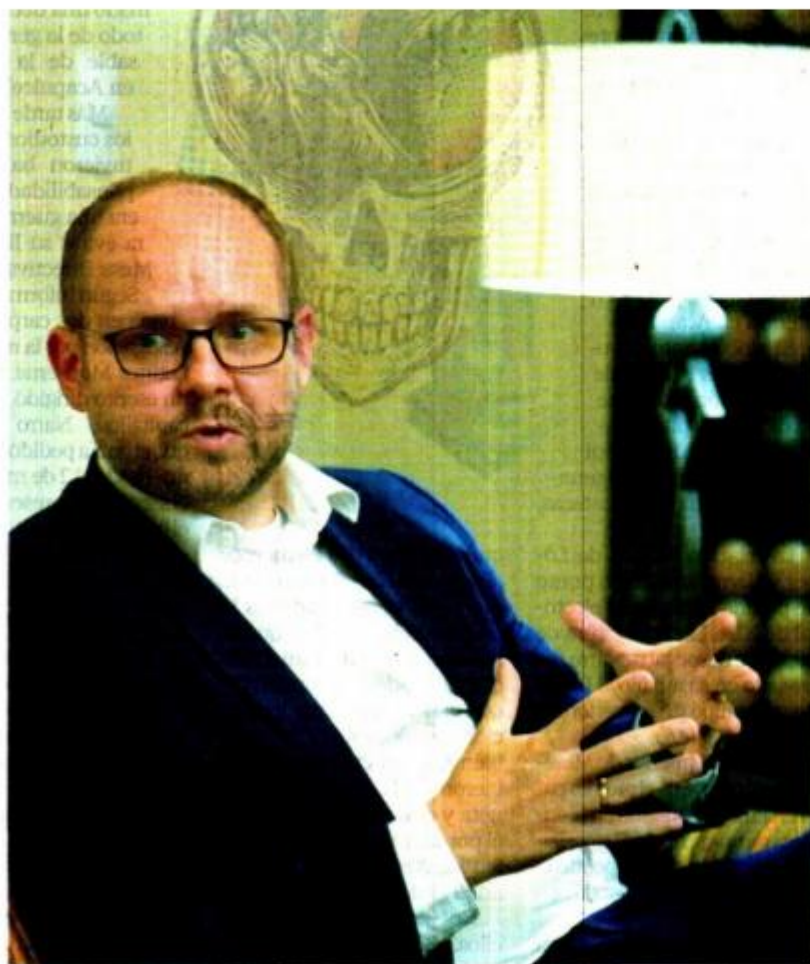
GERMÁN ESPINOSA EL UNIVERSAL

—Hubo dos resoluciones, por cierto la iniciativa sobre los aspectos humanitarios salió de México, entonces las dos fueron muy buenas. Qué bien que la mayoría de los países miembros de la ONU han condenado a Rusia y sólo cinco votaron en contra de la resolución. Pero hay que pasar de las palabras a los hechos, debe significar apoyo financiero a Ucrania. ●