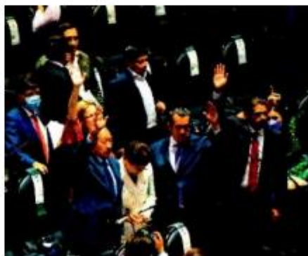
Quieren a Alejandro Moreno, fuera

Diputados de Morena quieren destituir al priista de la Comisión de Gobernación