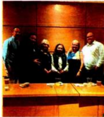
Los LeBarón, al entregar su iniciativa