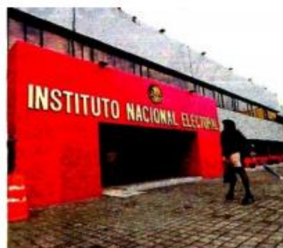
Los fondos frenan al crimen organizado

Externó su preocupación por el momento en que se debate el tema, porque están por iniciar procesos electorales para Coahuila y el Estado de México.