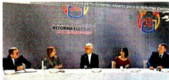
Consejeros y fiscales de delitos electorales participaron en un foro sobre la reforma enviada por el Ejecutivo.

Fromow indicó que se debe analizar de dónde vienen los recursos de las campañas y de dónde vienen los candidatos, a fin de poder prevenir la injerencia del crimen organizado en los procesos electorales.