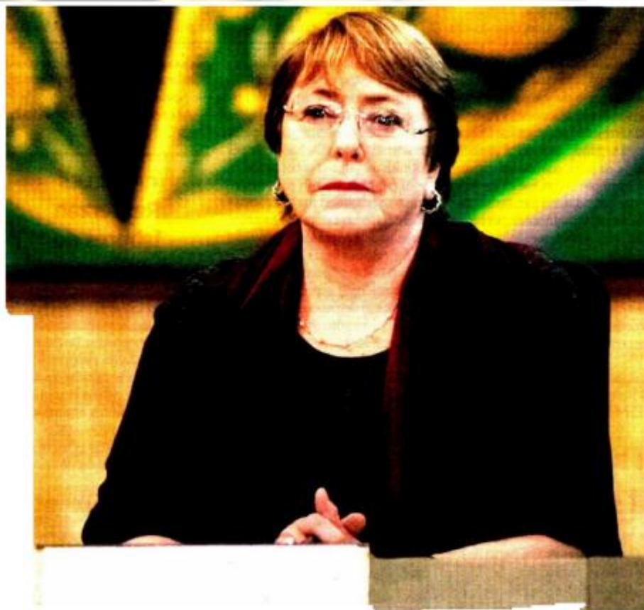
CRÍTICA. Michelle Bachelet, alta comisionada de Naciones Unidas para los Derechos Humanos, en una conferencia en 2019.