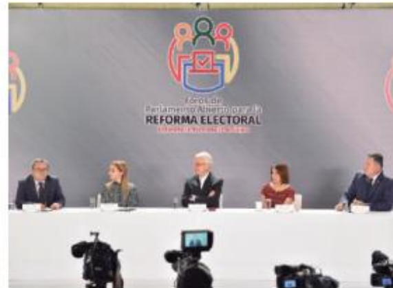
PARTICIPANTES al foro abierto para la Reforma Electoral, ayer.

ESPECIALISTAS VEN necesario que órganos del INE e instituciones de justicia trabajen en conjunto; piden cerrar puerta al financiamiento privado para partidos políticos