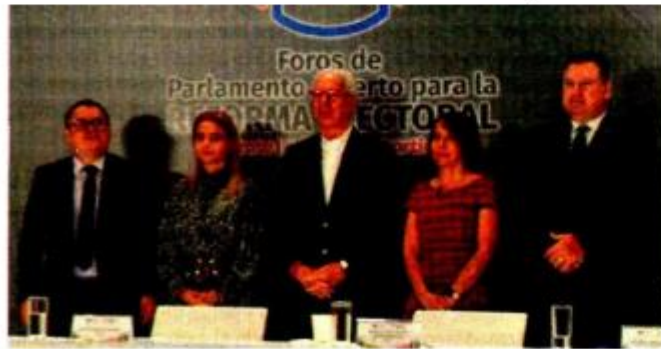
DIÁLOGO. Consejeros federales y locales, ayer, en la Cámara de Diputados.