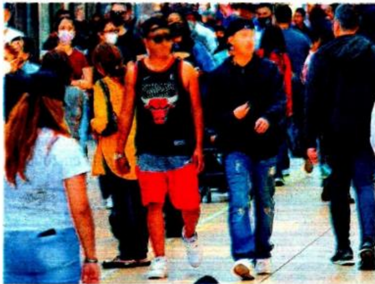
Más de 30 millones de jóvenes de 12 a 29 años en el país, atraviesan por un escenario político, social y económico complejo, afirma Aldeas Infantiles / SERGIO VAZQUEZ.

El 40% de la población joven se encuentra en situación de pobreza, el 67% no tiene acceso a la seguridad social y el 22% carece de acceso a los servicios de salud