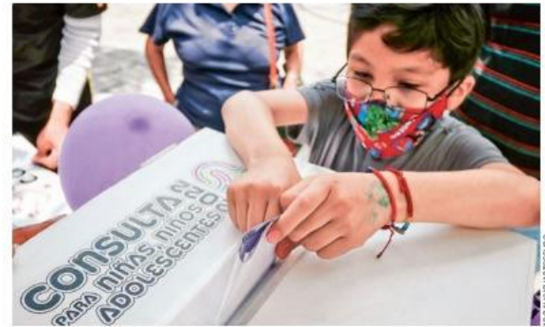
ENTREGA. El Consejero Presidente del INE expuso los resultados de la Consulta Infantil y Juvenil.

“Estoy convencido que los resultados de esta consulta representan insumos valiosos para el diseño de nuestras leyes y de políticas públicas que contribuyan al desarrollo