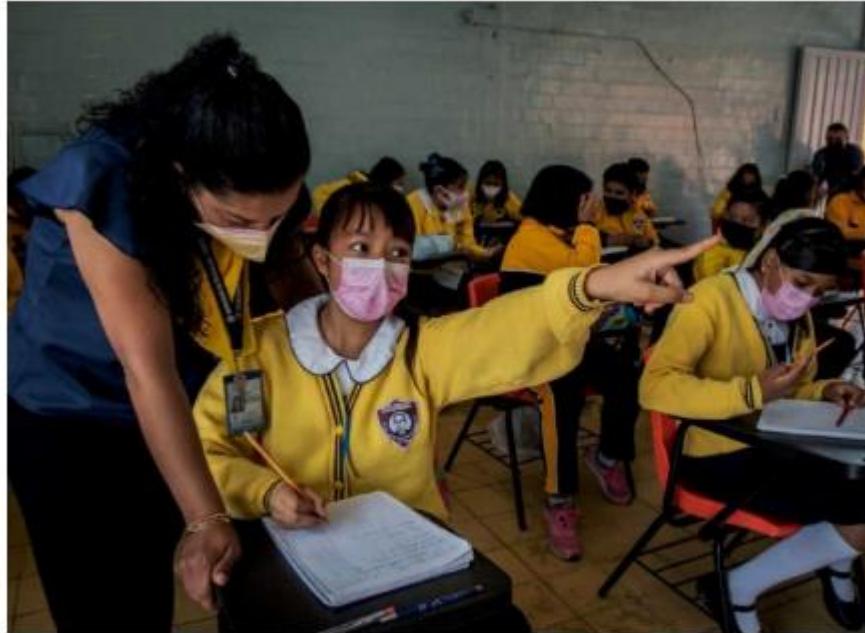
El Nuevo Modelo Educativo se implementará como piloto en 30 escuelas por estado.