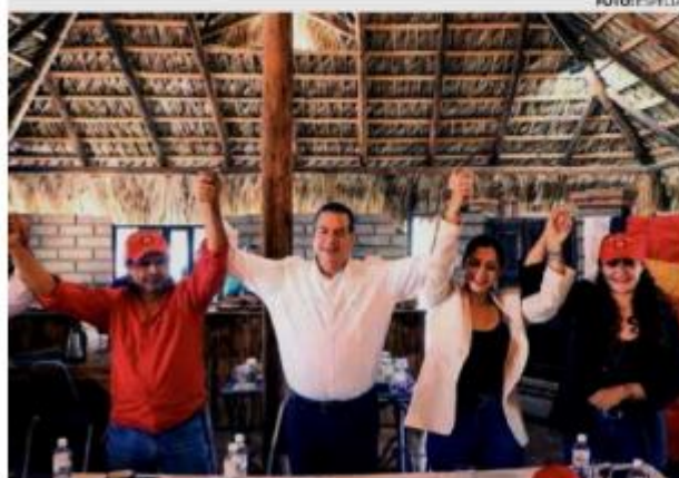
VISITA. | • Mejía estuvo con militantes del PT en Saltillo, este fin de semana.

2 • Subrayaron que los coahuilenses confían en él y le brindan su apoyo.