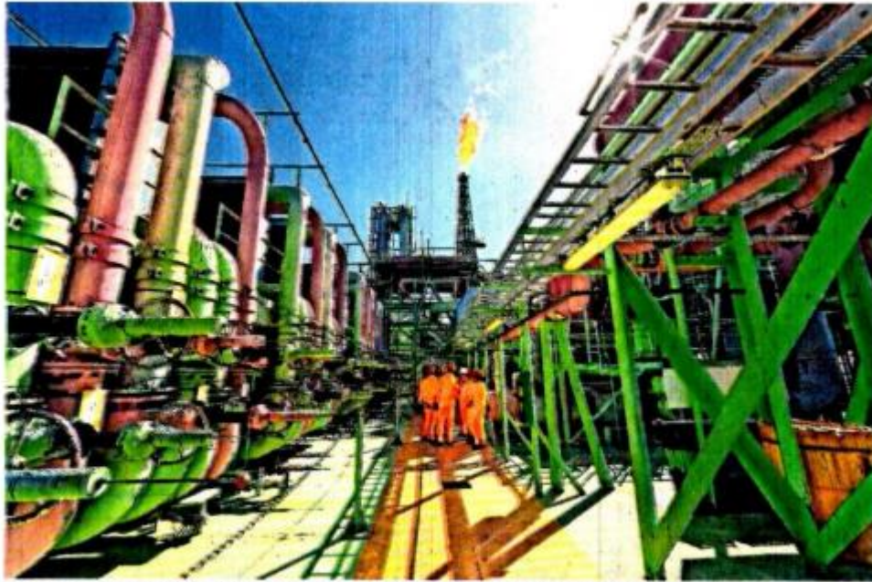
El precio observado de la mezcla mexicana de petróleo de diciembre de 2021 a mayo del año en curso promedió 90.20 dólares por barril, de acuerdo con información de la SHCP.