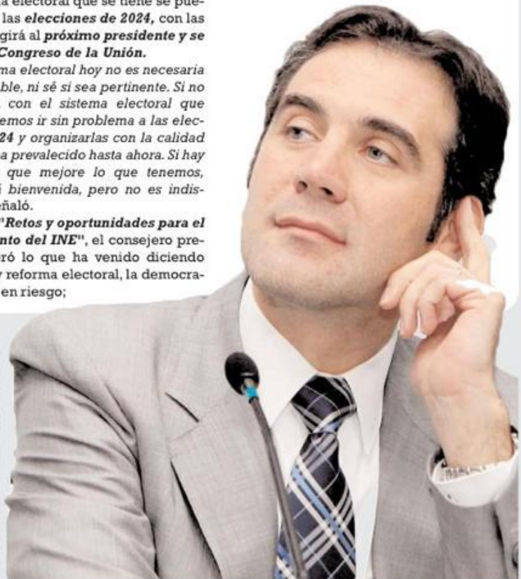
Consejero presidente del Instituto Nacional Electoral, Lorenzo Córdova V.

"Si hay una reforma electoral que sea resultado de la cabeza y no del estómago. Que no sea resultado de filias o fobias, o peor aún, de rencores personales, porque entonces tendremos garantías de que la reforma lejos de fortalecer el sistema que tenemos, va a servir para dinamitar", concluyó Córdova.