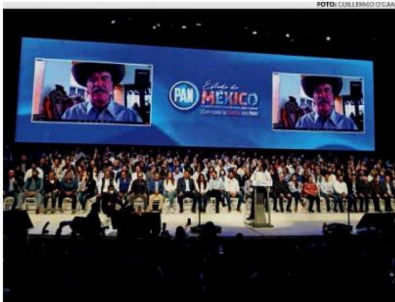
• MISIVA. Vicente Fox señaló que la unidad será la que marcará la luz en el camino.