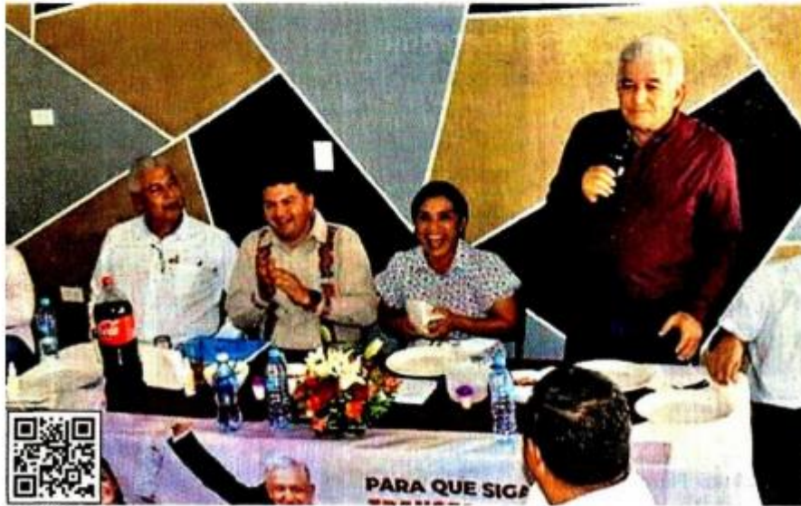
■ La Gobernadora de Campeche, Layda Sansores, organizó un evento masivo a favor de la Jefa de Gobierno.