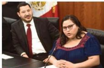
LABOR. La morenista regresó al Senado de la República desde abril pasado.

La secretaria general de Morena, con su doble sueldo, ganaría más que el presidente