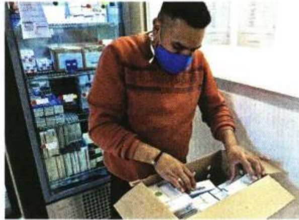
El Insabi prevé iniciar en octubre la compra de medicinas e insumos para abastecer 2023 y 2024.

REFORMA publicó que transformar el sistema de compra y distribución de medicamentos pasó una alta factura al Gobierno de la 4T, pues en 2021 hizo compras con 14.8 por ciento de inflación, una tasa histórica que, sin embargo, podría repetirse este 2022, según un diagnóstico del centro de consultoría Inefam.