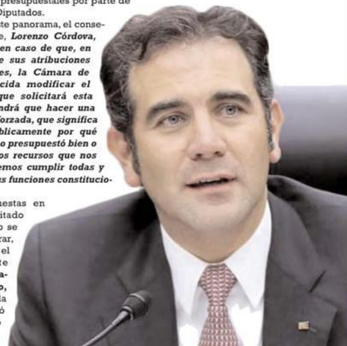
Lorenzo Córdova Vianello, titular INE

Posteriormente a esta resolución se discretó el presupuesto precautorio por 4 mil millones para una posible Consulta Popular, que también fue aprobada.