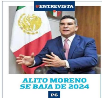
ALITO MORENO SE BAJA DE 2024