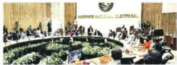
La Contraloría del INE revisará a detalle los recursos del proyecto de presupuesto 2023.

El informe analiza el comportamiento presupuestal entre 2018 y 2022, y concluye que no hay una planeación eficaz, pues "es evidente que muchas partidas están sobrepresupuestadas en las solicitudes presentadas al Legislativo, pues no ejercen la totalidad de los recursos aprobados año con año".