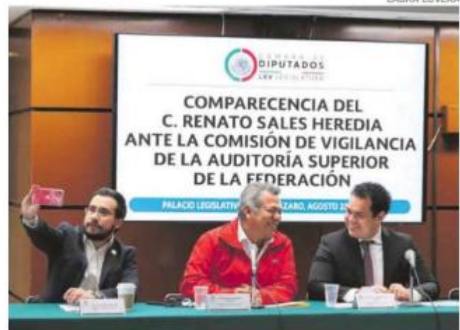
Los legisladores se quedaron esperando el fiscal de Campeche