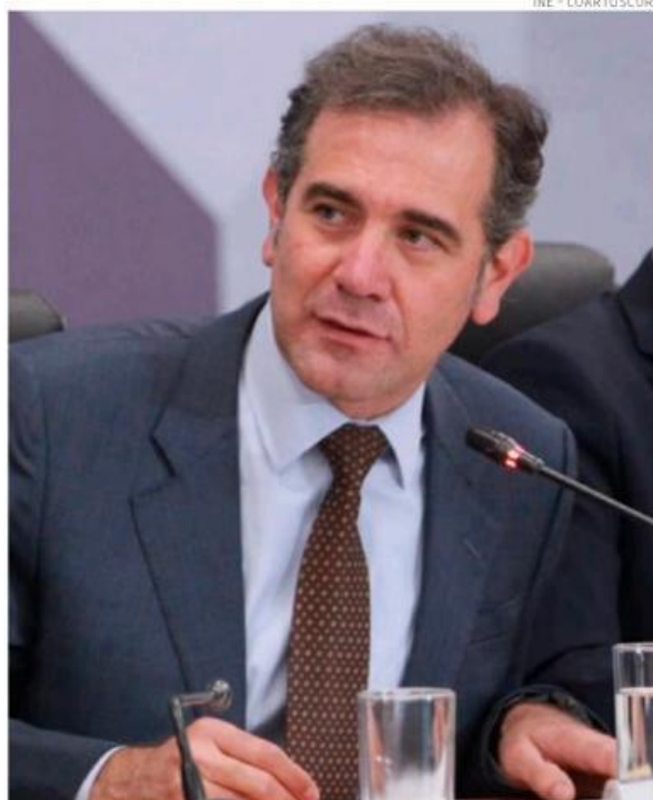
Lorenzo Córdoba defiende al INE y los procedimientos electorales.

Sin salirse del tema central que es la propuesta de una reforma electoral como propone el gobierno de la 4T, el titular del INE reiteró que “este ya