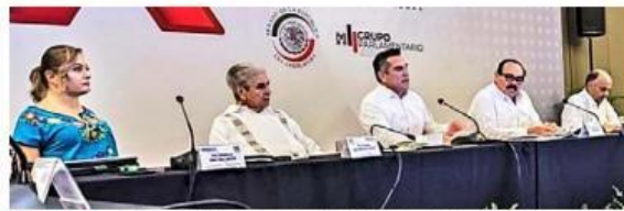
REUNIÓN. Senadores decidieron no asistir a la plenaria de Moreno Cárdenas.

Acclararon que los estatutos del partido permiten la renovación de la dirigencia nacional dentro de los seis meses previos al término del período estatutario. “Sería muy grave e inaceptable que la actual dirigencia nacional pretendiera permanecer