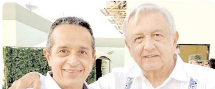
Carlos Manuel Joaquín González y el presidente López Obrador