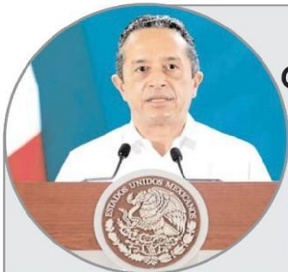
Carlos Manuel Joaquín González