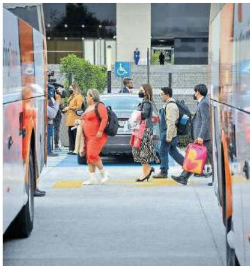
Los llevan en camiones a hoteles cercanos a San Lázaro.