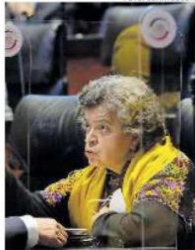
Hay que actuar unidos, dice Beatriz Paredes.