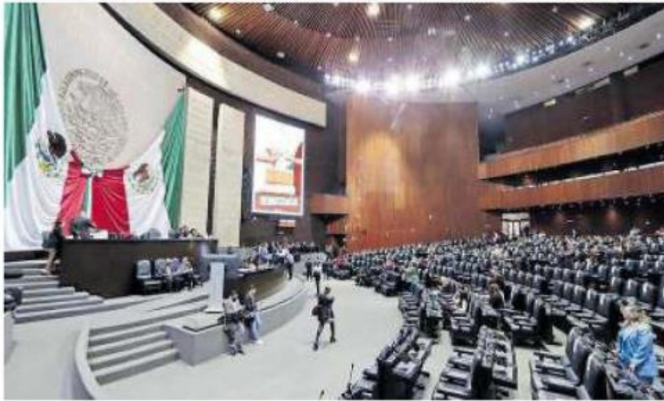
La Cámara de Diputados ayer, antes de la sesión ordinaria.