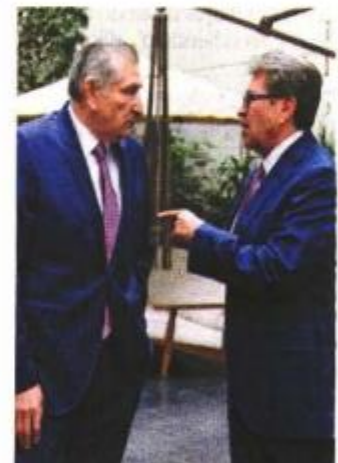
Adán Augusto López, titular de la Segob, y Ricardo Monreal, líder de Morena en el Senado.

“No, yo no tengo ningún jefe ni patrón. Al secretario de Gobernación lo respeto... analizamos lo que podría suceder con el envío de la minuta de la Cámara de Diputados”