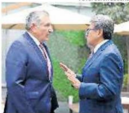
El secretario de Gobernación, con Ricardo Monreal.