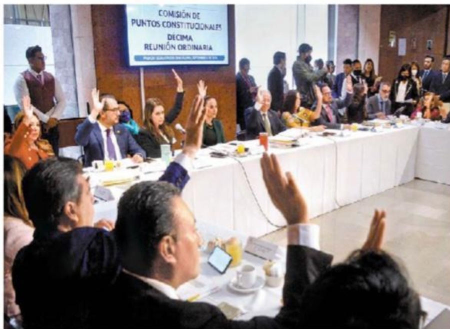
Reunión de la Comisión de Puntos Constitucionales.