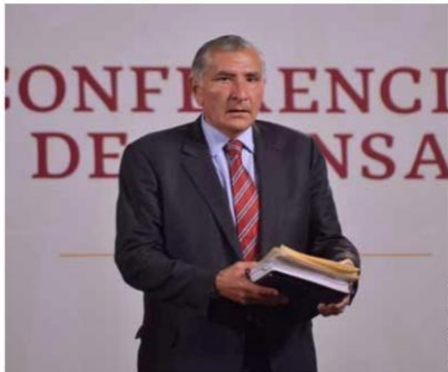
Adán Augusto López estuvo en ambos recintos legislativos en el marco de la discusión por la permanencia del Ejército en las calles.

El secretario de Gobernación, Adán Augusto López, visitó a diputados y senadores, mientras se analiza el avance de la iniciativa para dejar al Ejército en las calles hasta 2029