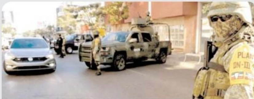
Ampliación del periodo de las Fuerzas Armadas en tareas de seguridad sea hasta 2029

Dentro de los argumentos, los diputados del tricolor aseguran que es necesario extender la presencia del Ejército en tareas de seguridad pública debido a la violencia por la que atraviesa el país. Sin embargo, activistas y otros políticos se oponen a esta medida.