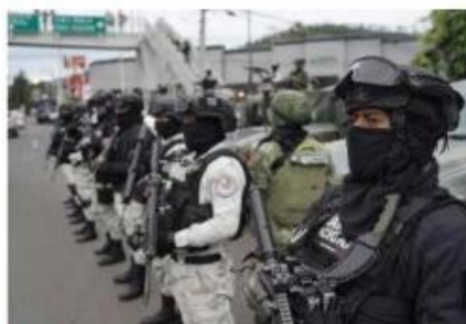
La Comisión defendió el paso de la Guardia Nacional a la Sedena.

autónomo dijo que no solamente no interpondrá una acción de inconstitucionalidad en contra de lo aprobado por los legisladores, sino que irá más allá de eso al sumarse a la medida propuesta por el Ejecutivo federal a través de sumarse a la ejecución de las reformas “mediante su observancia y monitoreo atendiendo las quejas que, desde luego, pudieran derivarse de posibles violaciones a los derechos humanos”. • Sin embargo, subrayó que será necesario que la Guardia Nacional actúe de la mano con las instituciones del Estado mexicano.