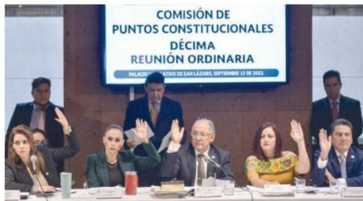
Diputados en sesión de la Comisión de Puntos Constitucionales.

La iniciativa es que vía la Guardia Nacional, el Ejército asuma tareas de seguridad, y se espera que estos cambios pudieran estar antes del desfile militar del próximo 16 de septiembre,