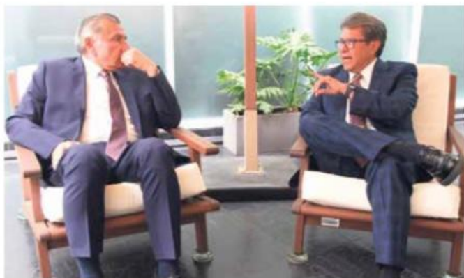
DIÁLOGO. El secretario de Gobernación, Adán Augusto López, y Ricardo Monreal.

Lo necesario. Para aprobar una reforma constitucional, la mayoría oficialista requiere de mayoría calificada; es decir, las dos terceras partes, cuando menos, de los legisladores que se encuentran presentes en el salón de plenos al momento de realizar una votación en la cámara.