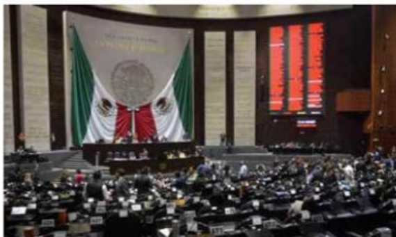
Los diputados de Morena pretenden que la Corte no participe en temas legislativos.

Morena presentó iniciativa para restringir la participación de la SCJN en posibles modificaciones a la Constitución