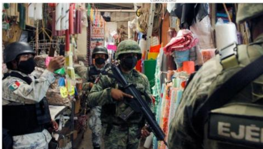
Hasta la noche de ayer intentaban sumar votos para avalar que el Ejército mantenga tareas de seguridad.

“Me parecería muy menor frente al interés del país el que se quiera rechazar sólo porque el presidente del PRI fue quien la propuso y quien a juicio de ellos tiene un acuerdo con el gobierno, no, yo no tengo elementos para precisar eso, no sé si hubo esos acuerdos, pero lo que debe llevarnos a la discusión es la racionalidad, la oportunidad y lo indispensable que pueda resultar la actualización normativa de una refor-