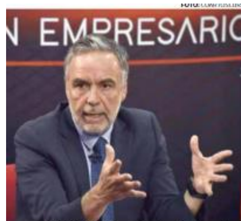
• POSICIÓN. Alfonso Ramírez Cuéllar está a favor de que Alejandro Moreno sea desaforado.

DE LA SECCIÓN INSTRUCTORA SON DE MORENA.