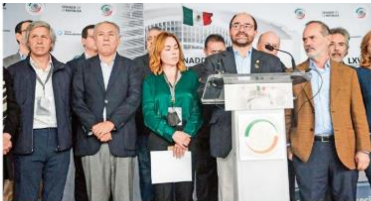
SOLICITUD. Miembros de la asociación civil pidieron que se vote en contra del dictamen.

El coordinador de los senadores de Morena, Ricardo Monreal, informó que se estaban revisando “muchas redacciones propuestas” para poder avanzar en los consensos. No obstante, aclaró que éstas no serían en el artículo a discutir, porque esto implicaría el retorno de la minuta a la Cámara de origen, pero sí en complementar y reforzar el criterio que todos debemos de tener”.