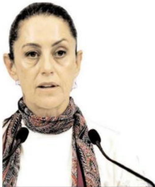
La jefa de Gobierno, Claudia Sheinbaum Pardo