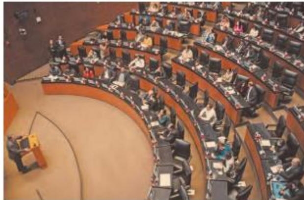
Durante la sesión, senadores de oposición denunciaron intentos de compra de votos para que la reforma pasara en el pleno.

no fue aceptada durante la negociación correspondiente, consistía en no moverle ni una coma respecto de lo aprobado por la Cámara de Diputados, pero incluir una nueva redacción del sexto transitorio para que el Congreso de la Unión tuviera mayores facultades de evaluación de la Guardia Nacional.