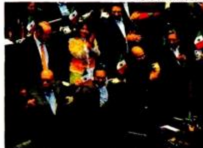
Sigue la disputa en en Senado.