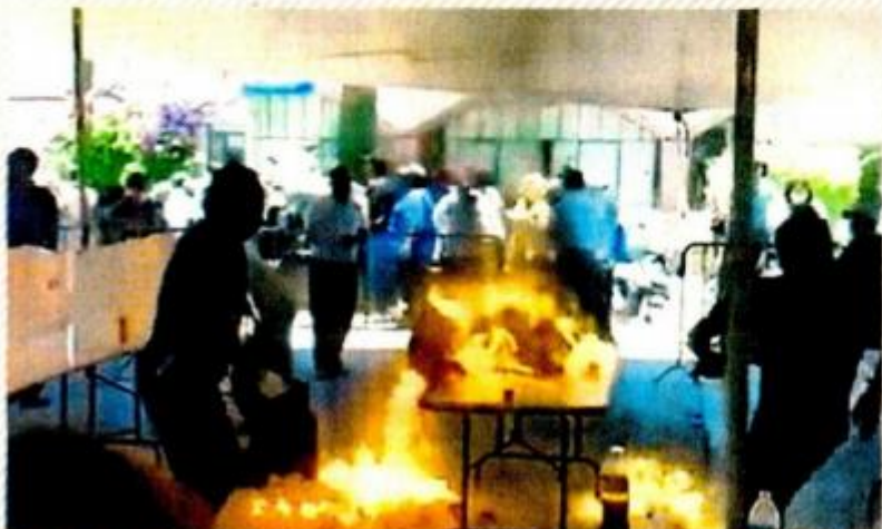
Ante las irregularidades, militantes acusaron opacidad en el proceso.

2025 AÑO en que Morena hará pública la información relacionada con la elección interna del partido.