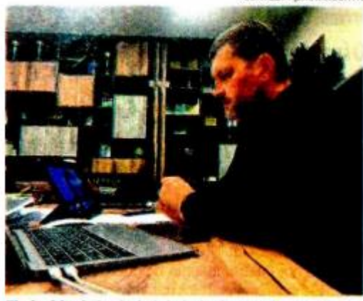
El alcalde de la ciudad de Irpin durante la reunión