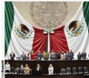
DIPUTADOS guardaron ayer un minuto de silencio por las víctimas del sismo.

LA REDIM indicó que, según el Registro Nacional de Personas Desaparecidas y No Localizadas, 2n 2021 cada día 17 personas de entre 0 y 17 años se reportaron en esta condición.