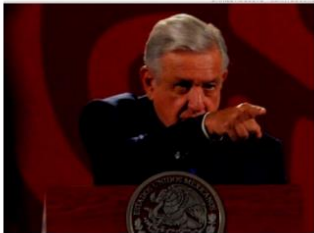
El presidente López Obrador sugiere señalar a legisladores que voten en contra de la reforma militar.