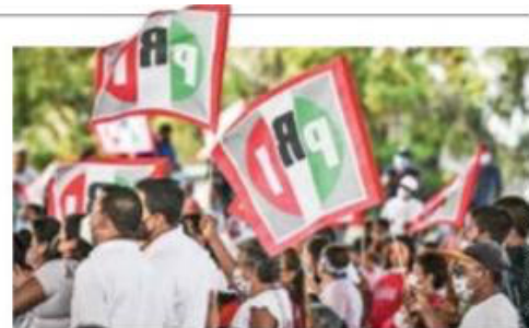
CARRERA. En Coahuila y Edomex su ventaja es de 5% y 3% sobre Morena, respectivamente.

Destacó que Herrera es quien mejores nú-