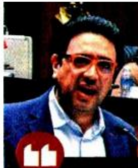
EDUARDO RAMÍREZ SENADOR DE MORENA

Estamos en la deliberación. Hay dos alternativas. Una, que pase el dictamen como está, que no tenga ninguna modificación, que eso es lo más difícil."