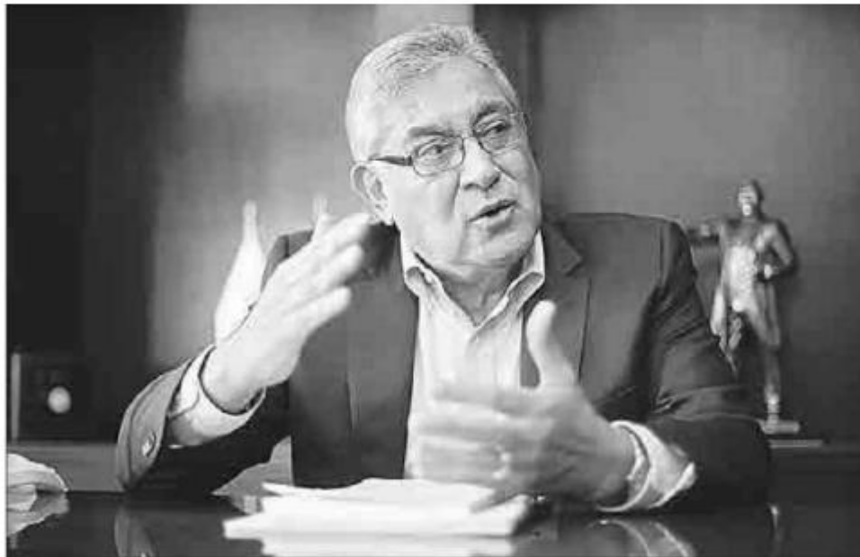
▲ El heredero de las riendas del sindicato más grande de América Latina coincide con la visión de la CNTE sobre la nueva forma de promocionar a los maestros que buscan mejorar su salario.

Con el Usicamm esconden plazas y las dan sólo a la gente que les interesa