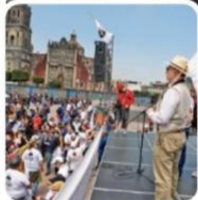
VOCES. Durante la marcha con rumbo al Zócalo capitalino, miembros del Comité 68 expresaron su rechazo ante la militarización.