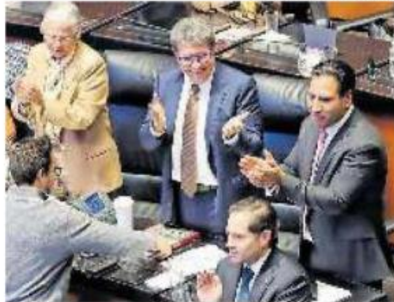
Siguen los militares en tareas de seguridad.

El dictamen modificado en los últimos días en el Senado, señala que las Fuerzas Armadas estarán sujetas a mecanismos de control, evaluación y supervisión que serán ejercidos por el Congreso para vigilar su actuación constantemente.