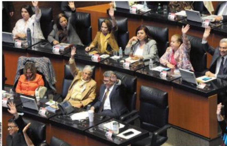
LA BANCADA de Morena, durante la votación, ayer.

El líder de la mayoría guinda aseguró que el Poder Legislativo saldrá ganando: "Hoy, el Senado y el Congreso ganan, porque siempre nuestra lucha ha sido por mantener el equilibrio de poderes,