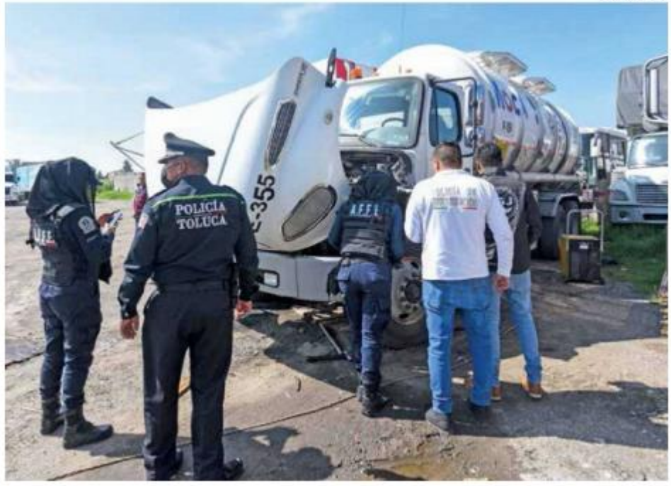
INSEGURIDAD. México necesita modificar leyes que den certidumbre legal a inversionistas.