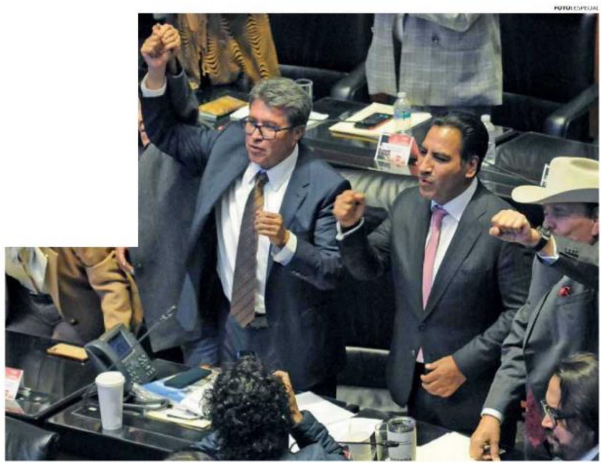
• COMETIDO. Los senadores Ricardo Monreal, Eduardo Ramírez y Armando Guadiana festejan luego de la votación a favor del dictamen.