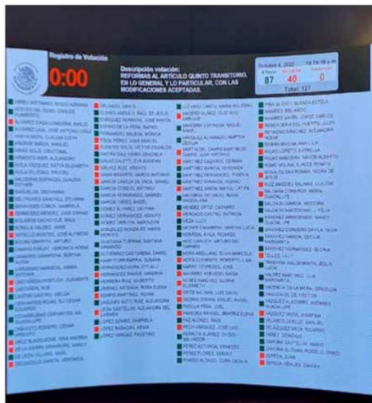
El tablero de votaciones muestra en verde los senadores que aprobaron la reforma y en rojo los que votaron en contra.

Al respecto, el presidente de la Junta de Coordinación Política del Senado, Ricardo Monreal Ávila, señaló: "Hemos aprobado una modificación muy importante, donde el Congreso mexicano se convierte en vigilante, frente al cual se van a rendir cuentas y se constituye como un órgano de control parlamentario que dará frutos a nuestra sociedad".