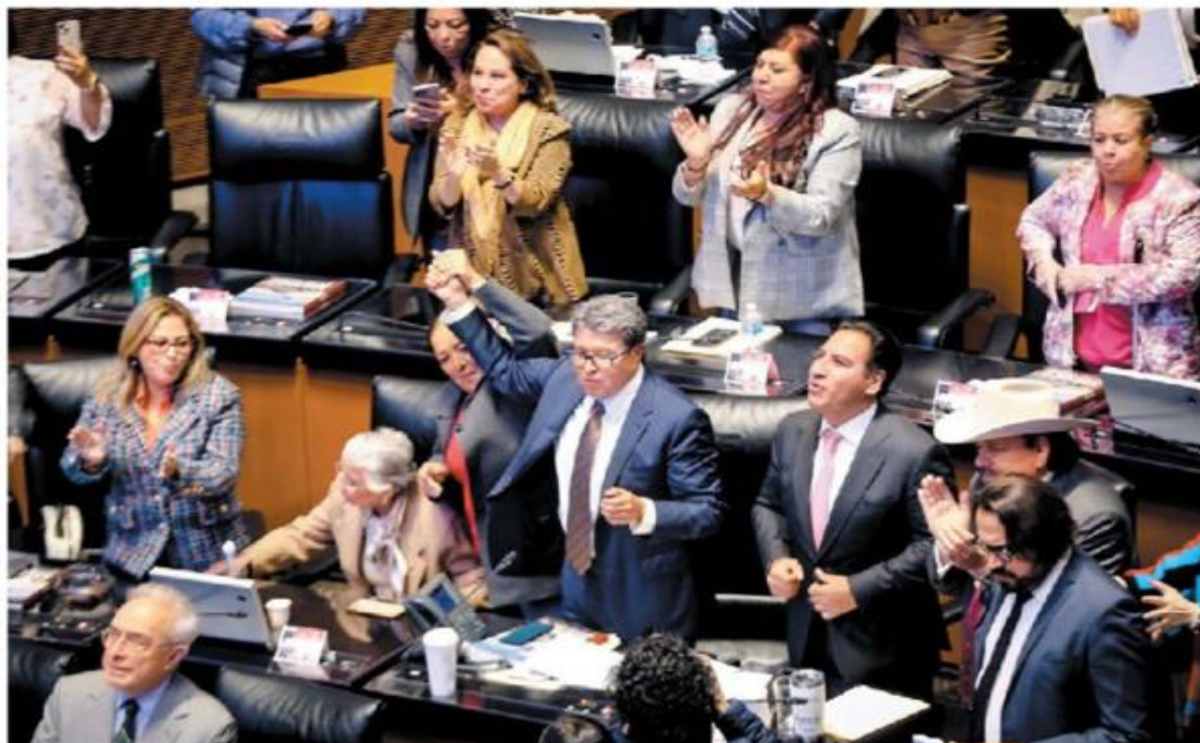
El coordinador morenista celebró el dictamen. ARACELI LÓPEZ