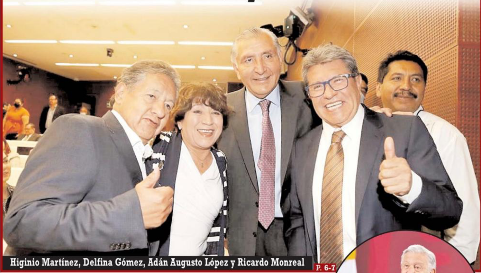
Higinio Martínez, Delfina Gómez, Adán Augusto López y Ricardo Monreal