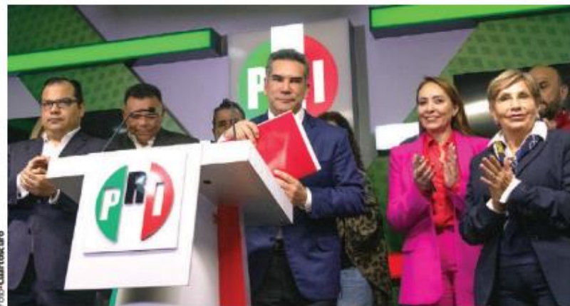
EL DIRIGENTE nacional del PRI, en una conferencia en el CEN, el 27 de septiembre.

LA GOBERNADORA de Campeche exhibe conversaciones en la que presuntamente el líder del PRI regaló autos; pide al INE revisar gastos del partido en las elecciones de 2021