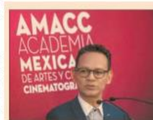
La Academia Mexicana de Artes y Ciencias Cinematográficas reportó ingresos por donativos de 4.6 mdp.

Si bien la declaración final de la cumbre Mondiacult, a la que México suscribe, no aborda la política fiscal de manera explícita, la convicción para "una mayor transversalidad" de las políticas culturales deberá comprender este aspecto.