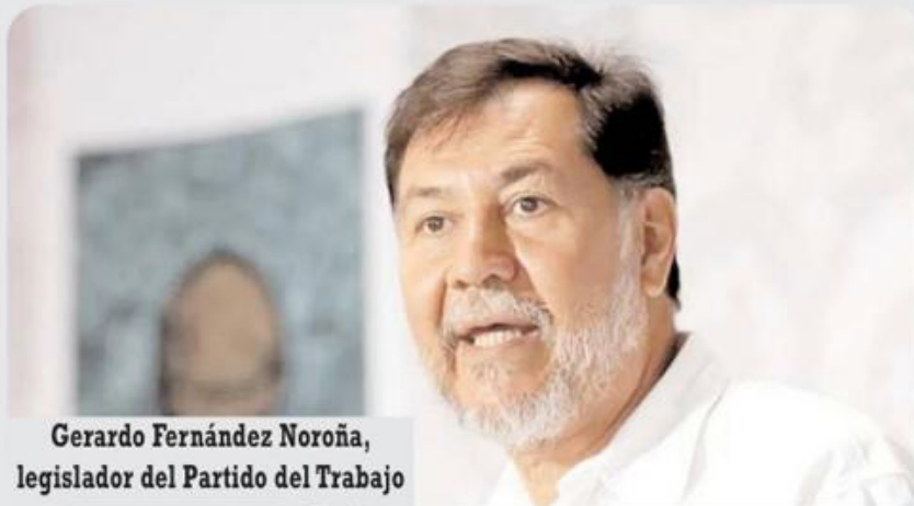
Gerardo Fernández Noroña, legislador del Partido del Trabajo