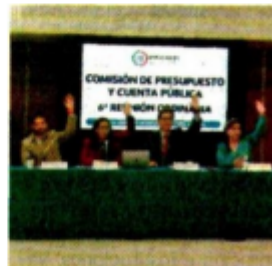
Con 27 votos a favor de Morena y aliados se avaló la iniciativa del Ejecutivo.