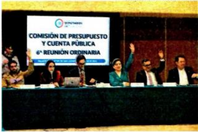
La Comisión desechó una reserva del PAN