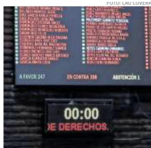
El tablero electrónico en San Lázaro.