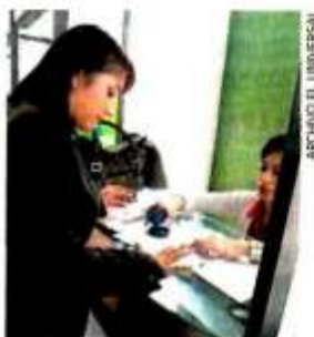
Por trámites, durante 2023 se prevé captar 57 mil mdp.

Además, se autorizó un nuevo esquema para el cobro del derecho por el uso del espectro radioeléctrico, el cual se pagará de forma anual, por cada enlace y megahertz concesionado. ●