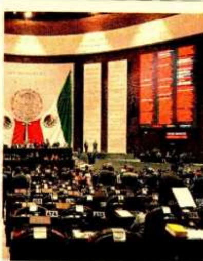
La LIF 2023 se aprobó con 266 votos a favor, 212 en contra y cero abstenciones.