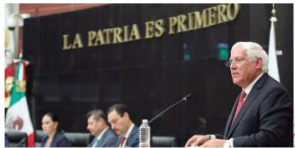
VÍCTOR VILLALOBOS, titular de la Sader, durante su comparecencia en el Senado, ayer.

"Se analizó la situación específica de Segalmex, Diconsa y Liconsa; y hoy día, a través de la acción que hemos llevado