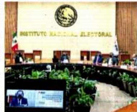
El Consejo General del INE lo integran 11 miembros.