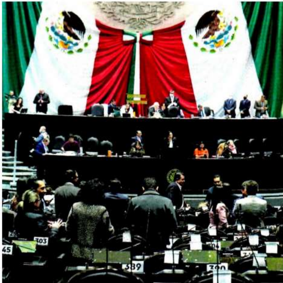
El dictamen recibió 266 votos a favor por parte de Morena, PVEM y PT, así como 212 sufragios en contra del PAN, PRI, PRD y MC, además de cero abstenciones.