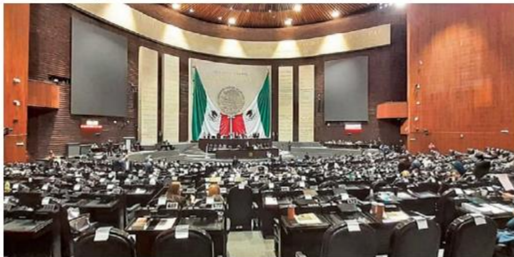
JORNADA. Los diputados tuvieron una sesión maratónica, la cual comenzó pasadas las 10 de la mañana, y en la que también hubo efemérides y se avaló también la Ley Federal de Derechos.

“Esta Ley es responsable y realista, reactiva la actividad económica, pero sobre todo genera mejores condiciones de ingreso para nuestro país (...) mantiene la disciplina fiscal, que ha definido a este Gobierno y cumple con no incrementar ni crear nuevos impuestos”, dijo el morenista. Hasta el cierre de esta edición continuaban con la discusión de las reservas al dictamen, de las cuales se esperaba que se aprobaran: un cambio en el ISR para libros y que 14 municipios de la frontera norte inscritos en el programa de regularización de autos ilegales reciban 800 millones de pesos para reparación y mantenimiento de vialidades.