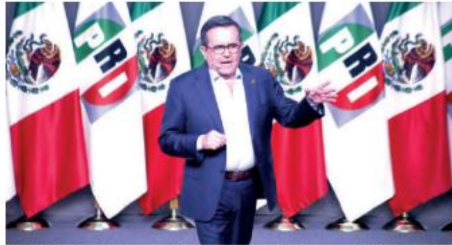
EL DIPUTADO priista, durante el primer encuentro de Diálogos por México, el martes.

IG: No, se afecta todo, tu familia, tu futuro, o sea, un país que no logra que predomine el Estado de derecho y un control absoluto sobre su territorio, claramente está poniendo en juego todo lo que más amamos, nuestros seres queridos, y está poniendo en juego las