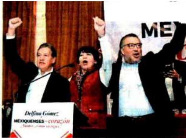
Higinio Martínez, Delfina Gómez y Horacio Duarte participaron en una asamblea con diputados federales y locales, y militantes.