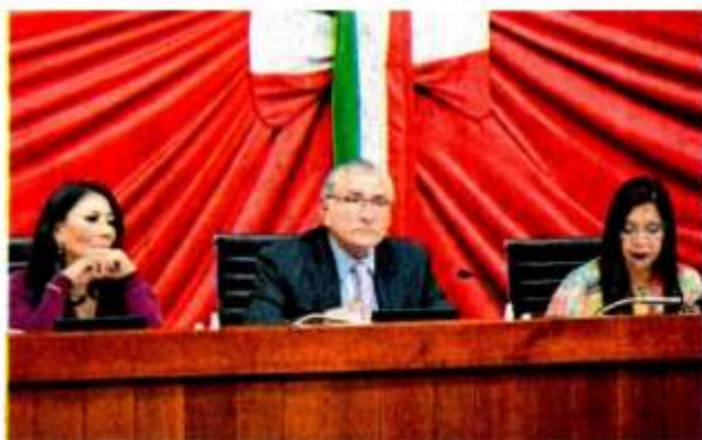
Adán Augusto López, titular de Gobernación, dijo en el Congreso de Tlaxcala que el Presidente le instruyó impulsar la reforma al Ejército.