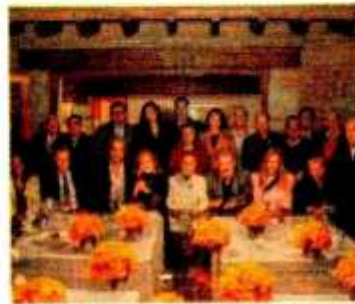
La Jefa de Gobierno de la capital hizo énfasis en la urgencia de incrementar el apoyo bancario a las MIPyMEs.