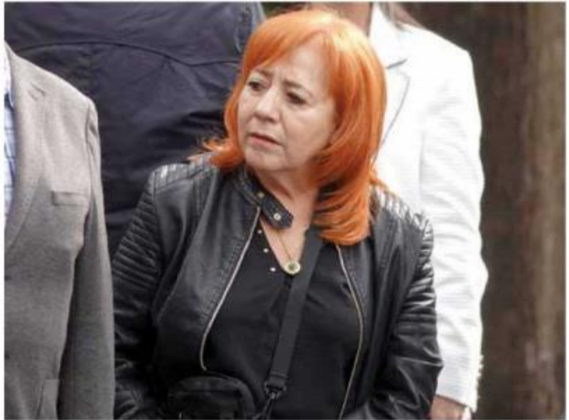
• IDEA. La titular de la Comisión Nacional de los Derechos Humanos, Rosario Piedra.