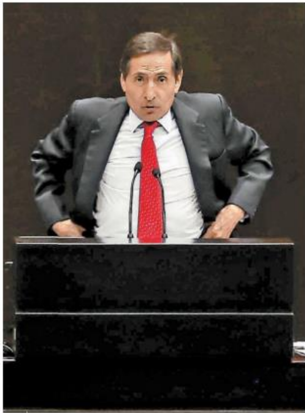
Rogelio Ramírez de la O, secretario de Hacienda.