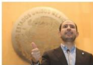
El dirigente blanquiazul aseguró que lucharán por frenar la reforma.

"No se trata de una simple discusión legislativa en el Congreso o de una iniciativa más, la democracia y el país entero están en riesgo, la Constitución se encuentra bajo una amenaza emprendida desde Palacio Nacional. Así como el presidente López Obrador ha atacado, acabado y destruido importantes programas sociales, desaparecido obras que beneficiarían a los mexicanos, ahora con esa misma lógica destructiva va contra los órganos autónomos para desaparecerlos o controlarlos", advirtió el presidente del PAN, partido señalado por Morena de incurrir en fraude electoral en los comicios de 2006 en el que Felipe Calderón Hinojosa fue declarado presidente de la República. ●