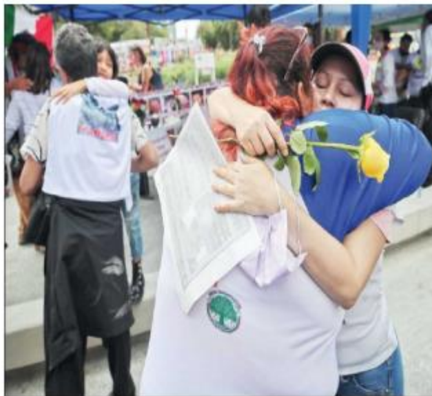
▲ La Auditoría Superior de la Federación hizo la segunda entrega de su informe de la cuenta pública 2021 con apuntes alusivos a la gestión de la CNB. En la imagen, una reunión de familiares de personas desaparecidas en septiembre pasado.