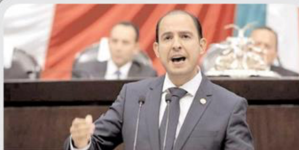
Marko Cortés, dirigente nacional del PAN