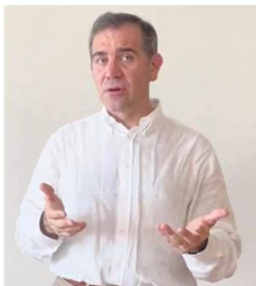
LAMADO. El consejero presidente del INE, Lorenzo Córdova, ayer.

Por lo tanto, se concluye que, de avanzar esta propuesta, se abriría un camino incierto para otras instituciones del Estado, pues el mismo argumento democrático se podría proponer en órganos técnicos como el Banco de México, el Instituto Nacional de Estadística y Geografía o el Instituto Federal de Telecomunicaciones, "poniendo en riesgo la estabilidad económica y política del país".