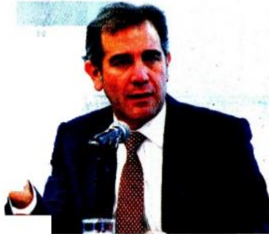
Lorenzo Córdoba ofreció ayudar al Congreso.