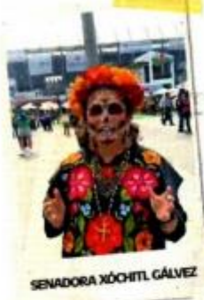
SENADORA XÓCHITL GÁLVEZ

En redes sociales, personalidades de la política nacional externaron su apoyo al piloto