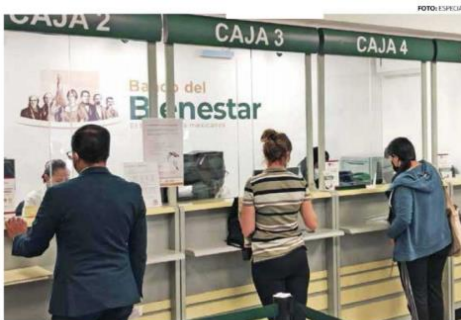
» REVISIÓN. En construcción y equipamiento de las instituciones, algunas de las observaciones.