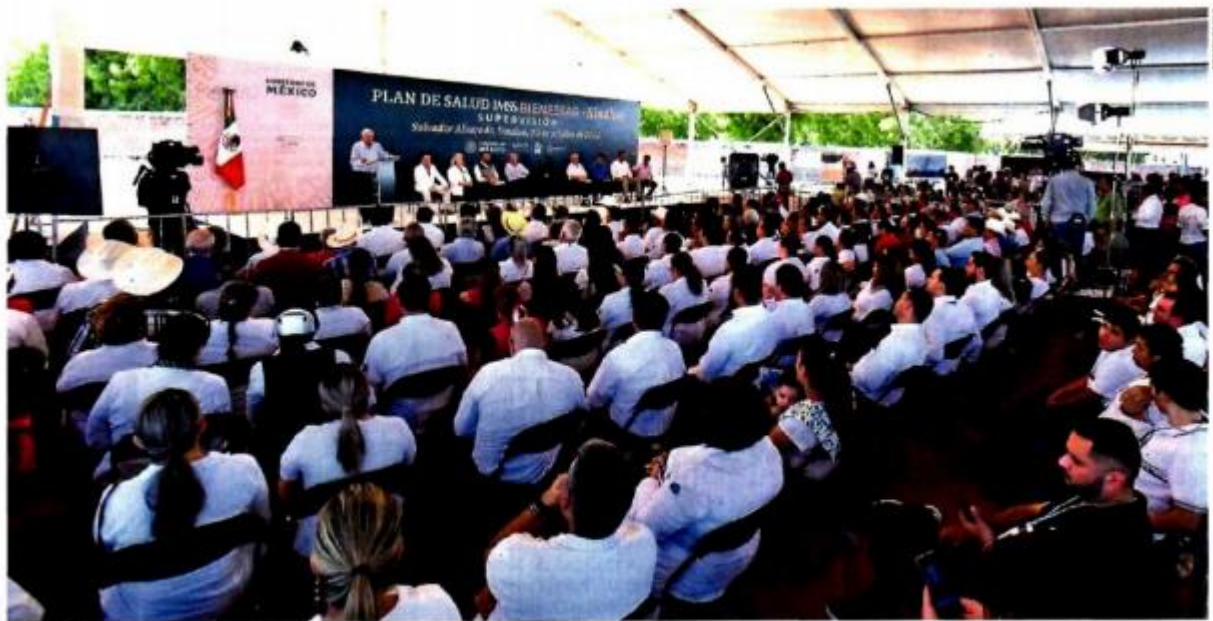
El presidente Andrés Manuel López Obrador supervisó los avances de la implementación del Plan de Salud IMSS-Bienestar en Sinaloa.

AUMENTARÁ la pensión para los adultos mayores a partir de enero del próximo año, aseguró el Presidente.