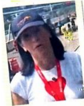
ALCALDESA LÍA LIMÓN