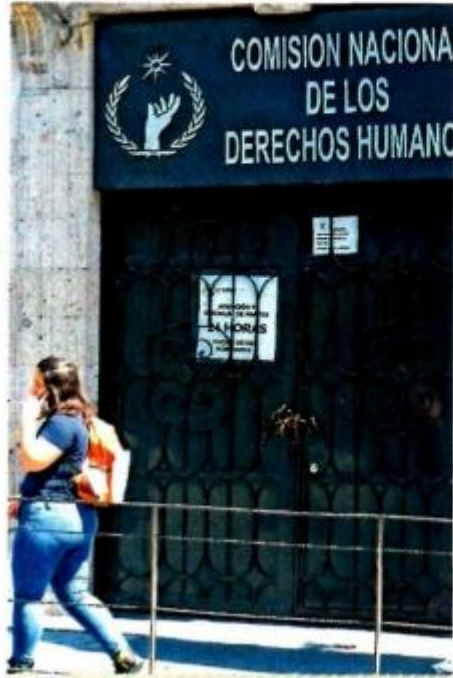
COMISIÓN NACIONAL DE LOS DERECHOS HUMANOS

llamado público, respetuoso, a los legisladores de la República para que, tomando como referente las luchas democráticas, revisen la legislación electoral vigente...”, consideró. ●