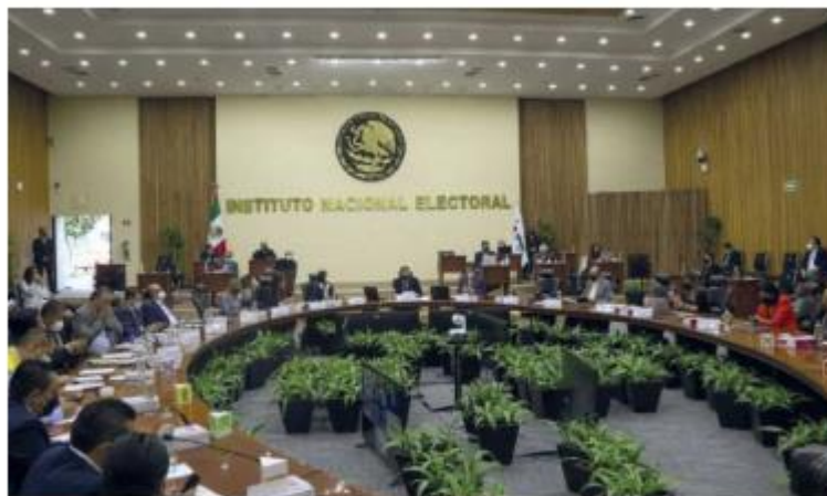
La CNDH propuso que los consejeros fueran electos popularmente.