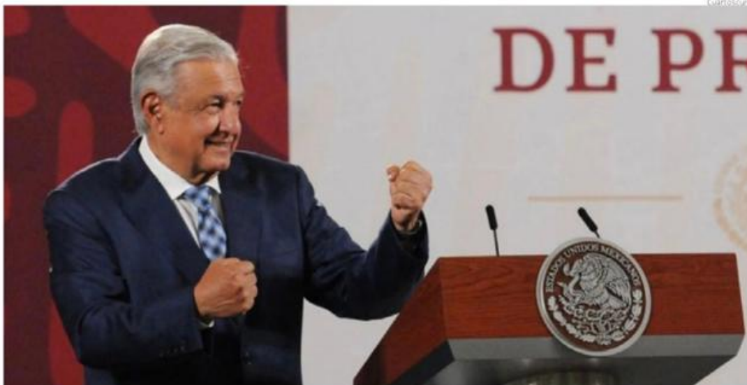
La iniciativa presidencial inauguraría un camino incierto para otras instituciones, como el Banco de México, IFT, INEGI e INAI, entre otros.

La propuesta de AMLO para elegir consejeros mediante voto popular es onerosa, contrario al principio de austeridad: Senado