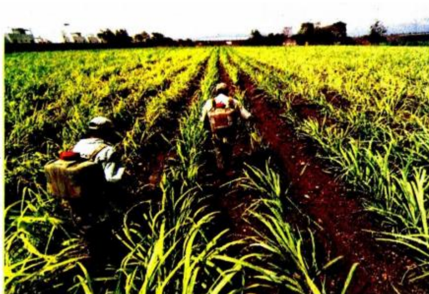
El uso de plaguicidas y fertilizantes está relacionado con el cáncer, según senadores.