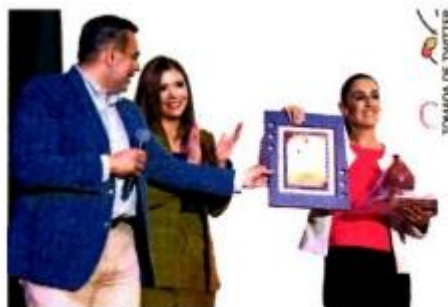
Claudia Sheinbaum impartió la clase magistral Experiencias Exitosas de Gobierno en Juárez.

El alcalde agregó que ante este panorama están listos para defender a la 4T. ●