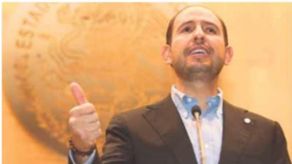
POSTURA. El líder nacional del PAN, Marko Cortés.