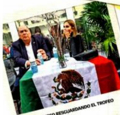
PAPÁ DE CHECO RESGUARDANDO EL TROFEO