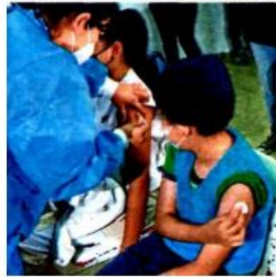
Jornada de vacunación para niños

Herrera Anzaldo destacó las solicitudes para diversos programas que requieren atención como Estancias infantiles, el programa