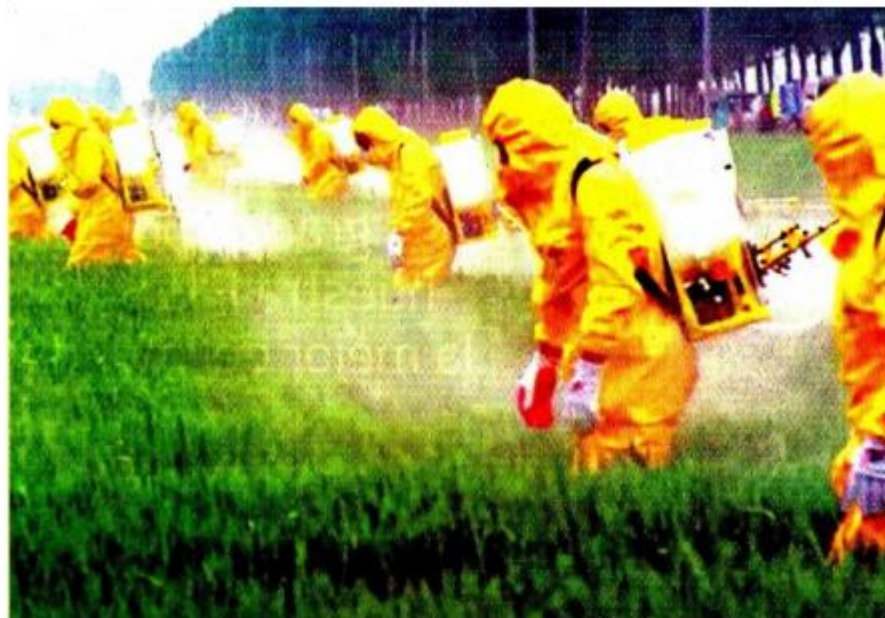
Productores dijeron que la regulación de los plaguicidas debe basarse en evidencia científica y no en función de prejuicios, porque es demasiado lo que está en juego en el país.