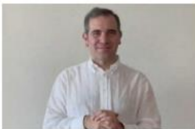
Córdova señaló que el INE cuenta con prestigio Internacional Especial