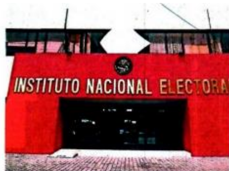
Instituto Belisario Domínguez pondera la autonomía, ciudadanización y profesionalización de las autoridades electorales.

"[Sanción de normas electorales se transformaría] en una cuestión de popularidad sujeta a los humores y vaivenes de la competencia política"