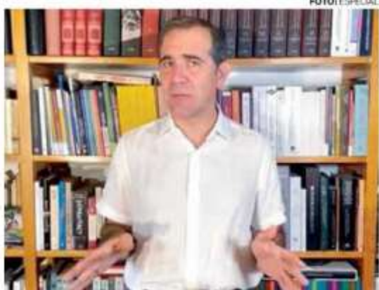
• META. El presidente del INE dijo que su objetivo es defender los derechos políticos de los ciudadanos .