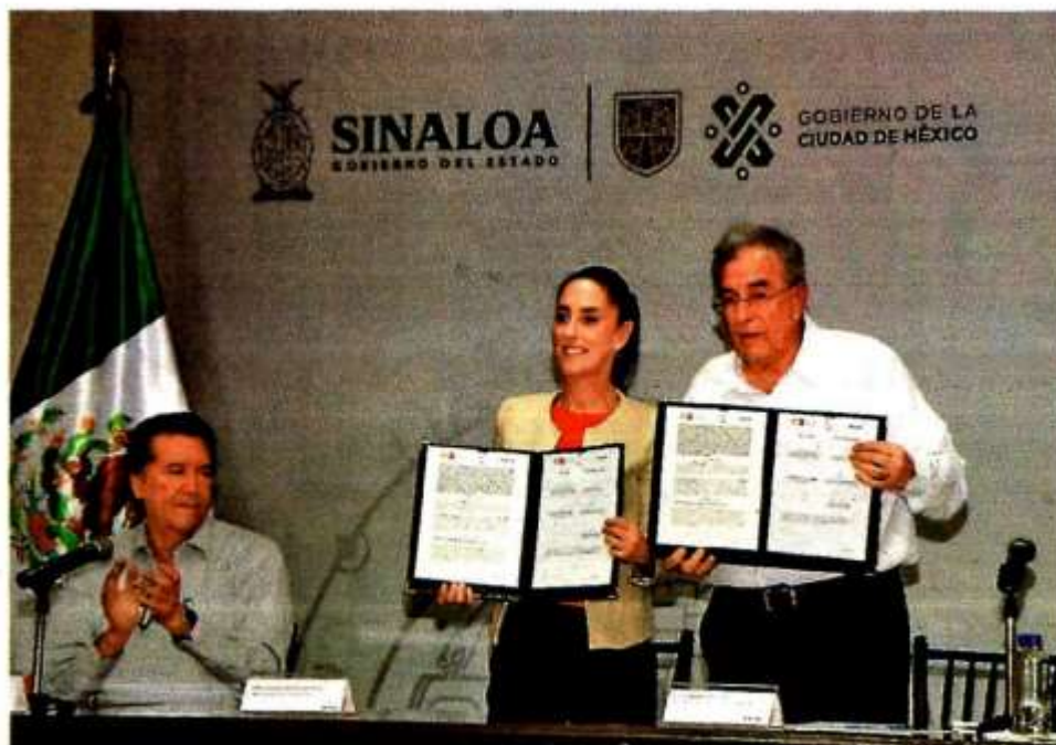
La mandataria capitalina y el gobernador sinaloense. ESPECIAL