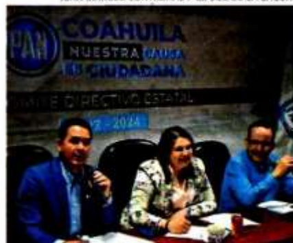
EL PAN de Coahuila en asamblea local