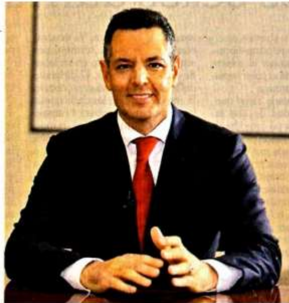
■ Alejandro Murat, Gobernador de Oaxaca.