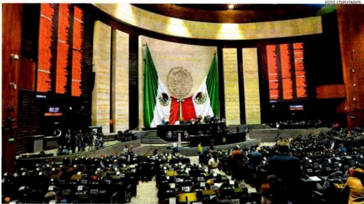
A partir de este lunes se debate el Presupuesto 2023 en la Cámara de Diputados.

POR CIENTO o más de ingresos recibirán los estados y municipios el próximo año, de acuerdo con la Cámara de Diputados