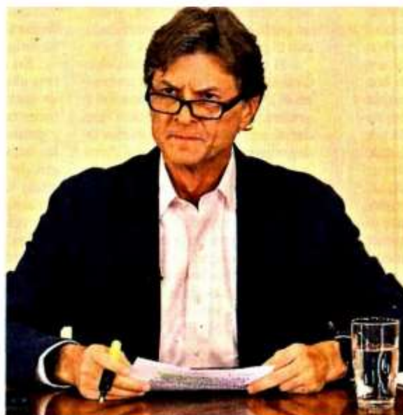
■ Enrique de la Madrid, ex Secretario de Turismo.