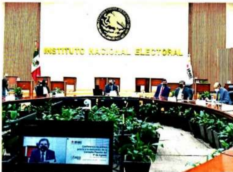
Los descuentos al presupuesto del INE derivan en afectaciones a las actividades operativa y funciones sustantivas del órgano que prepara los procesos electorales en el país.