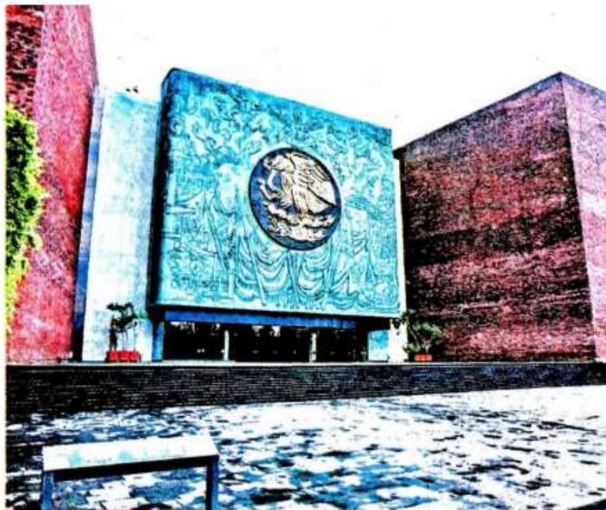
La Cámara de Diputados visibiliza la violencia contra mujeres.