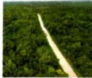
La construcción de la obra contará con más de 143 mmdp.

Recibirá 94% de la bolsa de fondos para turismo de 2023