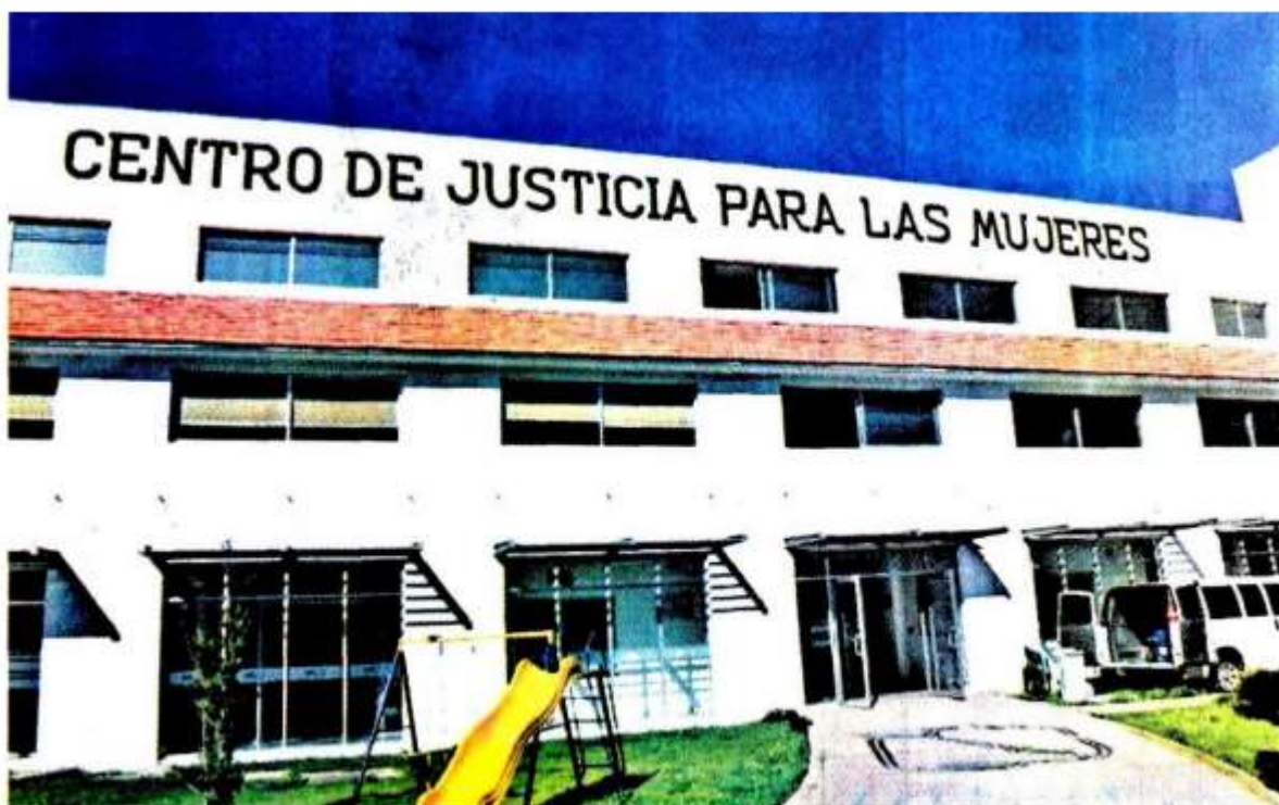
En este sexenio se ha dado atención a 1.2 millones de mujeres en 60 Centros de Justicia para la Mujer (Cejum).