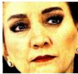
Claudia Ruíz Massieu

/// Tenemos que reconciliarnos como mexicanos, después de cuatro años de polarización alentada desde el Gobierno”.