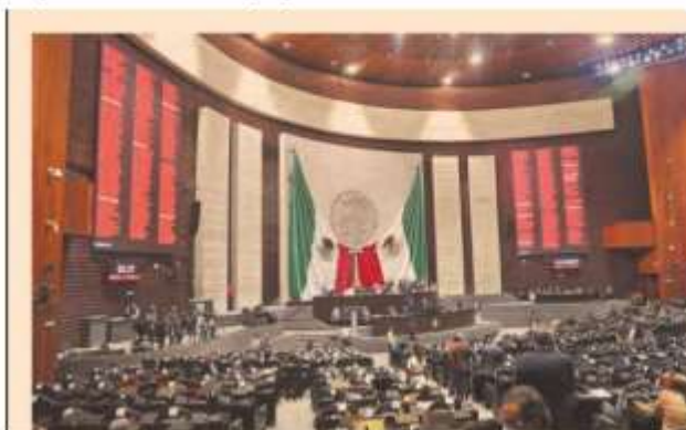
La Cámara de Diputados avaló, con 264 votos a favor, 217 en contra y una abstención las modificaciones a la LFPRH.

La minuta aprobada por San Lázaro fue turnada al Senado de la República, para la propia revisión, análisis y discusión. (Con información de Santiago Nolasco).