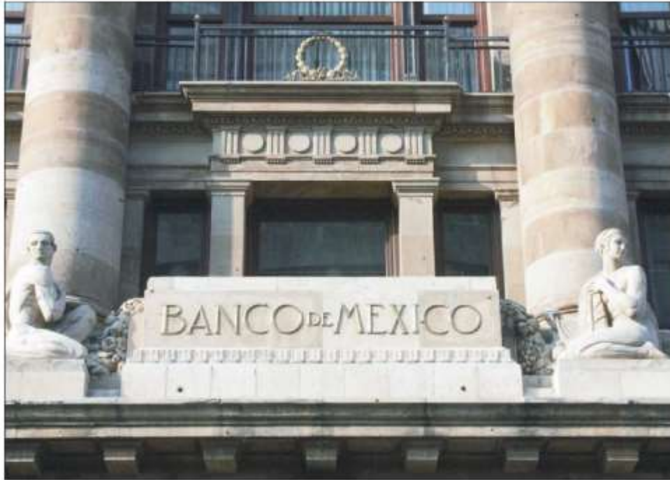
▲ A causa de la incertidumbre internacional, la tasa de referencia del BdeM ha pasado de 4 a 9.25%.