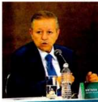
Zaldívar. Sin definirse de manera uniforme el tipo penal.