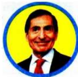
Rogelio Ramírez de la O, secretario de Hacienda.