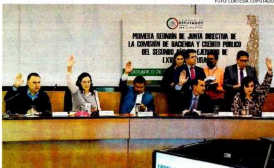
El debate se extenderá toda la semana.