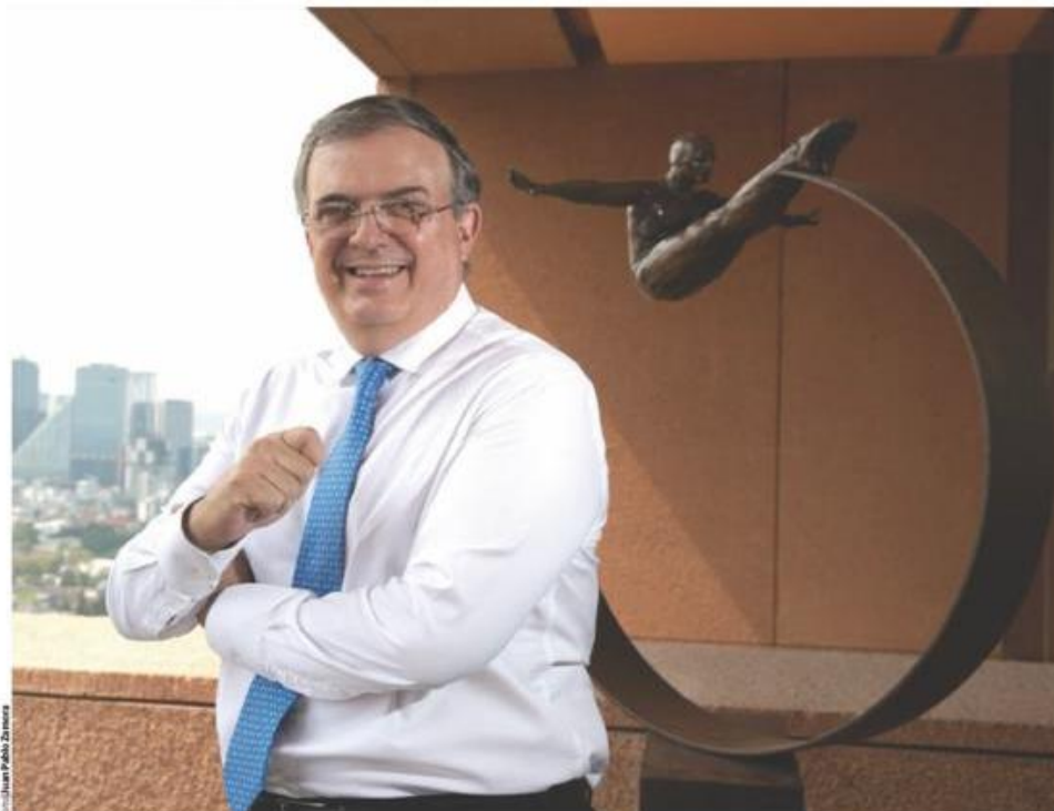
EL TITULAR de la Secretaría de Relaciones Exteriores, Marcelo Ebrard Casaubón, tras la entrevista con La Razón .

Creo que él ha seguido una política congruente. En pocas palabras el Presidente ha renunciado al dedazo. ¿Qué otra contribución podemos pedir? Ahora, ¿a quiénes les corresponden otras responsabilidades?