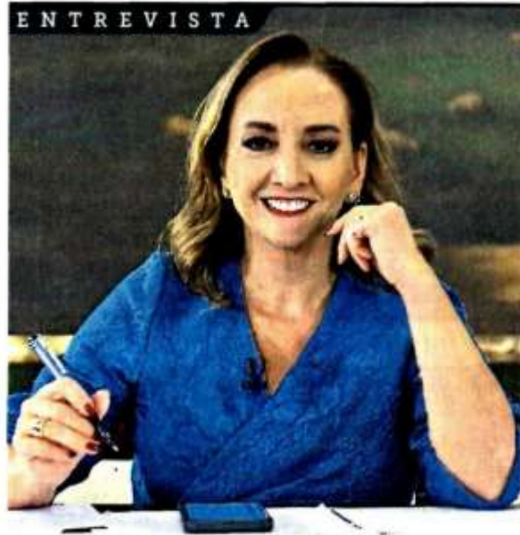
■ Claudia Ruiz Massieu, senadora.

/// ¿Hay seguridad? La respuesta es clara: no la tenemos. Para poder crear cualquier cosa, México necesita tener seguridad”.