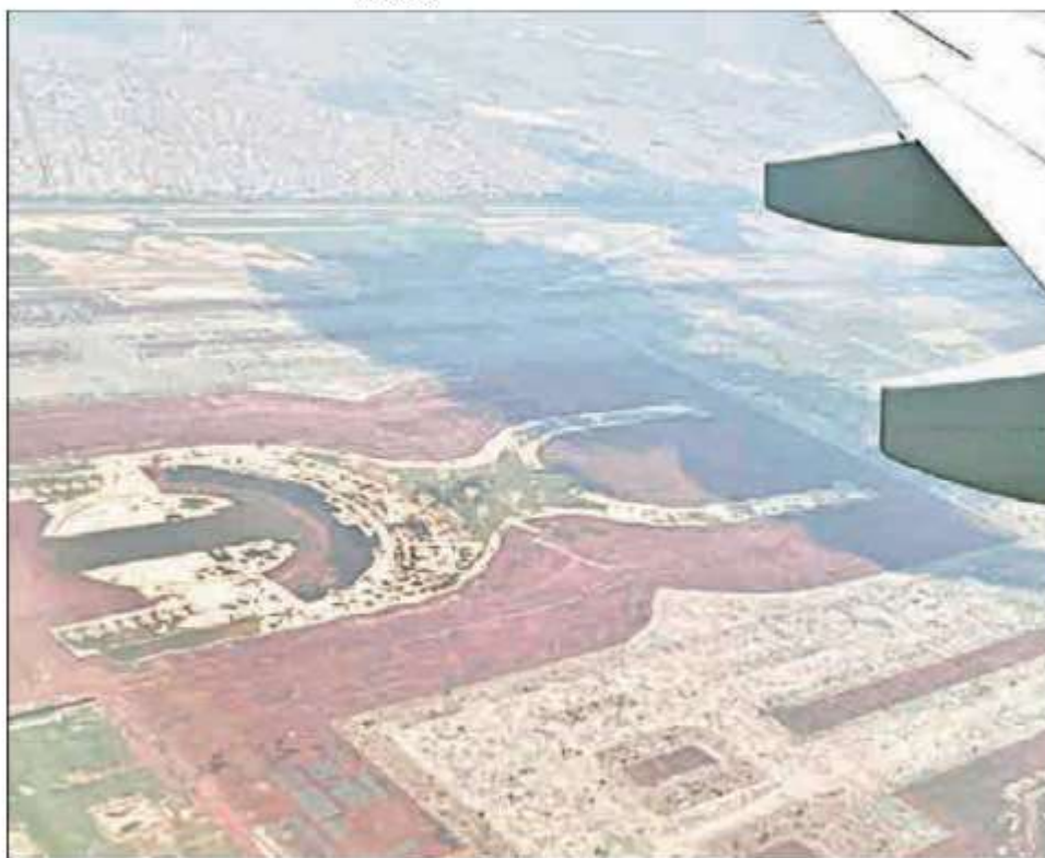
Los créditos solicitados por el gobierno para el NAIM sumaban 6 mil millones de dólares en bonos en 2018.

forma anticipada, además de responder por las compensaciones generadas de los procesos legales. Por él pasaron 132 mil 660 millones de pesos provenientes de la deuda contratada a través del 80460 y 33 mil 113 millones de pesos de fuentes fiscales.