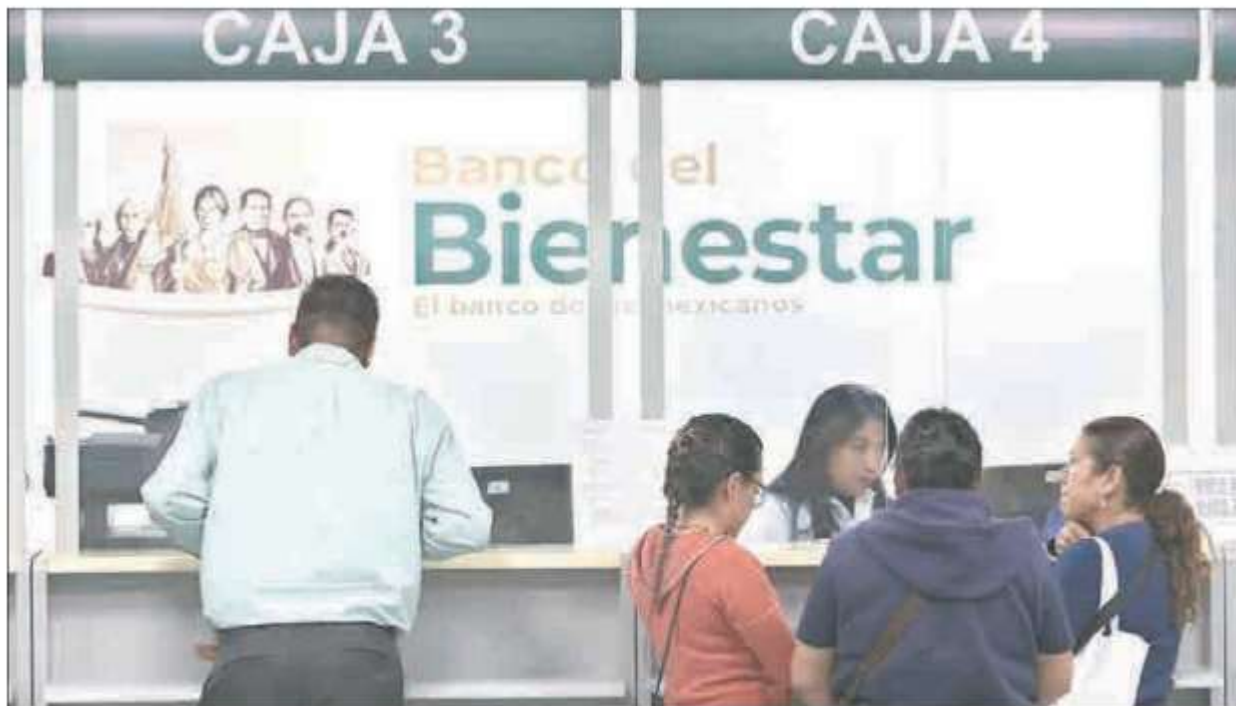
▲ La propuesta es reasignar los recursos a programas sociales como el de pensiones para adultos mayores.

Los diputados federales también perfilan mantener los montos que se establecieron en la propuesta original de PEF 2023 para seguridad, salud y educación. Ante las reservas que anticiparon las bancadas de oposición, se prevé que su discusión en el pleno podría requerir al menos un par de días.