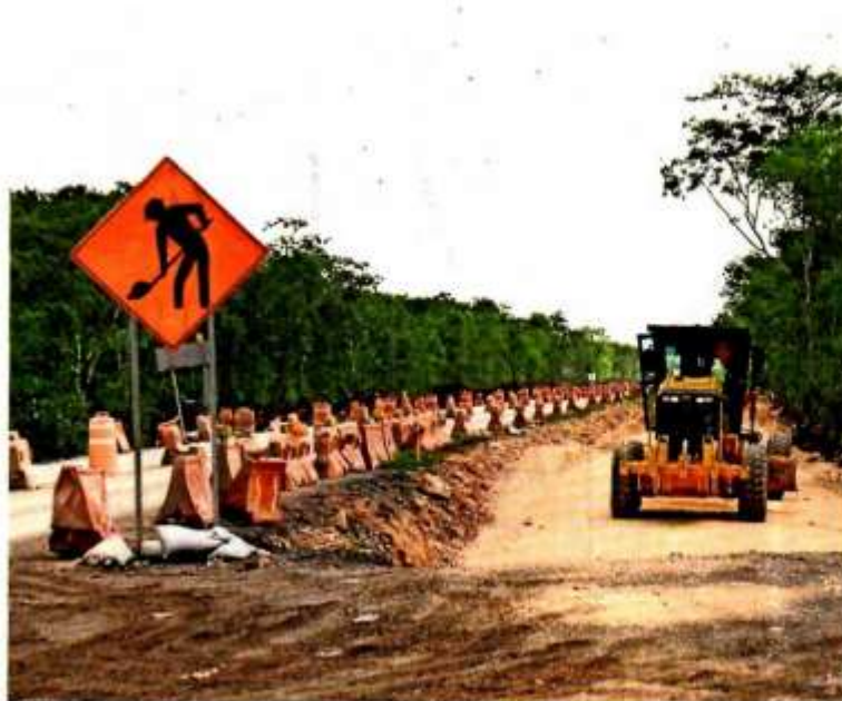
Los 145 mil mdp que irán al Fondo Nacional de Fomento al Turismo serán para proyectos de transporte masivo de pasajeros.

MDP SE DESTINARÁN al Complejo Cultural Bosque de Chapultepec, pero no se asignaron.