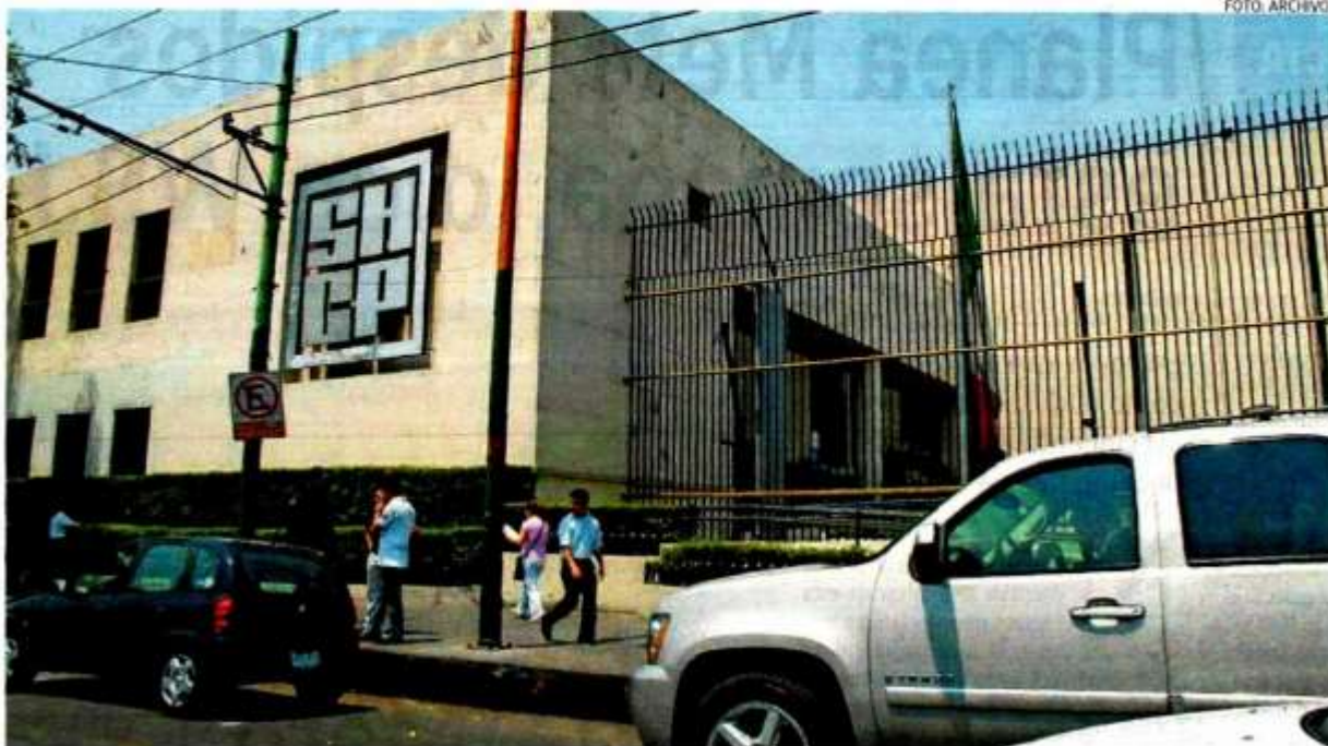
Insiste Hacienda que el gobierno no tomará activos que no corresponden.

La dependencia dijo que la reforma no está relacionada con el gasto público, "como algunos han interpretado erróneamente"