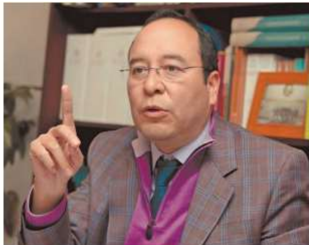
El consejero alertó también que la elección de funcionarios electorales a través del voto directo impactaría en la autonomía.

Morena y sus aliados en la Cámara de Diputados buscan que la reforma se discuta antes de que termine el periodo ordinario de sesiones, el próximo 15 de noviembre.