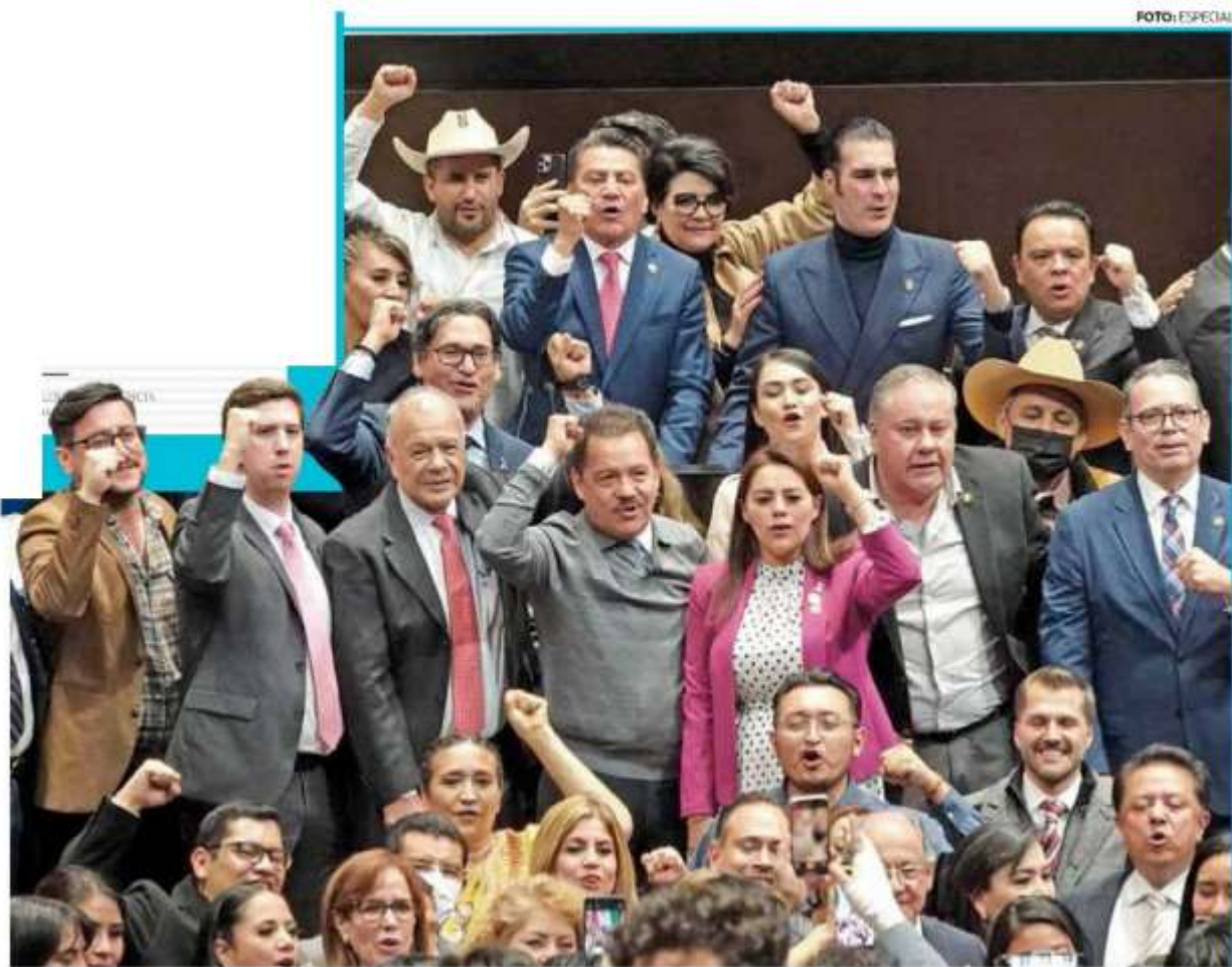
• DEBATE. La fracción parlamentaria de Morena en la Cámara de Diputados prevé empezar el análisis del dictamen este lunes.