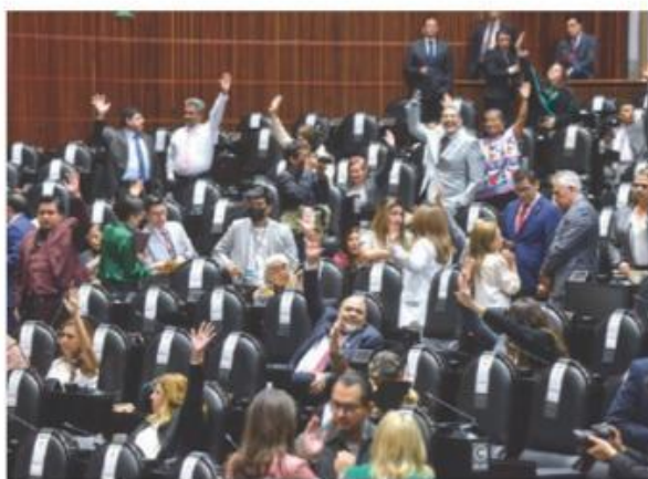
DIPUTADOS de Morena, durante la votación referente al monto de los presupuestos incluidos en el PEF 2023, el 28 de septiembre.