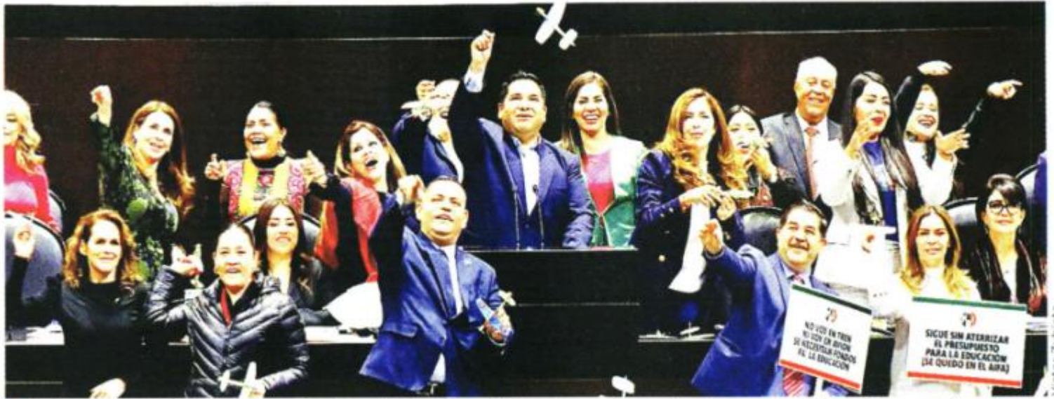
Los diputados del PRI cuestionaron la asignación de las partidas más cuantiosas a las obras prioritaria del Gobierno: Tren Maya, refinería de Dos Bocas y el Aeropuerto Felipe Ángeles.