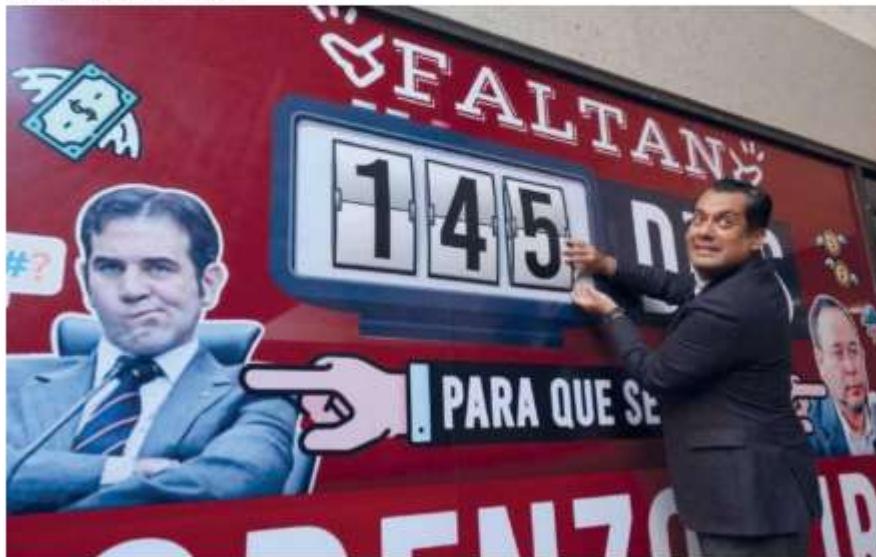
El morenista inauguró el contador en la Cámara de Diputados.

“La Presidencia de la Cámara de Diputados informa que escuchando con pluralidad, apertura y buena fe, ha decidido tomar todas las acciones jurídicas a su alcance, para efecto de que no continúen las indagatorias penales en contra de funcionarios del INE”, mencionó. •