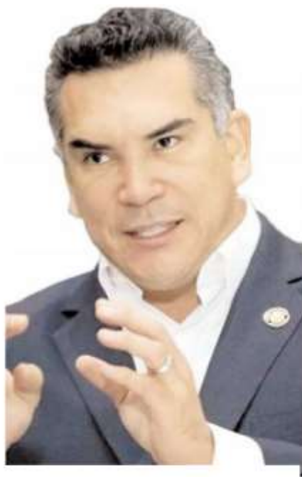
Alejandro "Alito" Moreno Cárdenas