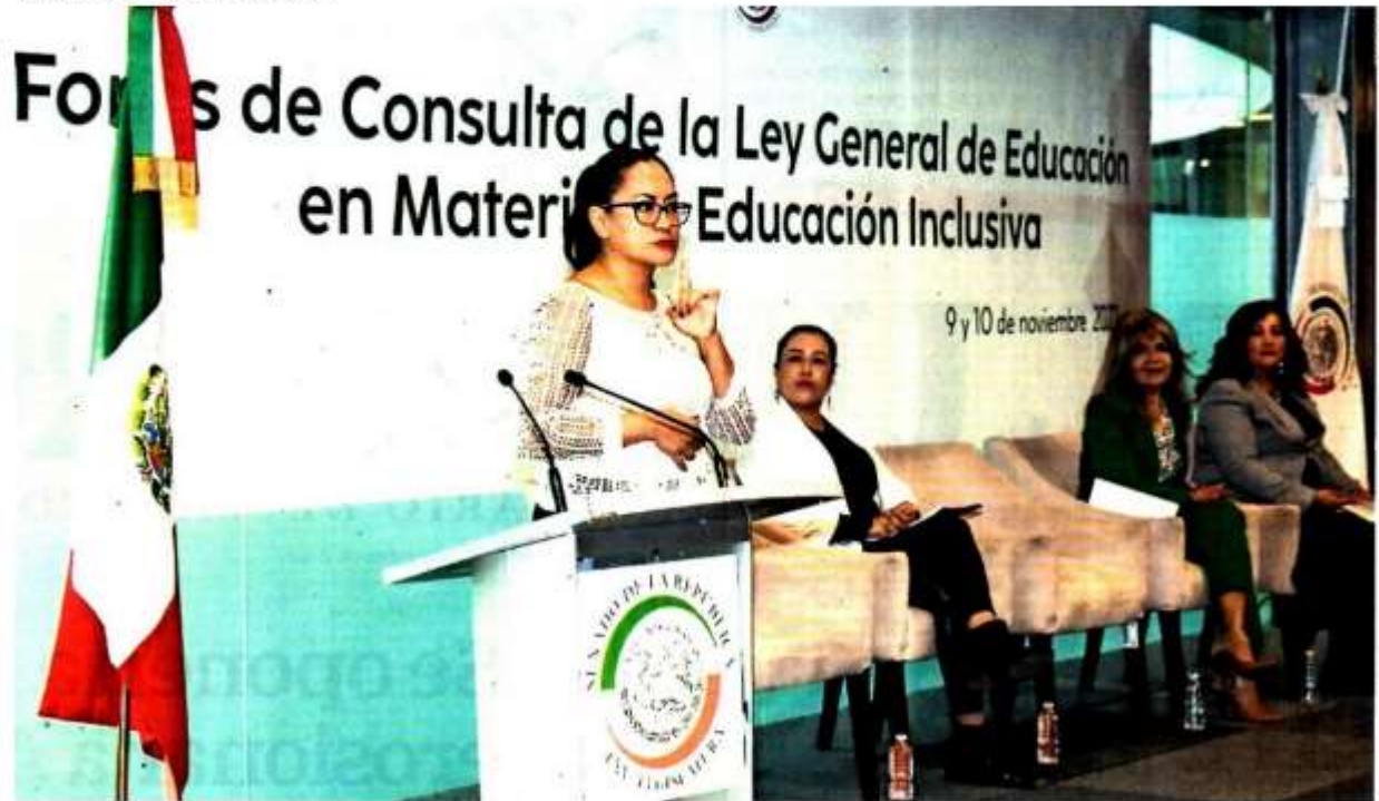
En el Senado se llevaron a cabo los foros en materia de educación Inclusiva con ponencias de docentes, padres de familia y estudiantes.

con necesidades especiales se atendieron en el ciclo 2020-2021.