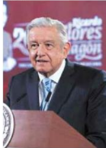
RESPUESTA. El presidente López Obrador, ayer, en su conferencia.

“También lo del INE es importante, o sea, se necesita presupuesto, no tanto”, aclaró.