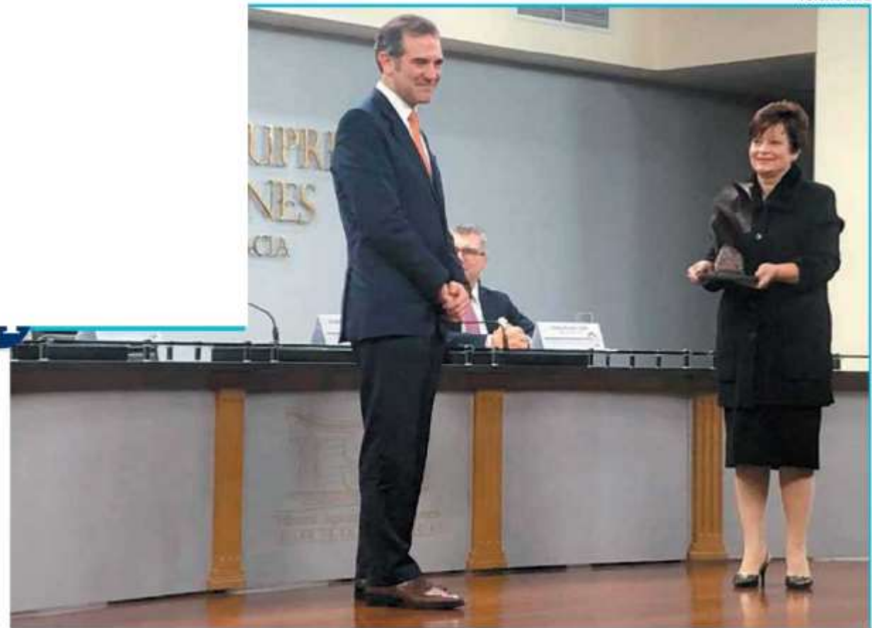
• GALARDÓN. El presidente del Instituto Electoral recibió un premio por parte del Tribunal Electoral de Costa Rica.