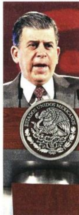
■ Ricardo Sheffield, titular de la Profeco.

Detalló que el capítulo 1000 Servicios Personales incluye dos componentes: total de conceptos salariales, con un monto de 833.5 millones de pesos, más el total de seguridad social y otras prestaciones por 134.5 millones de pesos, los cuales suman los 968.1 millones de pesos ejercidos en la cuenta pública 2021.