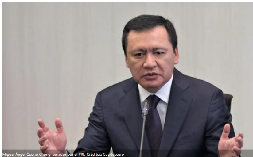
Miguel Ángel Osorio Chong, senador por el PRI.

Julen Rementería señaló que, de darse los resultados en el terreno legislativo, la coalición de fuerzas podría sostenerse en las contiendas electorales para obtener mejores resultados.