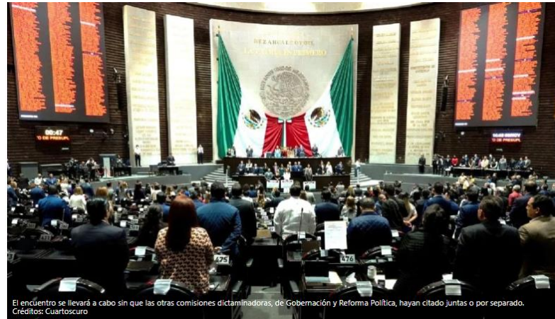
El encuentro se llevará a cabo sin que las otras comisiones dictaminadoras, de Gobernación y Reforma Política, hayan citado juntas o por separado.

CIUDAD DE MÉXICO (ANGÉLICA MELLÍN).- La Junta Directiva de la Comisión de Puntos Constitucionales de la Cámara de Diputados se reunirá, se prevé sea en privado, para declararse en sesión permanente, a fin de dar trámite a las iniciativas de reforma electoral que se analizan en conjunto con las comisiones de Gobernación y Reforma Política Electoral.