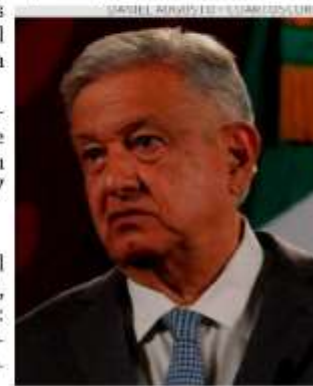
El Presidente anuncia su marcha.

"Son cuatro años de transformación. Para ver también si la gente está contenta con la transformación, o sea, si vamos bien. (Creo que) ya me estoy aburguesando mucho" •