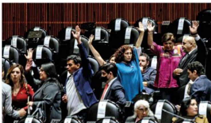
INICIATIVAS. Las reformas aprobadas se enviaron al Senado de la República, donde serán votadas.

“Este dictamen fortalece a la Ley Olimpia porque busca reconocer como violencia digital a aquellas sanciones de difusión o exhibición de contenido íntimo que no nece-