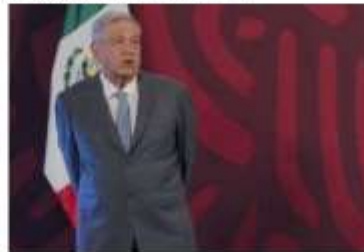
López Obrador llamó a los mexicanos a defender la democracia.

Señaló que hay quienes están diciendo que quiere controlar las instituciones y reelegirse, como lo apuntó el expresidente Fox Quesada durante la marcha, pese a que la iniciativa enviada no dice nada de eso y lo prohíbe el texto constitucional. ●