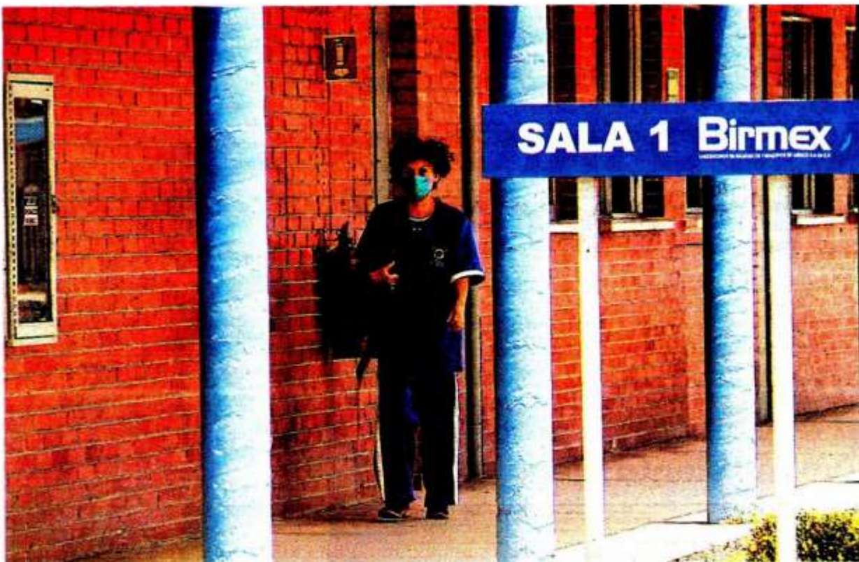
Laboratorios Biológicos y Reactivos de México desarrolla, produce, importa y comercializa vacunas y antivenenos. ARCHIVO

Supuestamente, presta un servicio para el cual no cumplió con los requisitos ni experiencia en una licitación del IMSS