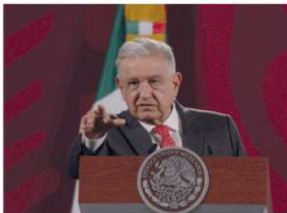
López Obrador arremetió de nueva cuenta contra el INE y opositores.

"Quieren seguir conservando los privilegios de la oligarquía, ese es el fondo del asunto y como esa oligarquía corrupta, racista, clasista, tiene el control de los medios de información hay todo un movimiento de desinformación", puntualizó el presidente de la República. ●