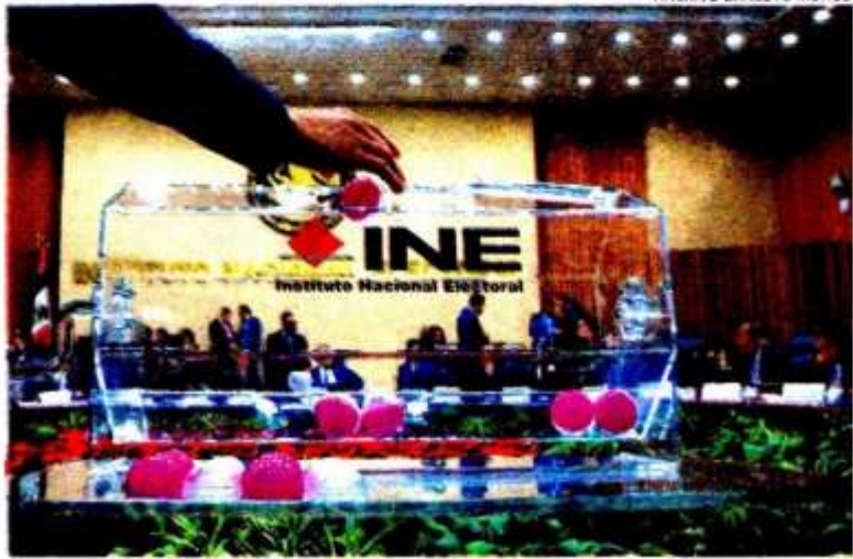
En abril de 2023, cuatro consejeros electorales dejan sus puestos