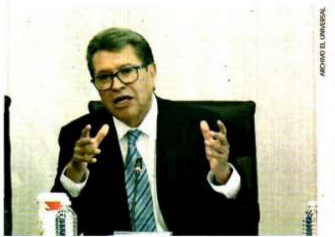
Ricardo Monreal, líder de Morena en el Senado, afirma que es muy complicado que una reforma a leyes altere el sistema de elecciones.