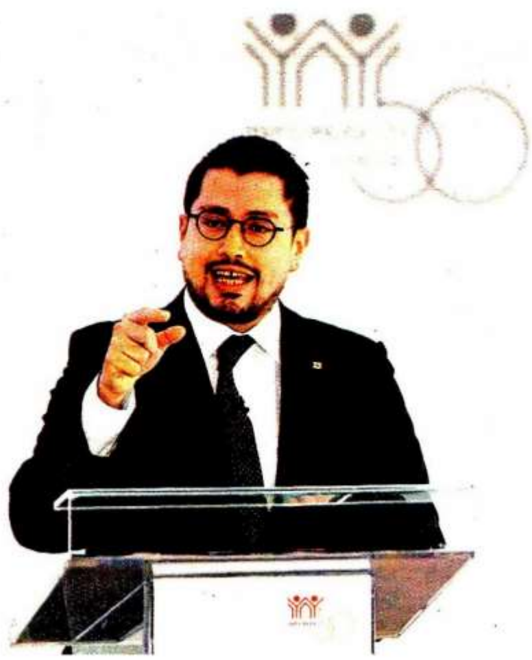
El director general del Infonavit en el foro de MILENIO. JORGE CARBALLO.