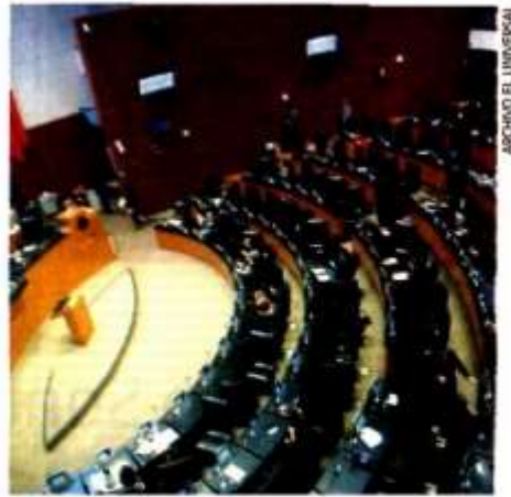
En la Legislatura pasada, Morena y sus aliados estuvieron muy cerca de tener la mayoría calificada en el Congreso, dicen expertos.