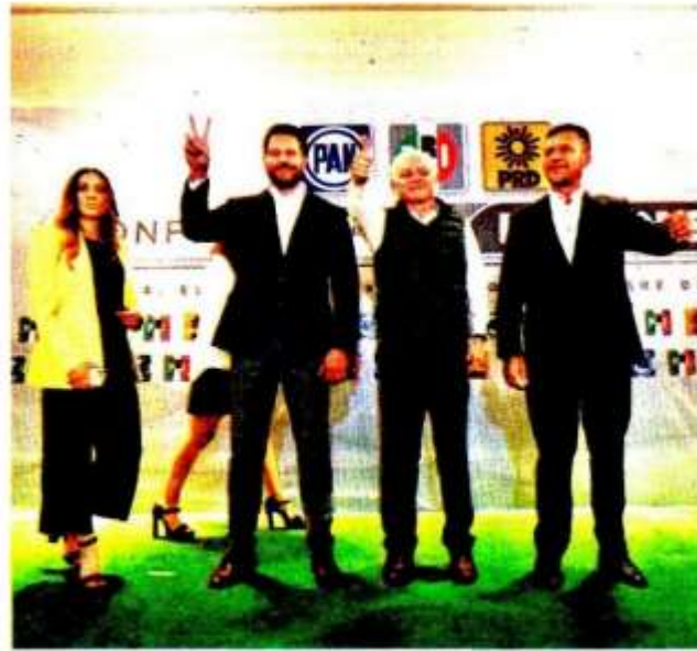
Los dirigentes estatales se reunieron ayer. TANIA CONTRERAS