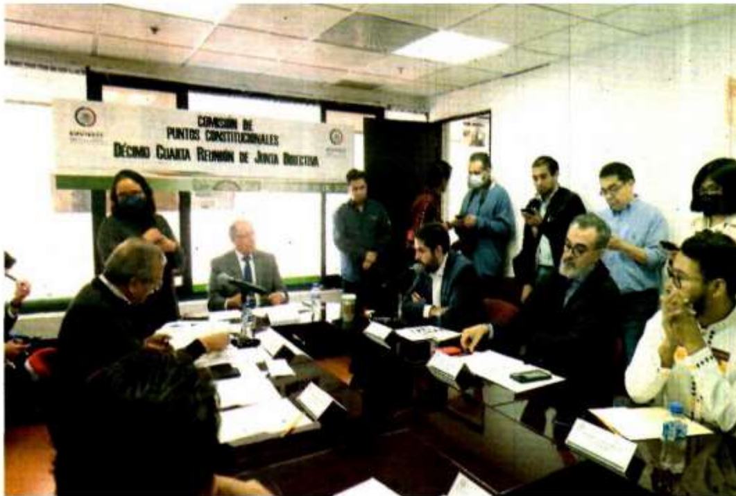
La Mesa Directiva de la Comisión de Puntos Constitucionales aprobó constituirse en reunión permanente.

DE NOVIEMBRE se prevé que circule el dictamen y que el 28 se vote en las comisiones.