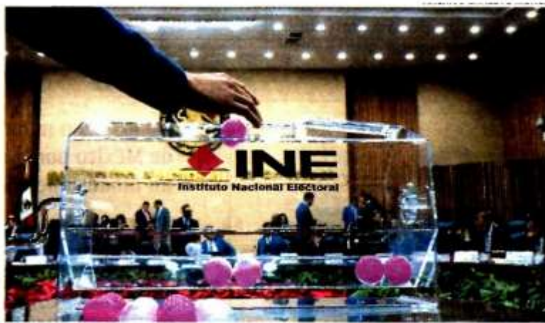
En abril de 2023, cuatro consejeros electorales dejan sus puestos