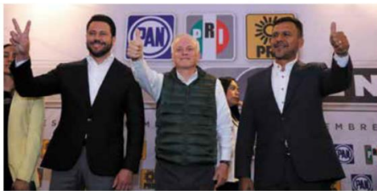
ENCUENTRO. Los líderes de PRI, PAN y PRD del Edomex se reunieron ayer.

Reconocieron que en sus partidos enfrentan "conflictos internos", pero