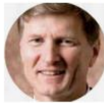
ENRIQUE DE LA MADRID

• El resultado de Zoé Robledo fue positivo. Anunció que amplió la cobertura del IMSS-Bienestar en Nayarit, Colima, Tlaxcala, Sonora, Baja California y Sinaloa. Generó 35% de su cobertura mediática. Para aplaudir, fue que, a partir de ahora, el IMSS garantiza el acceso a la seguridad social a las parejas del mismo sexo en relación de concubinatos. En su comparecencia en el Senado aseguró que el IMSS tiene finanzas sanas.