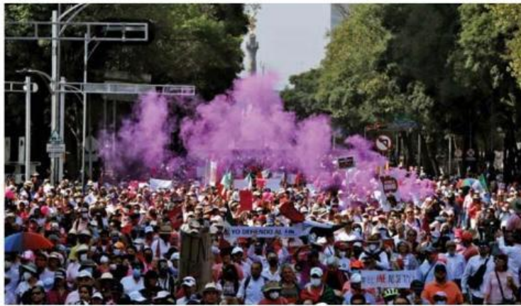
PROTESTA. El presidente López Obrador declaró que la gente que asistió a la marcha en defensa del INE, lo hizo por engaños.

“La marcha no es por lo de la reforma electoral, es para fortalecer el movimiento de transformación y celebrar los logros (...) vamos a seguir tratando este asunto, porque es mucho descaro que los representantes de la antidemocracia en México sean los que manejan el INE y además, el que hayan engañado a tanta gente de que iba a desaparecer el INE y que se hayan tragado el plato de mentiras y sin hacer gestos”, dijo.