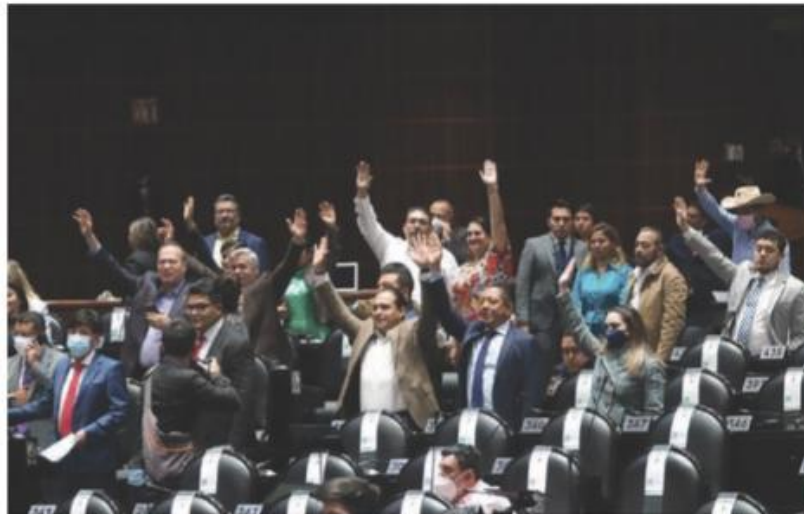
BANCADA de Morena en la Cámara de Diputados, el pasado 8 de noviembre.

Años, edad mínima para acceder a una diputación federal