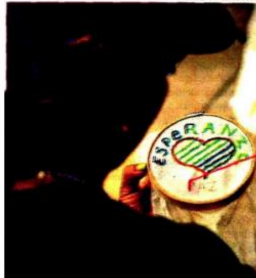
Firmeza en su posición.