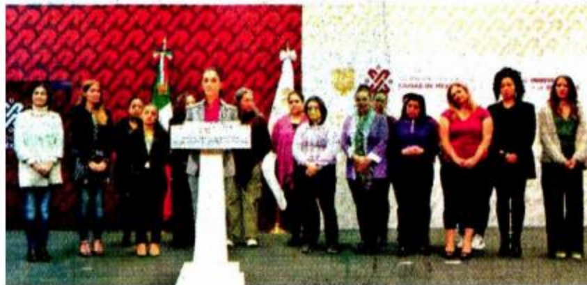
Sheinbaum recibió a funcionarias y mujeres de diversas organizaciones en el Antiguo Palacio del Ayuntamiento.