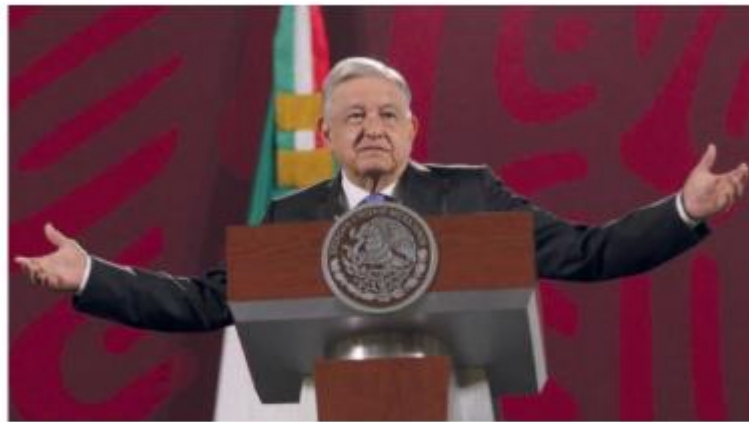
Dijo que su propuesta de reforma electoral no es antidemocrática.