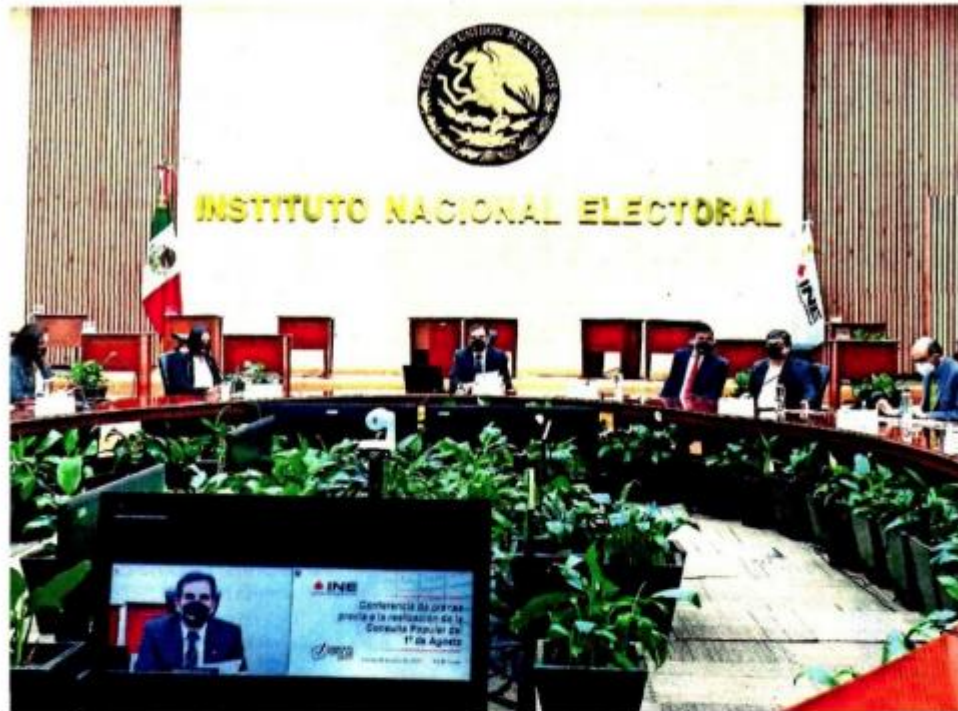
Diputados de Morena tienen 30 iniciativas como parte del plan B de la reforma electoral; una de ellas es prohibir a consejeros del INE contender por puestos públicos en los 10 años posteriores a su encargo.