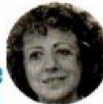
JACQUELINE PESCHARD Exconsejera electoral

"Es una reforma, en esa materia, que es de represalias, es de odio. Sabemos de las diferencias que el Presidente y el partido Morena han tenido con dos de los consejeros"