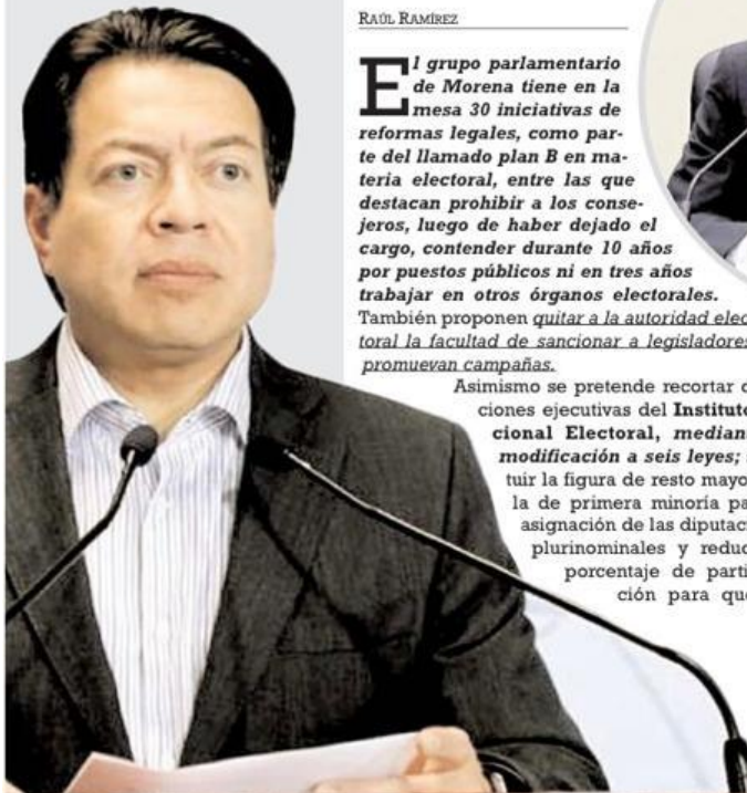
Mario Delgado Carrillo, presidente nacional de Morena

Asimismo se pretende recortar direcciones ejecutivas del Instituto Nacional Electoral, mediante la modificación a seis leyes; sustituir la figura de resto mayor por la de primera minoría para la asignación de las diputaciones plurinominales y reducir el porcentaje de participación para que las