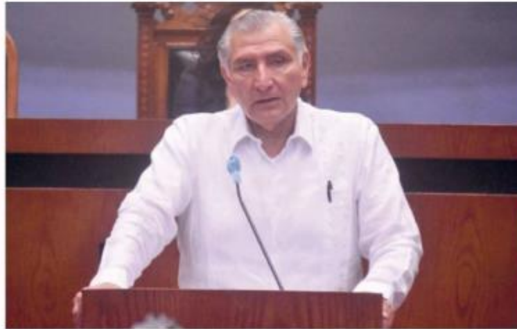
El funcionario pidió no llamar acarreados a asistentes de marcha de AMLO.

EL SECRETARIO indicó que miles de ciudadanos de Tabasco acudirán a la Ciudad de México para respaldar al presidente