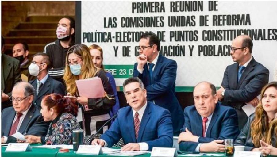
PETICIONES. Durante la sesión de las comisiones, diputados opositores declararon que no se votará a favor de la reforma presentada por Morena.