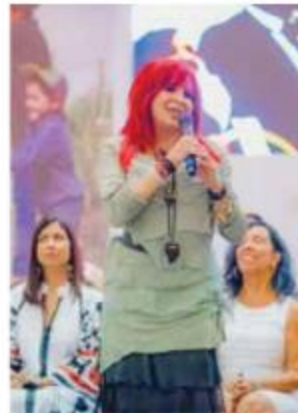
Foto: Tomada de Twitter Layda Sansores, gobernadora del estado de Campeche.

En consecuencia, la gobernadora tendrá que borrar de sus redes sociales los mensajes alusivos al tema, pedir una disculpa pública en el