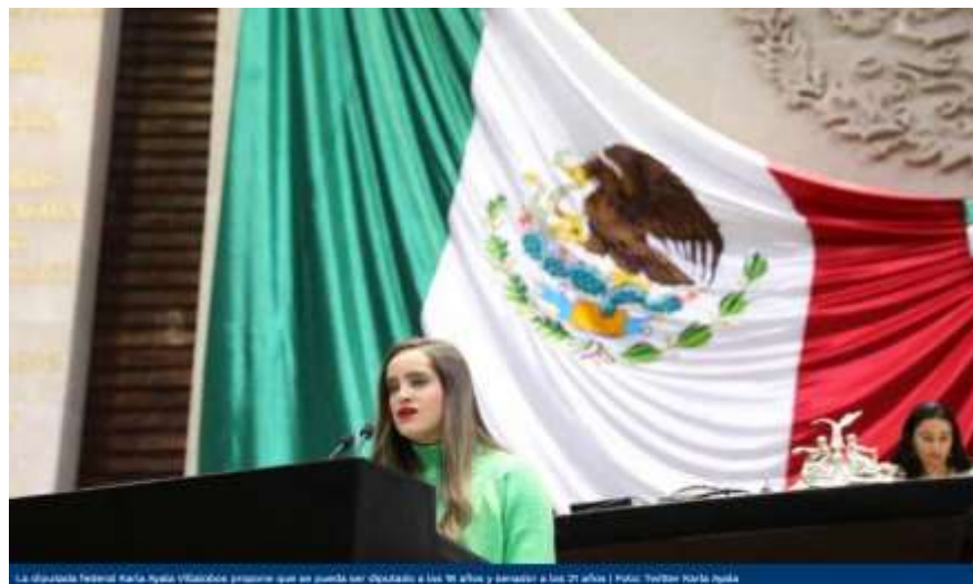
La diputada federal Karla Ayala Villalobos propone que se pueda ser diputado a los 18 años y senador a los 21 años