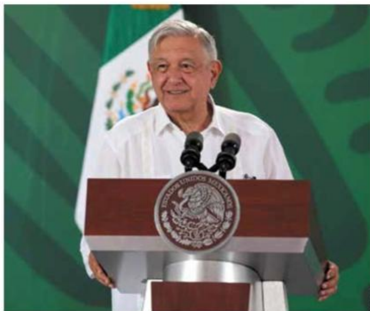
MENSAJE. El presidente Andrés Manuel López Obrador, ayer.

Agregó que “la marcha, supuestamente en contra de esa propuesta, parece más bien un intento desesperado por articular a una oposición que no encuentra liderazgos valiosos y que no encuentra causas”.