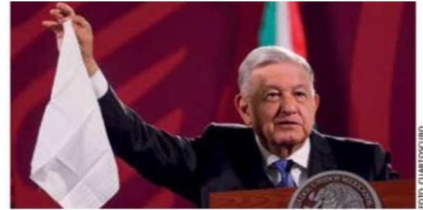
El presidente Andrés Manuel López Obrador reconoció que la oposición cuenta con los votos necesarios para bloquear su iniciativa.

También se buscará impedir la compra de votos pues, acusó, "se reúnen todos los corruptos,