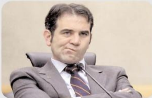
Lorenzo Córdova Vianello