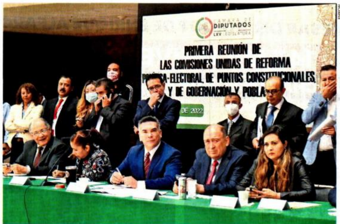
Integrantes de comisiones de la Cámara de Diputados presentaron el dictamen de reforma electoral .